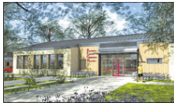
||| Brwinów - Ponad 9 mln na centrum opiekuńcze s. 5