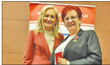
||| Żabia Wola - Medal dla pani dyrektora s. 4