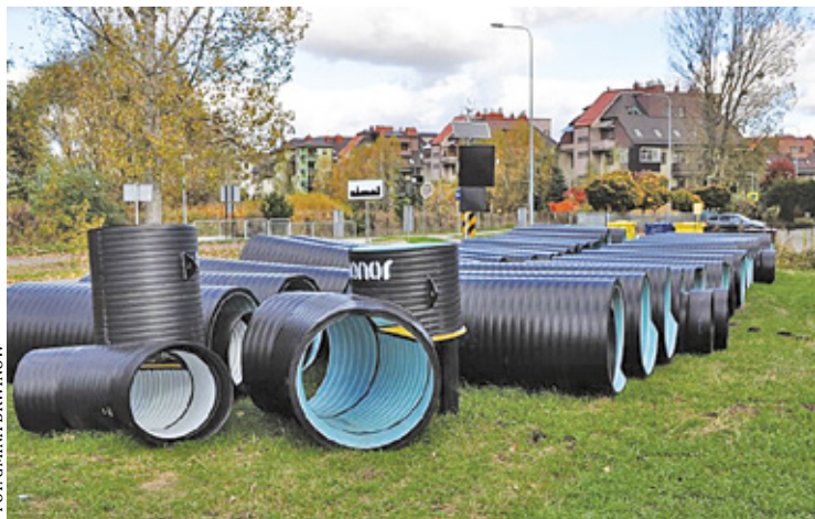
Prace mają zakończyć się w grudniu

Koszt inwestycji to ponad 1,2 miliona złotych. Wykonawca na realizację zadania ma czas do połowy grudnia. W ramach inwestycji powstanie sieć kanalizacji deszczowej doprowadzającej część wody spływającej z miasta do nowego podziemnego zbiornika re-