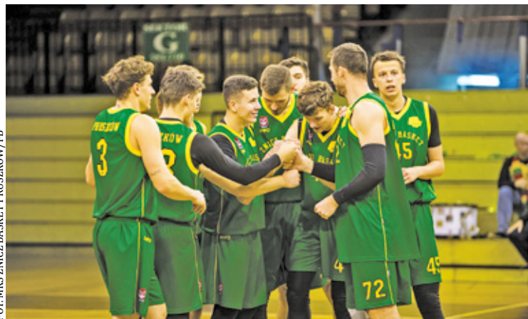
TSK Roś – Znicz Basket 68:74

Roś prowadził 54:53. W czwartej odsonnie lepsi byli gospodarze. To przesądziło o ich zwycięstwie. Znicz Basket przegrał 68:74. W spotkaniu nie brakowało zwrotów akcji, emocji, zaciętej walki.