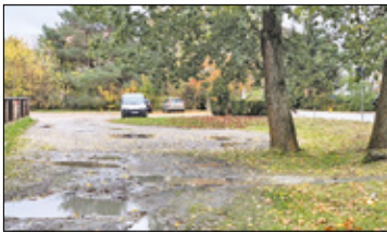
||| Michałowice - Centrum przejście zmiany s. 2