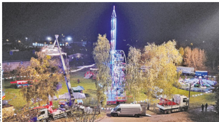
Wesołe miasteczko przy pałacu

E kipa filmowa wynajęła firmę, która rozstawiła wesołe miasteczko przy Pałacu Wierusz-Kowalskich na potrzeby nowej produkcji. Wśród atrakcji znalazły się między innymi diabelski młyn, strzelnica, elektryczne autka i