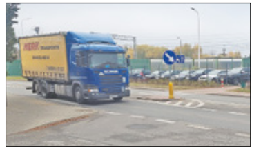
||| Jaktorów - Niebezpieczna droga s. 6