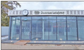
||| Milanówek - Zakończono remont dworca PKP s. 3