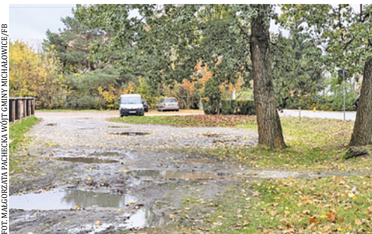
Tak obecnie wygląda teren

D ziś centrum osiedla Michałowice to teren, który nie zachwyca. Jest niezagospodarowany, a na pewno ma ogromny potencjał, który może być wykorzystany na potrzeby mieszkańców. Zresztą właśnie lokalna społeczność zwracała uwagę na problem. Dla mieszkańców ważne jest odpowiednie urządzenie terenu.