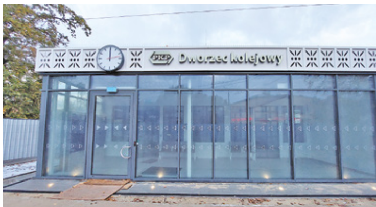
Dworzec zmieni się w miejsce przyjazne podróżnym

Ta warta 4 mln zł inwestycja polegała także na dobudowaniu części, w której znajdują się kasy przewoźni-