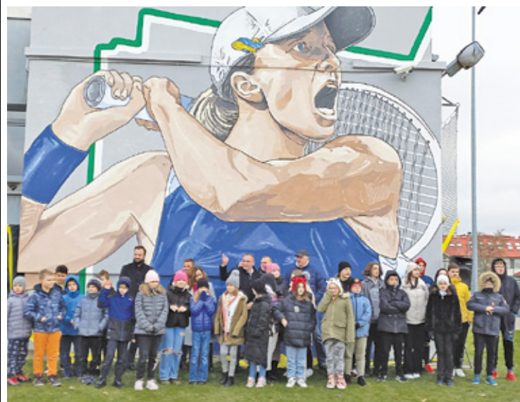
Uroczyste odsłonięcie muralu

– Mural pokazuje wojowniczą, zaciętą naturę sportsmenki. To odmienne