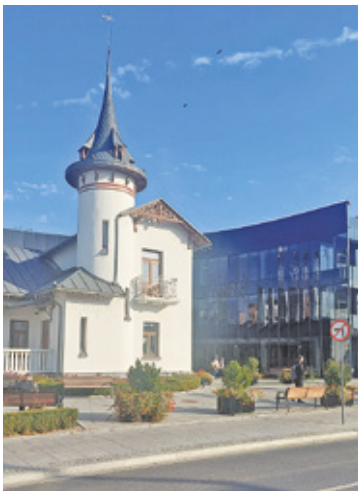
Grodzisk Mazowiecki zdobywa kolejne nagrody, bo to miasto wielkiej zmiany

Tegoroczny kongres odbył się pod hasłem: „Rozwój, nowoczesność, przyszłość”, a szczególny nacisk organizatorzy położyli na rolę samorządu, rozwój