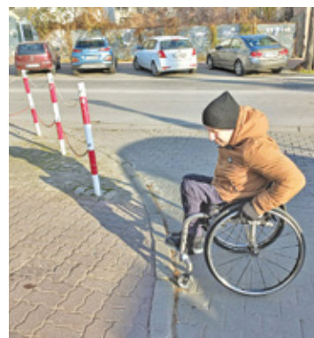
Przeszkód na mieście dla osób z niepełnosprawnościami jest wiele

Radny dojeżdża do Urzędu Stanu Cywilnego w Pruszkowie. Przy wejściu nie ma podjazdu dla wózków.