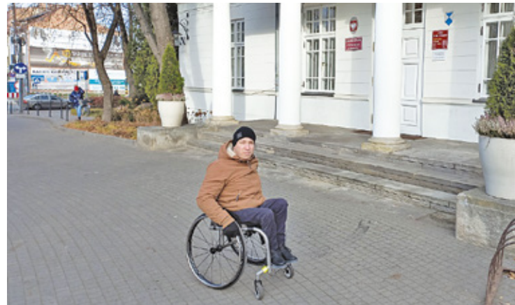
Urząd stanu cywilnego nie jest przystosowany dla mieszkańców na wózkach