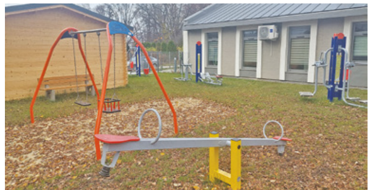
W Chlewni siłownia plenerowa będzie otwarta przez cały rok, co bardzo cieszy mieszkańców