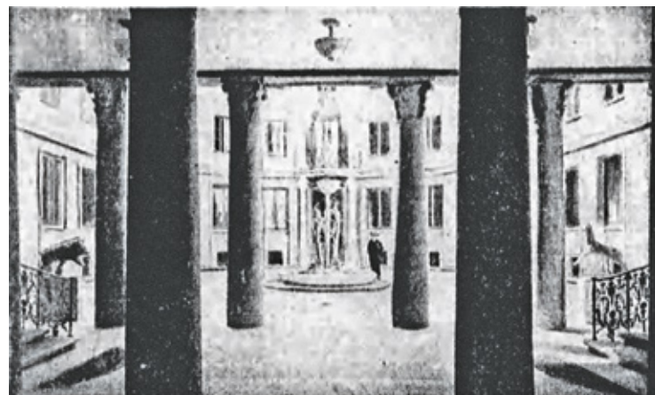
Dziedziniec pałacu Kreugera w Sztokholmie

dotychczasowych wyników pracy komisji szacunkowej, że działalność tejże, z uwagi na sposób jej prowadzenia i dobór rzeczoznawców, jest zaprzeczeniem wszelkich zasad słuszności i praworządności i prowadzi wbrew intencji ustawy do bezprawnego zrujnowania właścicieli i akcjonariuszów zgadzających się na wykupienie fabryk. Komisja szacunkowa za cenę wykupu w rozumieniu art. 18 i 19 ustawy o Monopolu Zapalczanym powinna uwzględnić ich istotną wartość gospodarczą. Projektowana przez rząd nowelizacja ustawy o