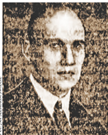
Ivar Kreuger w 1930 r.

Za początek gospodarczej działalności Ivara Kreugera, syna właściciela fabryki zapalek w Szwecji, historycy uważają rok 1911, wówczas została założona firma „Kreuger & Toll”. Było to przedsiębiorstwo budowlane z kapitałem 1 miliona koron szwedzkich. Następnie Kreuger założył spółkę akcyjną „Svenska Tändsticks Aktiebolaget” z kapitałem akcyjnym 45 mln koron, spółka ta zainteresowana była szwedzkim przemysłem zapalczanym i związała ze sobą 19 fabryk. I od tego momentu spółka Kreugera rozpoczęła ekspansję na cały świat. Na początku nawiązała współpracę z Wielką Brytanią i Stanami Zjednoczonymi i roz-