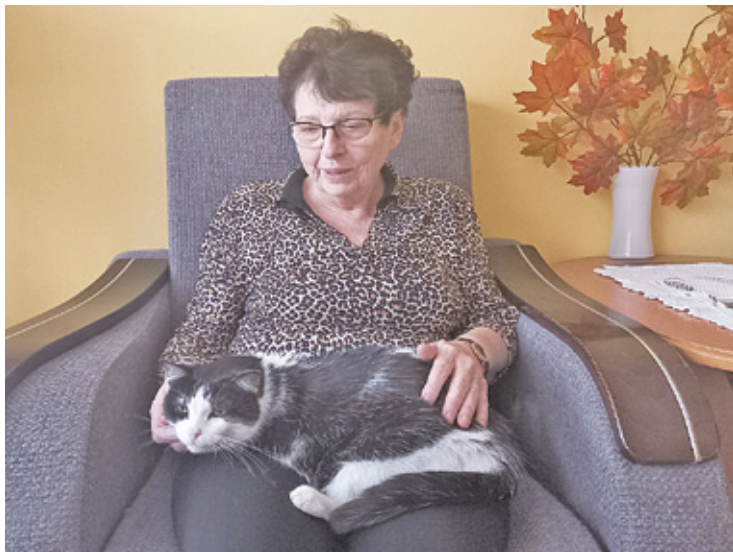
Członkowie TOZ pracują jako wolontariusze z miłości do zwierząt

Nieraz spotkałam się ze sprzeciwami i agresją ludzi, kiedy dokarmiałam bezpieczne koty. Kiedyś, czując się zagrożona, zadzwoniłam na policję. Nawet przyjmujący zgłoszenie