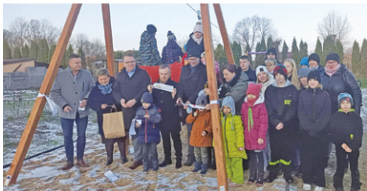
W Izdebnie Kościelnym podczas otwarcia placu zabaw padał śnieg, co nie zniechęciło mieszkańców do obecności

W sobotę otwarto dla mieszkańców, wzbogacone w nowe urządzenia i „zabawki”, cztery place zabaw i siłownie plenerowe: w Mościskach, w Oypach, w Izdebnie Kościelnym i w Chlewni.