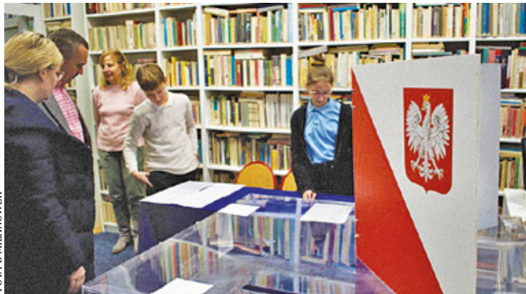
Pierwsze wybory do Młodzieżowej Rady Miasta Milanówka nie wyłoniły wystarczającej liczby kandydatów

W najbliższym czasie miasto ogłosi, kiedy odbędą się wybory uzupełniające. Wtedy też do szkół trafią formularze, na których uczniowie będą mogli zgłaszać swoje kandydatury. Znajdą się one także na stronie miasta.