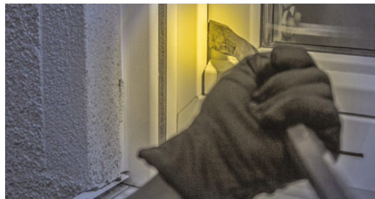
Mieszkańcy Pruszkowa czują się zagrożeni

– W moim odczuciu policja nie wiele robi. Kiedy dziecko opowiedziało mi o tych mężczyznach, zadzwoniłem po funkcjonariuszy. Nie przyjechali. Później widziałem dwie osoby, bardzo możliwe, że te same, które siedziały przy altance na śmieci i dziwnie się zachowywały. Również poinformowałem siły porządkowe. Pojawił się parę godzin później, kiedy tamci już zniknęli. Patroli na naszym osiedlu też się nie widuje. Wolę nie mówić, gdzie mieszkam, ale przecież policja wie, w których miejscach mieszkania są okradane – dodaje ofiara włamania.