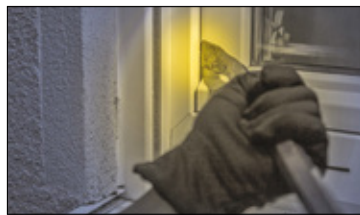
||| Pruszków - Fala włamań do mieszkań s. 2