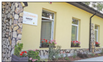
||| Michałowice - Drugie podejście s. 4