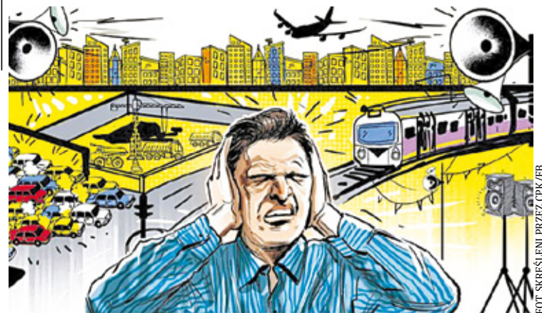
Tę obawiają się mieszkańcy gminy, przez którą ma biec węzeł kolejowy dla CPK

Na profilu „Skreśleni przez CPK” mieszkańcy Jaktorowa proszą o pomoc, w tym by mogli ochronić unikalną przyrodę swojej gminy. Petycję o utworzeniu na jej terenie chronionego prawem obszaru Natura 2000 zamieścili na swoim profilu. – Każda z form ochrony przyrody jest naszą tarczą przed zakusami CPK – piszą. Petycja ma być formą wpłynięcia na wydanie decyzji