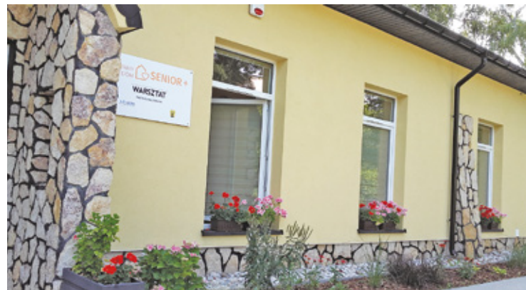
Dzienny Dom w Komorowie. Teraz w Regułach powstanie centrum opiekuńczo-mieszkalne

Pod koniec października gmina Michałowice ogłosiła przetarg na realizację zadania w formule „zaprojektuj i wybuduj”. Termin składania ofert minął 14 listopada. Urząd unieważnił postępowanie, choć wpłynęła jedna propozycja. Pojawił się jednak problem, który należy określić jako kwestię natu-