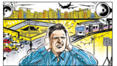
||| Jaktorów - CPKI i Natura 2000 s. 5