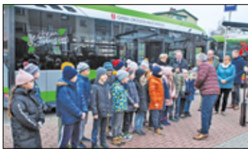
||| Grodzisk Mazowiecki - Elektryczne autobusy s. 2