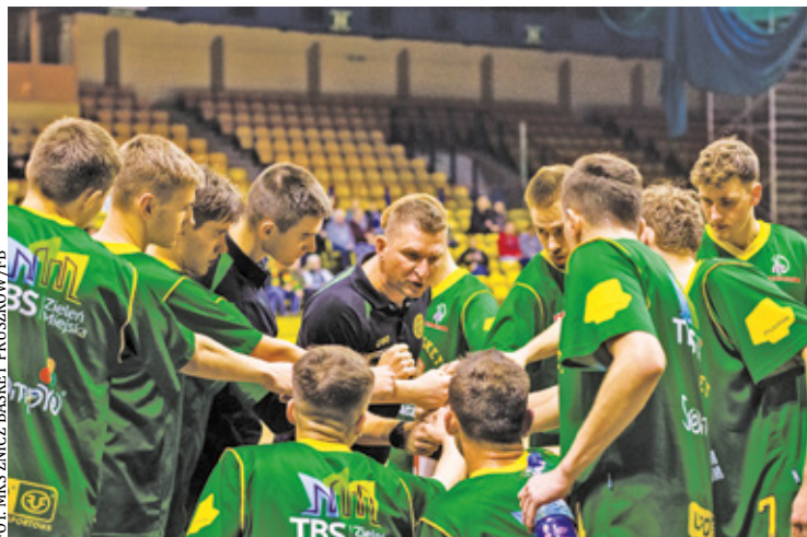
Znicz Basket jest wiceliderem rozgrywek

P ruszkowski koszykarze wygrali szósty mecz wyjazdowy. Po dziesięciu spotkaniach Znicz Basket ma na koncie 19 punktów i zajmuje 2. miejsce