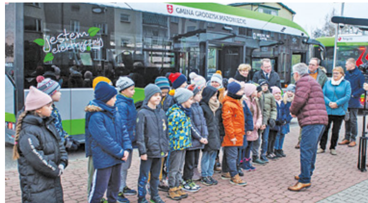
Na uroczystym otwarciu elektrycznej linii 0 obecni byli władze miasta i uczniowie Zespołu Szkolno-Przedszkolnego nr 2