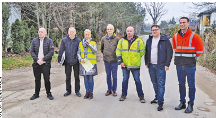
Wkład własny gminy w budowę kanalizacji w Osowcu pochodzi z obligacji, które Żabia Wola zdecydowała się wyemitować

Pierwszy etap obejmował budowę sieci kanalizacji sanitarnej grawitacyjnej i ciśnieniowej o długości 1164 m na ulicach: Rysia, Puchacza, części Za- wiałej oraz Wesołej. W dniu 17 listopa-