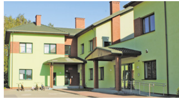
Placówka Opiekuńczo-Wychowawcza Stowarzyszenia dla Dzieci i Młodzieży Inspiracja w Wólce Grodzkiej

Na terenie Powiatu Grodzkiego działają dwa Warsztaty Terapii Zajęciowej: przy Domu Rehabilitacyjno-Opiekuńczym w Milanówku prowadzony przez Katolickie Stowarzyszenie Niepełnosprawnych Archi-