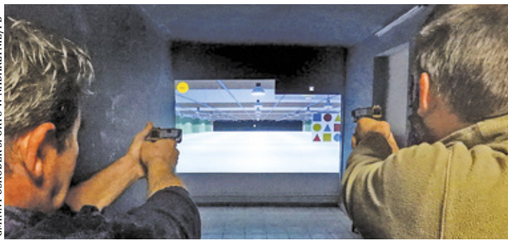
Treningi na strzelnicy odbywają się w środy

Wirtualna strzelnica to nic innego jak multimedialny i przenośny system szkolno-treningowy, który działa w wirtualnej rzeczywistości. W takich warunkach każdy może zapoznać się