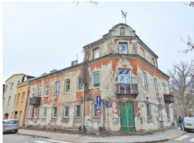
Kamienica przy ul. Ołówkowej

W Pruszkowie jest około 60 budynków o podobnym statusie, to w przybliżeniu 1/3 wszystkich lokali pod nadzorem urzędu. Miasto opiekuje się nimi i oddaje do dyspozycji mieszkańcom, jednak nie jest ich właścicielem. Jest to procedura działająca w całym kraju, jednak urząd nie ukrywa, że utrudnia to wiele działań.