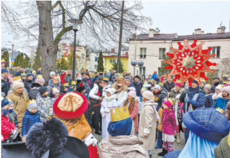
Orszak cieszył się dużym zainteresowaniem