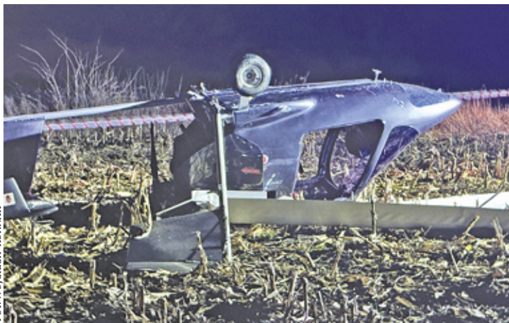
Mieszkańcy liczą na to, że wypadek wiatrakowca zakończy loty tych maszyn nad ich domami

W 2016 roku zmieniło się prawo lotnicze i już nie można startować z lotniska, które nie jest zapisane na