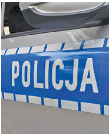
Jest jeszcze wiele aspektów sprawy do wyjaśnienia

Pojazd z piskiem opon odjechał. Samochód z dużą prędkością przejechał 2 kilometry i na zakręcie doszło do wypadku. Uderzył w drzewo. Dróżka, w którą skręcał radiowóz, prowadzi w stronę lasu i odludzia. Auto jechało w przeciwnym kierunku niż komenda policji. Po zdarzeniu młodszy policjant zapytał pasażerek, czy nic im się nie stało, starszy zaś powiedział, używając wulgaryzmu, żeby opuściły samochód. Dziewczynom nie została udzielona pomoc, nie wezwano karetki mimo poważnych obrażeń. Ta reakcja podkreśla, jaki był motyw tego uprowadzenia. To było bezpodstawne pozbawienie wolności – przekazał mecenas Roman Giertych, w serwisie informacyjnym, który reprezentuje młodszą z poszkodowanych.