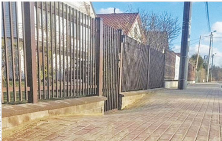
Według planów gminy chodnik na całej długości ulicy Szkolnej powinien zostać zrealizowany w ciągu najbliższych dwóch lat

Odcinek chodnika, który został właśnie oddany do użytku, liczy 230 metrów długości i 2 metry szerokości. Został wykonany z kostki brukowej. Powierzchnia chodnika została sprofilowana zgodnie z sugestiami właścicieli posesji zlokalizowanych przy tej drodze. Uniknięto dzięki temu ingerencji w ogrodzenia posesji znajdujących się przy Szkolnej. Zniwelowano także różnice wysokości pomiędzy krawężnią