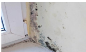
Grzyb w mieszkaniu pojawia się regularnie