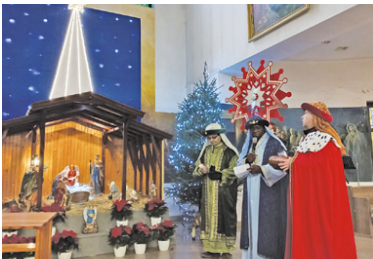
Trzej królowie składali dary w włobku

Po wysłuchaniu ewangelii dzieci i dorośli ruszyli w drogę. Mimo mroźnej pogody orszak cieszył się dużym zainteresowaniem. Po drodze do kościoła na podróży czekała jeszcze jedna niespodzianka. Przedstawienie dzieci ze szkoły nr 3 w Piastowie opowiadające o dziejach narodzin Chrystusa.