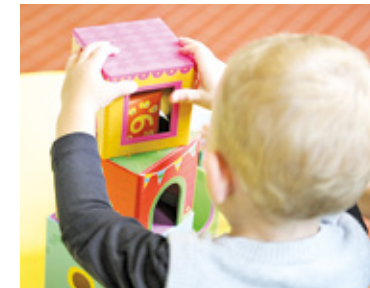
Miejsca w żłobkach dla najmłodszych dzieci z Piastowa mogą znaleźć się w Warszawie

Na granicy z Piastowem znajduje się jeden z takich żłobków. Placówka nr 72 przy ul. Henryka Pobożnego, która