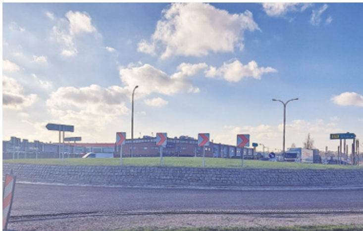
Zjazd na autostradę zostanie bez zmian mimo konieczności przeprowadzenia dalszych prac na rondzie

To ważna informacja, gdyż na początku stycznia inwestycja została