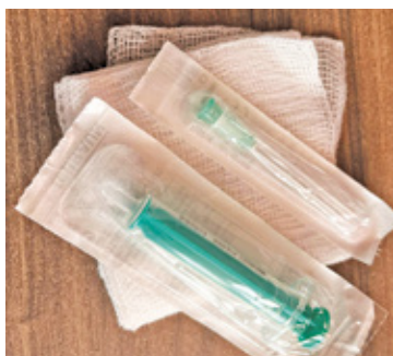
Szczepienia przeciwko HPV są dla dzieci w wieku 13-14 lat

Trzeba dbać o zdrowie. Gmina Michałowice zachęca mieszkańców do skorzystania z darmowych programów profilaktycznych, w tym m.in. szczepień przeciwko wirusowi HPV.