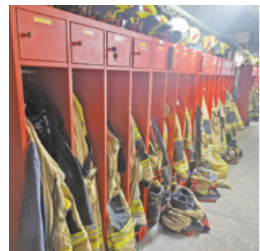
Szatnia w hali zastępczej siedziby jest już gotowa

W zeszłym roku milanowscy strażacy brali udział w 316 akcjach, większość związana była z wichurami. Nikt nie uległ wypadkowi. Rok 2023 zaczął się z przytupem. Już pierwszego stycznia wybuchły dwa pożary i zdarzył się wypadek karetki. Dodajmy też, że to już z zastępczej siedziby strażacy z OSP wyruszyli do największego od lat pożaru w mieście, czyli drewnianego domu przy Wigury.