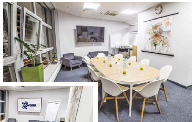
Stworzona i wyposażona Przestrzeń CoWork cieszy się dużym zainteresowaniem przedsiębiorczych mieszkańców gminy

prawnej. Warunkiem skorzystania z tej profesjonalnej przestrzeni biurowej jest dokonanie rezerwacji, która polega na wypełnieniu formularza na stronie www.biznes.grodzisk.pl/cowork . W formularzu trzeba podać dane rejestracyjne firmy lub dane osobowe przyszłego użytkownika. Przestrzeń coworkingowa dostępna jest w dni powszednie w godzinach pracy urzędu miejskiego, a mieści się przy ul. Spółdzielczej 9 w Centrum Kultury.