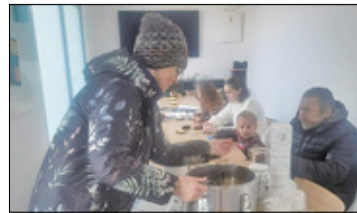
||| Brwinów - Zupa na targowisku s. 5