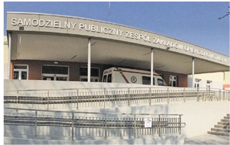
Szpital we Wrzesinie

Od lat mieszkańcy powiatu pruszkowskiego mierzą się z problemem braku SOR-u. Ofiary wypadków i pacjenci z zagrożeniem życia, często muszą być transportowane do Warszawy lub Grodziska Mazowieckiego.