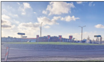
||| Grodzisk Mazowiecki - Rondo do poprawki s. 2