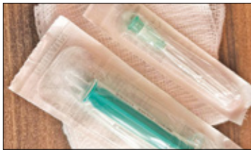
||| Michałowice - Darmowe leczenie s. 2