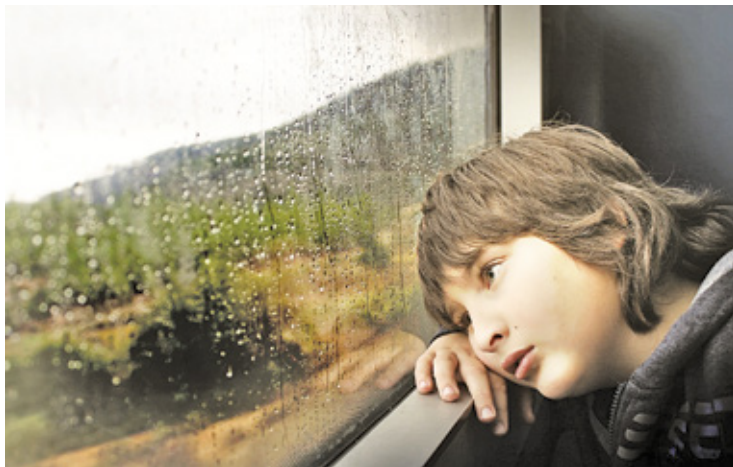
Przez ostatnie lata coraz więcej dzieci czuje samotność. To my, dorośli, możemy pomóc najmłodszym w trudnych chwilach życia

– W ostatnim czasie pandemia oraz obecnie wojna w Ukrainie spowodowała nasilenie problemów młodzieży, przede wszystkim samotności. Kontakt za pomocą telefonu lub komputera nie jest w stanie zastąpić bezpośredniego przebywania z drugim człowiekiem, nawiązania kontaktu wzrokowego, możliwości obserwacji i odczytywania mimiki, mowy ciała, analizy prezentowanych emocji: radości, smutku i innych. Wśród problemów, które stanowią czynniki ryzyka samobójstwa wśród dzieci i młodzieży (poza zaburzeniami natury psychiatrycznej), moż-