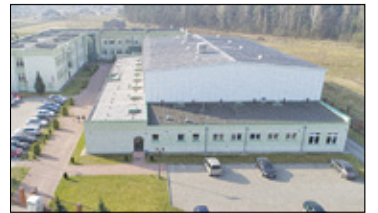
||| Nadarzyn - Duży awans liceum s. 6