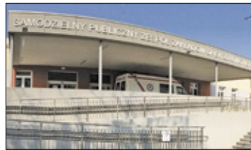
||| Powiat Pruszkowski - Marzenie o SOR-ze s. 5