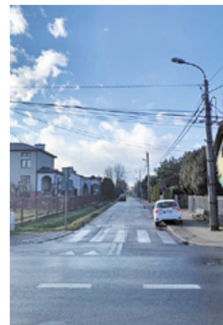
FOT. MAŁGORZATA PACHECKA WÓJT GMINY MICHAŁOWICE/PB

Ścieżki będą naturalne, bo miejscowy plan zagospodarowania nie dopuszcza wykonania na tym terenie utwardzeń. Posadzone zostaną również drzewa. – Ta inwestycja wiąże się ze zobowiązaniami, jakie Gmina Michałowice wzięła na siebie, podpisując ze Wspólnotą Gruntową akt notarialny, w którym również uzyskała prawo do wybudowania infrastruktury sportowej jak służące dzieciom pięknie boisko sportowe – tłumaczy wójt gminy Michałowice.