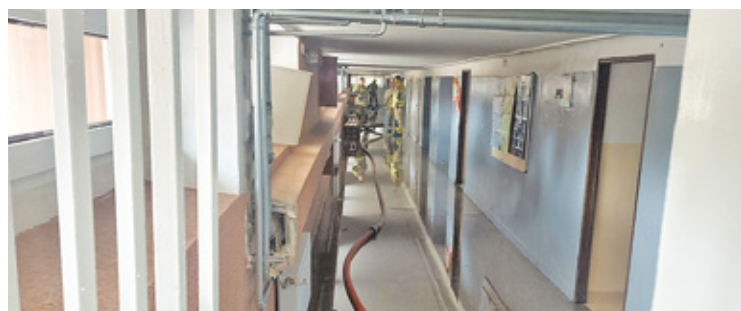
Najbardziej zalane były pomieszczenia poniżej poziomu gruntu

Po wejściu do szkoły widać było przyczynę. Szkoła została zalana.