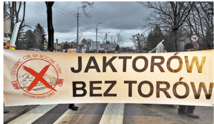
Mieszkańcy Jaktorowa jako piersi zaczęli uliczne protesty przeciwko inwestycjom dla CPK

Możliwość zwrócenia się przez samorządy do Trybunału Konstytucyjnego potwierdził w tym miesiącu Rzecznik Praw Obywatelskich prof. Marcin Wiącek, podczas spotkania z Radą Społeczną ds. CPK. Jest to niezwykle ważne, gdyż ta ustawa umożliwia przeprowadzenie wielu inwestycji planowanych przez CPK, a oprotosto-