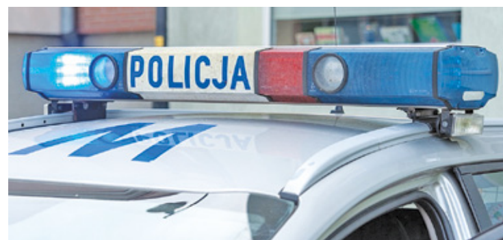
Policja zatrzymała podejrzanych

P od koniec lutego sześcioro napastników pobiło nieletniego chłopca.