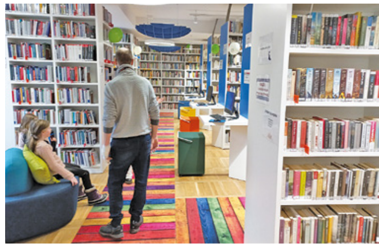
„Nasze pełne zbiory obejmują około dwustu tysięcy książek i podobną ilość zbiorów specjalnych”

osób z niepełnosprawnościami, prze-malowano i odnowiono wszystkie pomieszczenia. Wstawiono nowe regały i komputery. Zakres prac był naprawdę