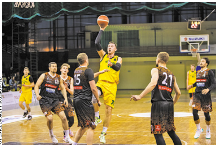
Znicz Basket pokonał Energa 67:62