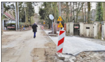
||| Podkowa Leśna - Zmiany zasad ruchu s. 2