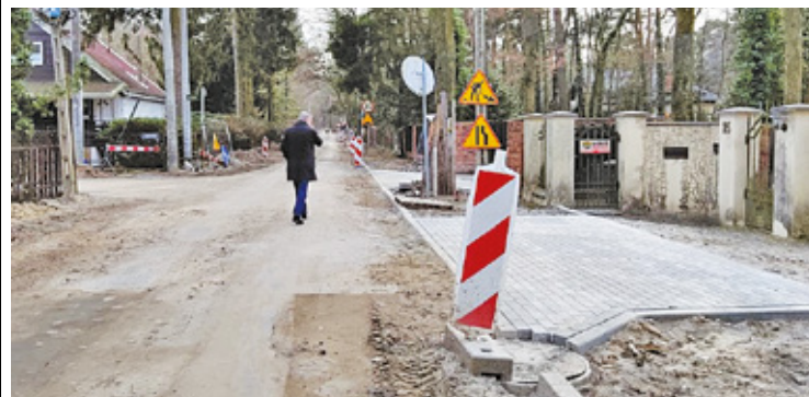
Miasto wybudowało i utwardziło 18 km dróg, a kolejne podkowieńskie ulice są remontowane

Tematem trudnym do zrealizowania jest poprawa bezpieczeństwa na ulicy Jana Pawła II, czyli głównej ulicy w mieście. Przebudowa skrzyżowania tej ulicy z ulicą Akacjową oraz doświetlenie przejść dla pieszych, zostały uniezwolnione przez ekologów, którzy zawioskowali o wpisanie części ulicy Jana Pawła II do rejestru zabytków, wyjaśnia burmistrz. Do czasu zakończenia postępowania, nie mogą być na tym odcinku prowadzone prace budowlane.