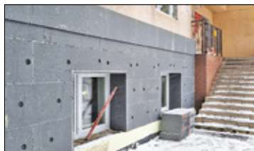
||| Żabia Wola - Będzie cieplej s. 3