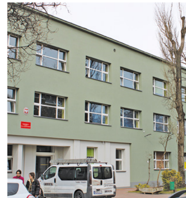
Zespół Szkół nr 1 w Milanówku po termomodernizacji.

Ostatnio na obiektach użyteczności publicznej zbudowano instalacje fotowoltaiczne . Panele zamontowano na zespołach szkół: nr 1 i nr 2 w Milanówku, nr 1 i nr 2 w Grodzisku Mazowieckim i Zespole Szkół Specjalnych w Grodzisku Mazowieckim oraz w budynku administracyjnym Starostwa Powiatu Grodzkiego, w którym mieści się Centrum Kształcenia Zawodowego w Grodzisku Mazowieckim. W ubiegłym roku zakończono termomodernizację Zespołu Szkół nr 1 w Milanówku . Ocieplono ściany zewnętrzne budynku i stropodach, wymieniono stolarkę okienną i drzwi zewnętrzne.