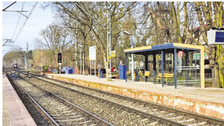
Nowa wiata na stacji WKD Podkowa Główna to zapowiedź remontu budynku dworca

Na przystanku WKD w Podkowie Głównej stanęła nowa wiata. Od kilku miesięcy, podobna stoi w Podkowie Zachodniej. Niebawem rozpocznie się remont budynku stacji. Wykonawca podejmie próbę odtworzenia historycznego napisu z nazwą stacji. Zieleń wokół dworca ma także odzyskać wygląd zapisany w historii miasta-ogrodu.