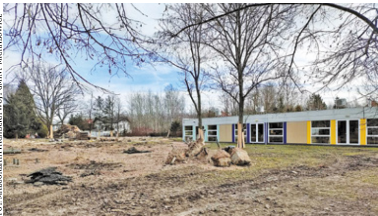
Przedszkole ma być gotowe latem 2024 roku

FOT. MAŁGORZATA PACHECKA WÓJT GMINY MICHAŁOWICE