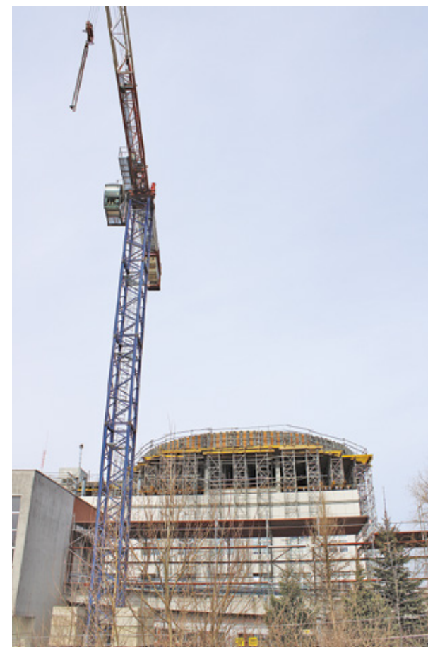
Budowa łądowiska dla potrzeb SOR Szpitala Zachodniego w Grodzisku Mazowieckim.

We wszystkich przypadkach wartość wnioskowanego dofinansowania wynosi 100%.