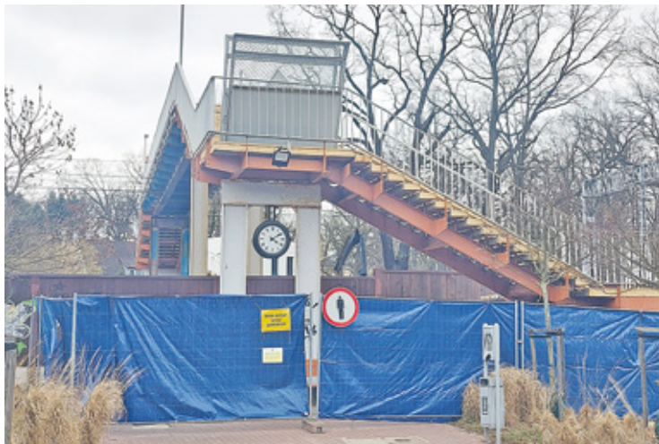
Remont kładki nad torami to jedna z wielu inwestycji, jakie dziś prowadzi miasto