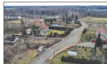
||| Nadarzyn - Finał na Głównej coraz bliżej s. 9