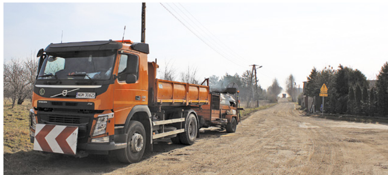
Prace rozpoczęte na drodze powiatowej nr 2855W – ul. Słowika w Zarębach, gmina Żabia Wola.

Z inwestycji planowanych do realizacji jeszcze w tym roku można wymienić rozbudowę drogi nr 2855W ul. Słowika