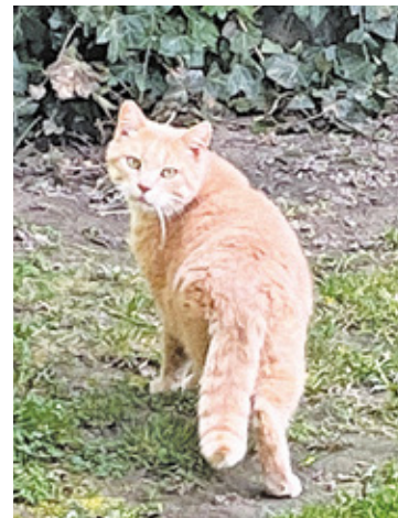
Społeczni opiekunowie czynią wiele dobra

Osoba znajdująca się w rejestrze może liczyć na wsparcie. Opiekun otrzyma karmę dla kotów. Wystarczy mieć skończone 18. lat, aby zostać społecznym opiekunem i zgłosić się do Urzędu Gminy Raszyn do pokoju 2B celem złożenia odpowiedniego wniosku. Trzeba podkreślić, że formularz będzie podlegał weryfikacji. Po zweryfikowaniu miejsca bytowania i dokarmiania