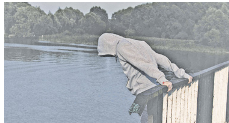
Specjaliści mogą pomóc dziecku i rodzicom. Jeśli sytuacja tego wymaga, warto sięgnąć po ich pomoc

We wszystkich zbadanych przez Prokuraturę Rejonową w Pruszkowie przypadkach śmierci dzieci, nie stwierdzono, aby były one nakłaniane do targnięcia się na własne życie. Nie stwier-