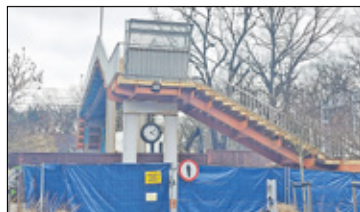
||| Milanówek - Remont kładki nad torami s. 2