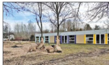
||| Michałowice - Przedszkole i świetlica wiejska s. 5