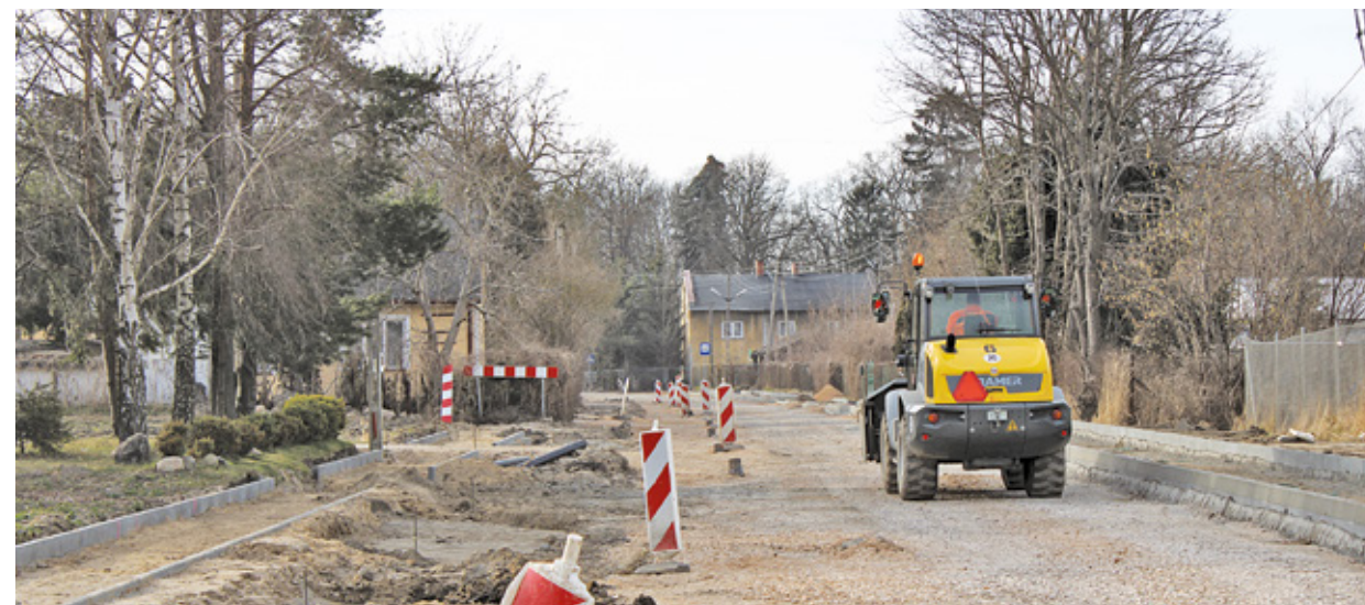
Prace trwające na drodze powiatowej nr 1508W w Chlebni, gmina Grodzisk Mazowiecki.

Tu chciałbym wspomnieć, że w poprzednim roku już został wyremontowany inny odcinek tej drogi. Za kwotę ponad 4,7 mln zł przebudowano odcinek o długości 870 m, wykonano chodniki, zjazdy, pobocza oraz aktywne znaki z zasilaniem solarnym na przejściu dla pieszych. Wartość dofinansowania z Rządowego Funduszu Rozwoju Dróg wynosiła 3 321 729 zł.