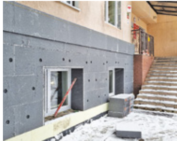
Termomodernizacja Urzędu Gminy zaczęła się kilka tygodni temu. Potrwa do końca roku

Gmina Żabia Wola rozpoczęła termomodernizację budynków Urzędu Gminy oraz Ośrodka Zdrowia.