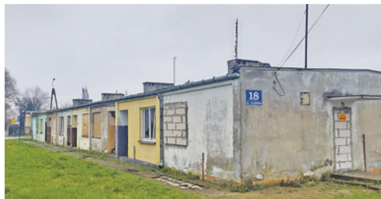
Baraki przy Ułańskiej wkrótce zastąpią nowe domy z mieszkaniami komunalnymi

oba budynki nadają się do remontu, ale ponieważ to zabytki koszty byłyby zbyt duże, aby miasto mogło się tego podjąć. Dlatego będzie budować nowe domy przy Ułańskiej. Na tę inwestycję 80 proc., pieniądze przekaże BGK, a 20 proc. gmina. Jednak ta inwestycja nie rozwiąże wszystkich problemów lokalnych, jakie ma miasto.