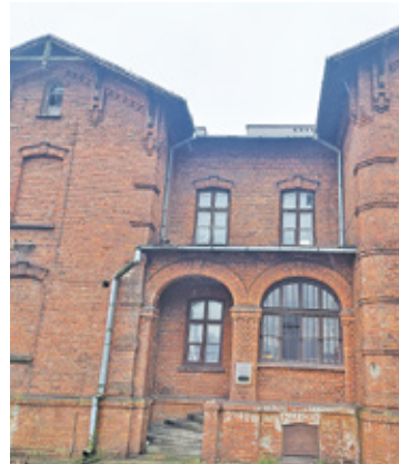
Zabytkowa kamienica przy Langiewicza wymaga remontu, na który miasto nie stać

Mieszkańcy domu przy Bałtyckiej i Langiewicza nie mogą doczekać się inwestycji zapowiedzianej przez bur-