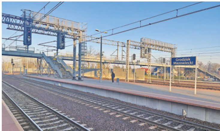
Wzrost liczby pociągów pociesza w czasie kiedy remonty powodują wiele utrudnień w codziennych podróżach koleją do pracy