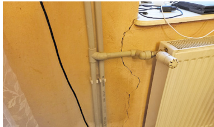
Usterka w kamienicy

– Cały czas pojawiają się nowe pęknięcia, a stare się powiększają. W niedawno opublikowanym piśmie TBS twierdzi, że monitoruje stan techniczny naszej kamienicy, uszkodzenia zaś są naprawiane na bieżąco. To nieprawda. Remont został przeprowadzony tylko w 1 lokalu i to dlatego, że mieszkaniak niemalże codziennie pisał i dzwonił do TBS. Jest tu 18 mieszkań, co oznacza, że w 17 nic nie zrobiono – powiedzieli mi mieszkańcy.