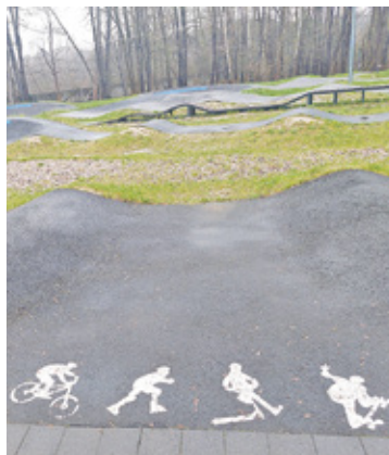
Skatepark w Podkowie Leśnej to jedno z nielicznych miejsc dedykowanych młodym mieszkańcom Trójmiasta Ogrodów

W ankiecie są także pytania dotyczące uczestnictwa młodych w pra-