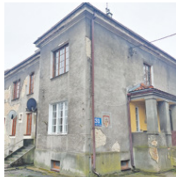
Kamienica przy Bałtyckiej róg Spiskiej także czeka na remont

Niestety ewentualna przeprowadzka nie nastąpi tak szybko. Prze-