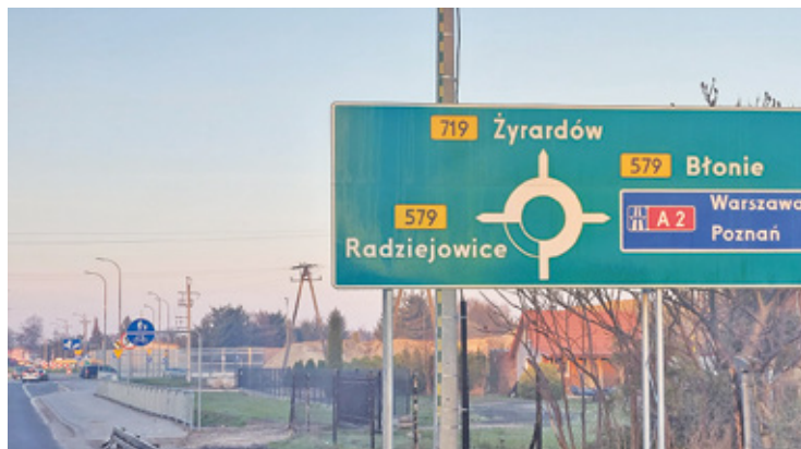
Dla mieszkańców powiatów grodzkiego i pruszkowskiego A2 jest ważną, codzienną drogą dojazdową

Celem inwestycji planowanej przez Generalną Dyрекcyję Dróg Krajowych i Autostrad jest zwiększenie przepustowości A2. Droga budowana była w związku z piłkarskimi Mistrzostwami Europy w 2012. Jednak przez te ponad 10 lat użytkowania ruch na A2 znacznie się zwiększył. Z analiz przeprowadzonych przez specjalistyczne służby