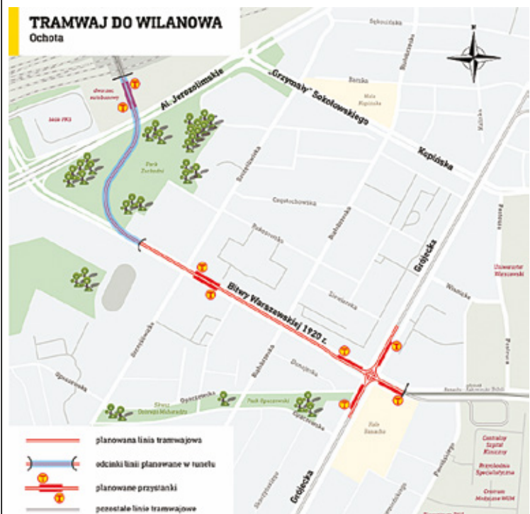
Tak będzie wyglądała trasa

500 metrów, pod parkiem Pięciu Sióstr. Wyjazd z tunelu ma się znajdować między jezdniami ulicy Bitwy Warszaw-