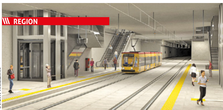
Podziemny tramwaj ma ruszyć w drogę już w 2026 roku

||| Grodzisk Mazowiecki – Przybędzie mieszkań komunalnych s. 5