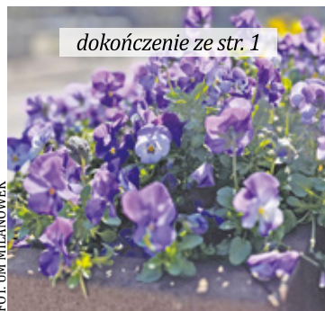
dokończenie ze str. 1

Na dniach rozpoczną się również prace porządkowe na skwerze na rogu ulic Słowackiego i Zachodniej. Zostaną tam wykonane alejki oraz nasadzenia w postaci kwitnących rabat, oraz żywopłotu. Zobaczymy tam: kalinę, szalwię łąkową, wawrzynek, grab pospolity, głąg jednoszyjkowy.