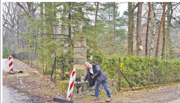
Burmistrz miasta szuka rozwiązania problemu: jak pogodzić inwestycje i dbałość o historię

Po apelu, jaki skierował do burmistrza o zwiększenie ochrony figurki na okres przebudowy, pojawiły się przy niej białe czerwone przegrody.