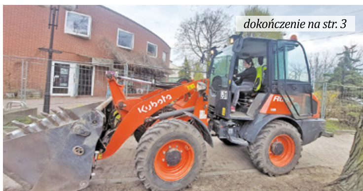
dokończenie na str. 3

S kwier Ossendowskiego znajdujący się przy stacji PKP będzie bardzo