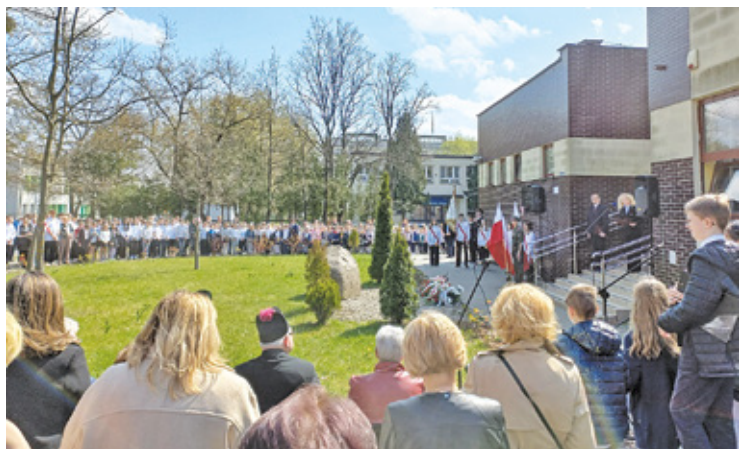
83. Rocznicą Zbrodni Katyńskiej

– Ofiary zastrzelone przez członków NKWD zostały przez sowieców opisane jako osoby, które „nie rokowały”. Właśnie tego nam wszystkim życzę.