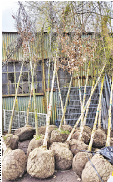
W Podkowie Leśnej już czekają drzewa, które będą posadzone podczas Dnia Ziemi

Drzewa będą sadzone tego dnia na nieruchomości gminnej we wsi Kady