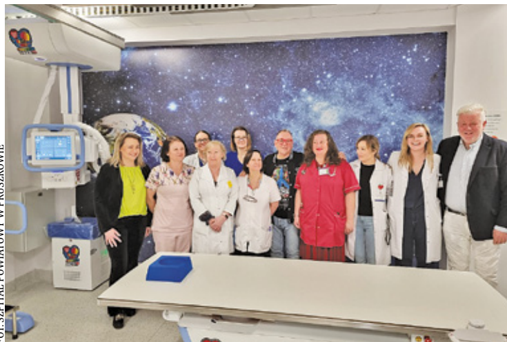
Pracownia RTG to kolejna zrealizowana inwestycja przy współpracy placówki z Fundacją Wielkiej Orkiestry Świątecznej Pomocy

– Była to kolejna rzecz, której potrzebował nasz szpital, dlatego skontaktowałem się z Wielką Orkiestrą Świątecznej Pomocy i poprosiłem o pomoc. Na szczęście się udało. Urządzenie, które otrzymaliśmy to sprzęt z najwyższej półki, bardzo dokładny