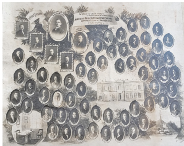
Fotografie uratowane w urzędzie miasta