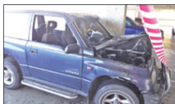
||| Pruszków - Płoną auta w mieście s. 5