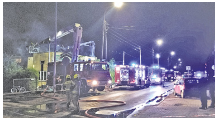
Ogień gaszono przez wiele godzin z powodu licznych zagrożeń

G aszenie pożaru trwało kilka godzin i wymagało pokonania wielu zagrożeń dla bezpieczeństwa biorących udział w akcji strażaków.