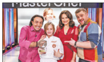
||| Milanówek - Dwunastolatek mistrzem kuchni! s. 6