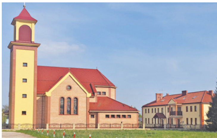
Mieszkańcy mówią o proboszczu, że to dusza człowiek, czemu został zawieszony?

Kiedy słyszy się o zawieszeniu księdza wielu od razu myśli o najgorszym. Pyta o dzieci. Czuje niepokój. Tym razem sytuacja jest inna. Czyn, który zarzuca się proboszczowi Adamowizny, dotyczyć miał osoby powyżej 15 roku życia. A więc zarzucono księdzu złamanie zasad obyczajowych, prawa kanonicznego, a nie przestępstwo w myśl kodeksu karnego, które chroni dzieci i młodzież.