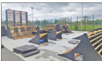
||| Milanówek - Wielkie otwarcie skateparku s. 2