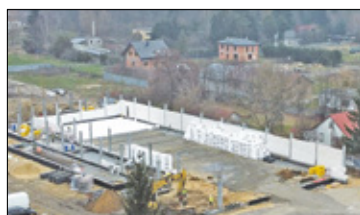
||| Otrębusy/Brwinów - Spór o sklep s. 2