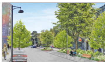
||| Pruszków - Spór o przebudowę ul. Kościuszki trwa s. 3