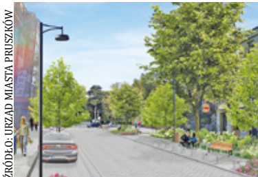
Wizualizacja ulicy Kościuszki

Przebudowa ulicy Kościuszki w Pruszkowie stoi pod znakiem zapytania. Czy 24 miliony złotych to zbyt wysoka cena za wizytówkę miasta?