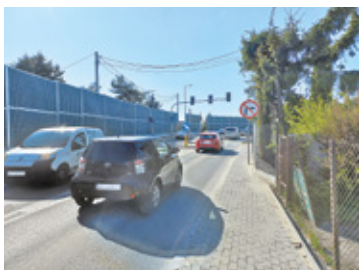
Ul. Lisa Kuli

Wyjeżdżając z ulicy Brandta na drogę Przerwy Tetmajera, kierowcy mają pierwszeństwo przed pojazdami z lewej strony. Niestety, droga jest w tym