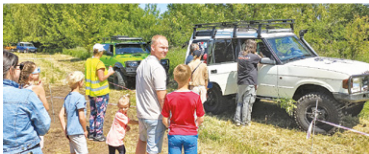
Podczas pikniku można było odjąć przejażdżkę samochodem terenowym

W Brwinowie mieszkańcy mieli okazję bawić się na pikniku, Offroadowym zorganizowanym z okazji Dnia Dziecka. To już trzecia edycja tej niezwykłej zabawy. Jej główną atrakcją była możliwość przejażdżki po brwinowskich bezdrożach i specjalnie przygotowanych ścieżkach w prawdziwych samochodach terenowych prowadzonych przez lokalnych kierowców.