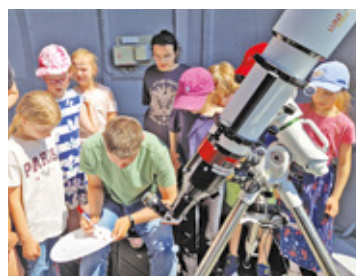
Planetarium i obserwatorium astronomiczne w Grodzisku odwiedzają chętnie najmłodszy mieszkańcy miasta

Nagrodą, którą może także poszczycić się samorząd Grodziska Mazowieckiego,