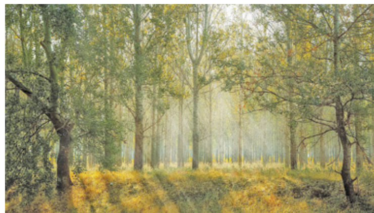
„Zielony pierścień ma tworzyć nie tylko las, ale także tereny przyrodnicze objęte różnego rodzaju ochroną, jak mokradła, a także nieużytki i pola uprawne”

Warszawa rozleje się na wszystkie podmiejskie gminy?