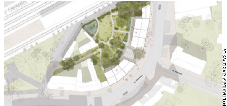
Miasta-ogrody budowane były na planie koła, którego centralnym miejscem miał być park