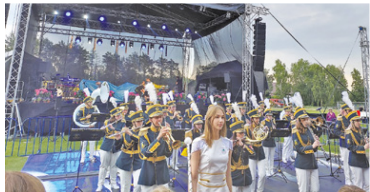
Orkiestra OSP Nadarzyn