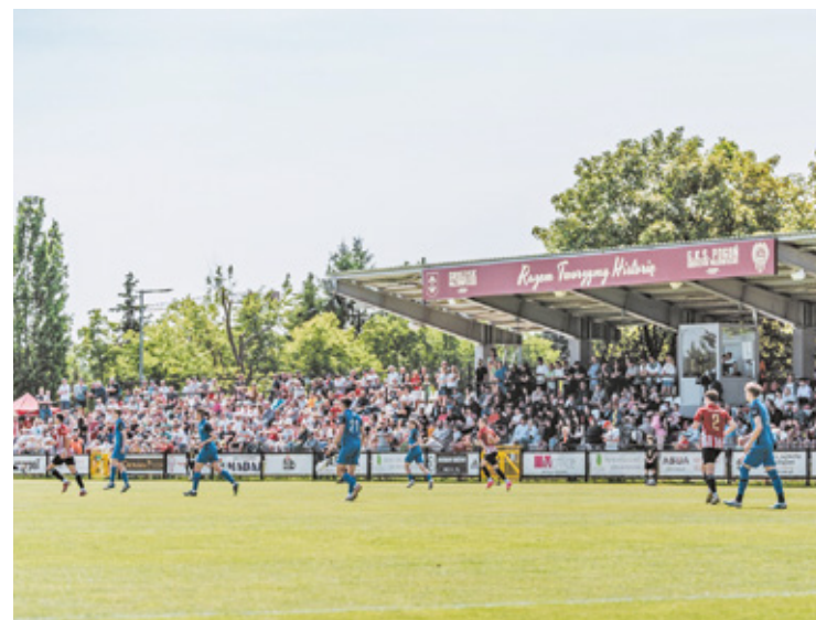
Pogoń Grodzisk Mazowiecki walczyła do samego końca, ale finalnie musiała zadowolić się trzecim miejscem

Przed ostatnim spotkaniem sezonu Pogoń i ŁKS dzieliły 2 punkty. W tej serii gier mecze toczyły się równolegle. Po pierwszych 70 minutach todzianie wygrali z Olimpią Zambrów, a Mławianka Mława prowadziła z Pogonią. Ostatecznie ŁKS wygrał w Zambrowie