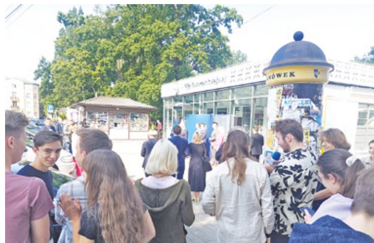
Otwarcie dworca PKP cieszy mieszkańców, zwłaszcza że dawny budynek zmieni się w miejsce przyjazne i wygodne

matyzowana poczekalnia, wyposażona w wygodne siedziska, a także elektroniczne tablice przyjazdów i odjazdów pociągów – dodał.