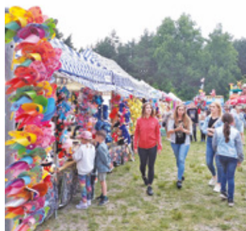
Festyn cieszył się dużym zainteresowaniem

Koncerty to nie wszystko, co przygotowała gmina na ten wyjątkowy dzień. Do dyspozycji gości były liczne ogródki gastronomiczne, food trucki, dmuchańce i stoiska z pamiątkami. Dodatkowo specjalnie na tę okazję roztawiono wesołe miasteczko, gdzie dzieci mogły spędzić czas, korzystając z kolejek górskich, huśtawek czy elektrycznych samochodów.