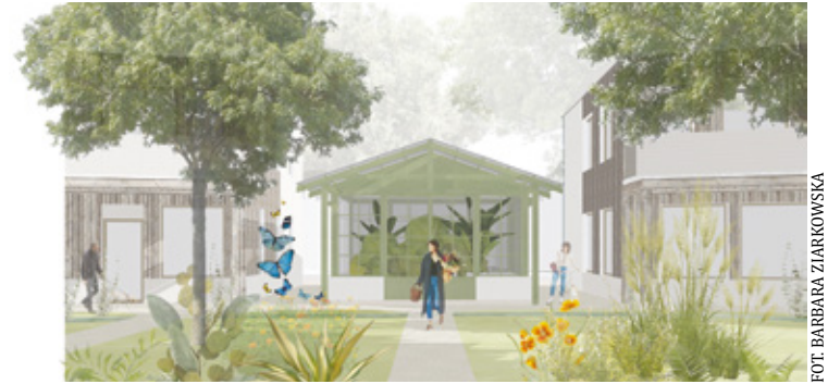
Zielone centrum mogłoby być miejscem do odpoczynku, ale też coraz bardziej popularnej pracy zdalnej

Centralny park – plac miał ogromny sens, gdyż zgodnie z ideą miast-ogrodów Ebeneza Howarda miały one być satelitami metropolii, by być miejscami odpoczynku dla ich miesz-