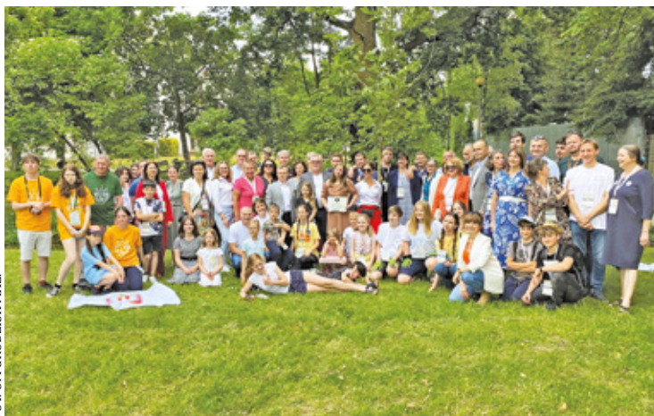
Zjazd to był czas integracji, wspólnej zabawy, działania, ale też dyskusji o sytuacji rodzin w czasie zmian klimatu