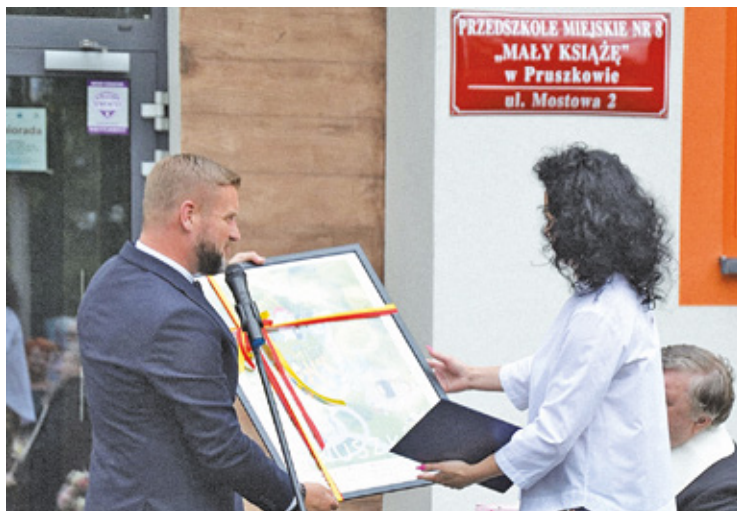
Uroczystość nadania imienia

W przyszłości placówka pomieści 10 grup dzieci zapisanych tylko do przedszkola nr 8. Oznacza to, że przyjęcie dwukrotnie więcej pociech niż dotychczas.