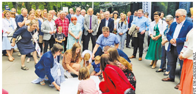
Odsłonięcie tablicy pamiątkowej