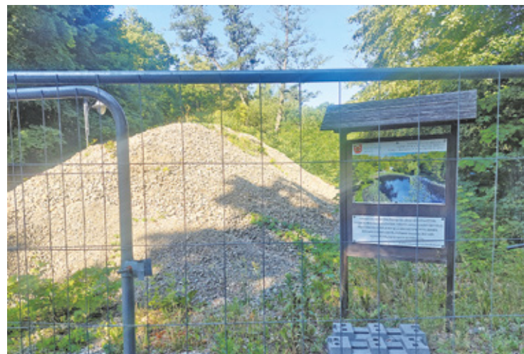
W miejscu, gdzie był staw, dziś piętrzą się materiały budowlane

Burmistrz zaproponował, że miasto wycofa się z pozwu przeciwko Dendropolis, zrezygnuje z żądania przeprosin, sprostowania treści broszury oraz roszczeń finansowych. W zamian oczekuje od Dendropolis wycofania ich odwołania do Ministra Kultury od decyzji Mazowieckiego Wojewódzkiego Konserwatora Zabytków z września 2021. Zdaniem burmistrza pozwoli to na zakończenie robót budowlanych, polegających na przebudowie stawu na podstawie projektu z maja 2021 r.