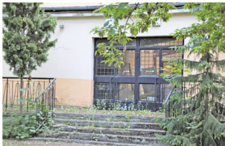
Taras kina „Wolność”

kina, czyli organizowanie regularnych seansów filmowych. Niemniej dzieci nadal mogły przychodzić na seanse poranków, młodzież szkolna na seanse Kina Lektur Szkolnych, a miłośnicy dobrego kina uczestniczyli w pokazach w ramach Młodzieżowej Akademii Filmowej, podczas których można było obejrzeć arcydzieła filmowe, jak i spotkać się ze znanymi ludźmi kina czy krytykami filmowymi. Co ciekawe, mimo szyldu Ośrodka Kultury na bu-