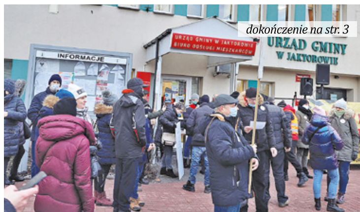
Mieszkańcy gminy od wielu miesięcy protestują przeciwko budowie na ich terenie węzła kolejowego dla CPK