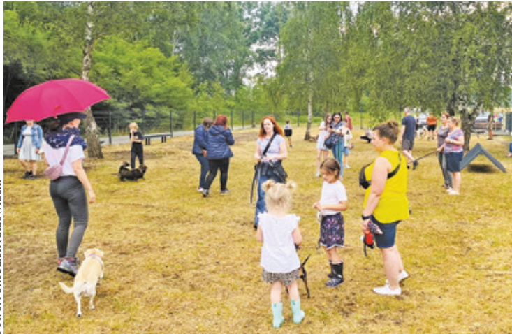
W Grodzisku Mazowieckim przy ulicy Na Laski otwarto już wybieg dla psów

Wybieg dla psów mierzy 800 m kw. Zwierzaki nie wydadzą się stamtąd