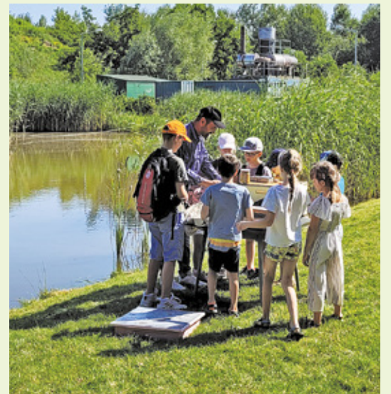
Dzieci podczas warsztatów Akademii Ekologicznej Amest Otwock

Istotne w ograniczaniu negatywnego wpływu na przyrodę są dobre nawyki. Zamiast samochodu warto przemyśleć wybór środka transportu o niższej emisji dwutlenku węgla