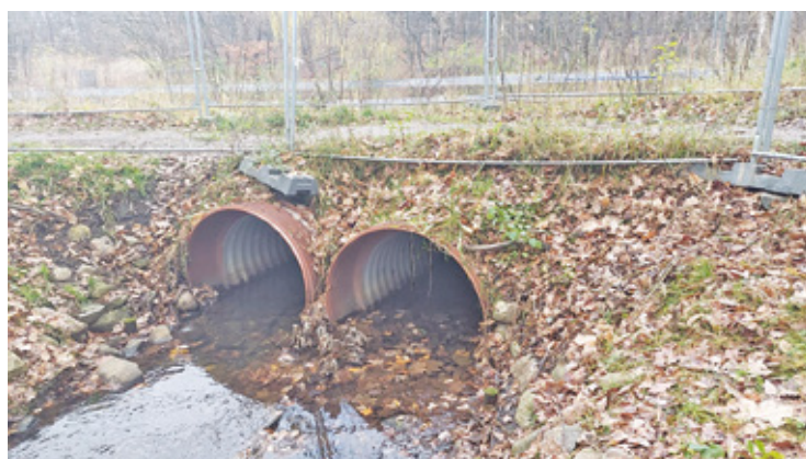
Ten widok sprawił, że modernizacja stawu mimo zalet wzbudziła też wiele niepokoju i krytyki

Dopiero w czerwcu tego roku odbyła się pierwsza rozprawa z powództwa miasta przeciwko Dendropolis o naruszenie dóbr osobistych. Po rozprawie