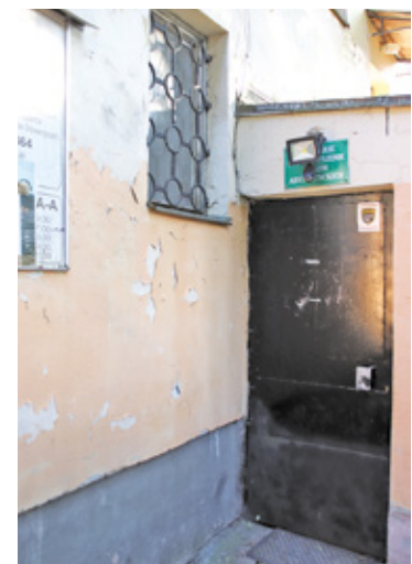
Wejście do dawnego klubu „Opty”

Ostatnio w miejscu kina swoje treningi odbywali tenisiści stołowi klubu Dartom Bogoria Grodzisk, którzy przenieśli się już na przystosowaną do potrzeb klubu salę treningową w nowej