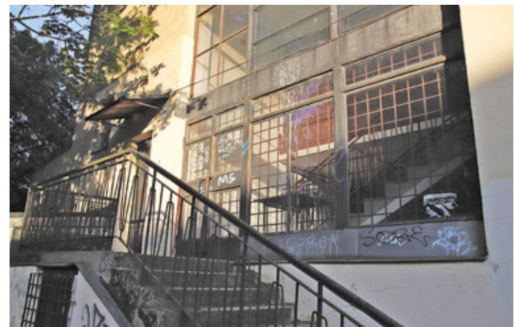
Wyjście z kina nad klubem „Opty”

Dzisiaj, gdy rozpoczęła się jego rozbiorcza ze względu na zły stan techniczny, warto przyjrzeć się jego historii