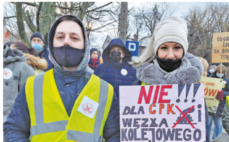
Czy brak komisarza ma coś wspólnego z protestami mieszkańców przeciwko węzłowi kolejowemu dla CPK?