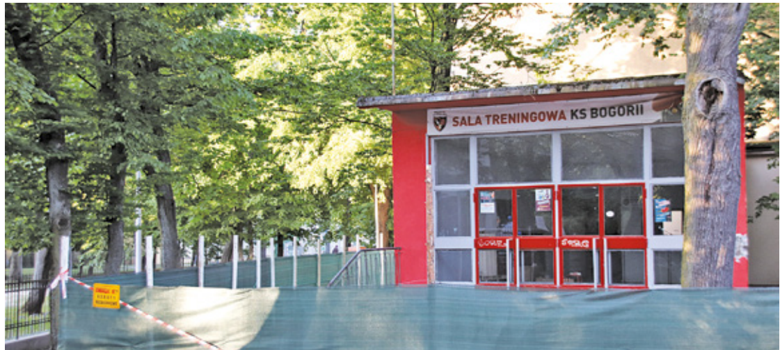
Budynek byłego kina „Wolność”