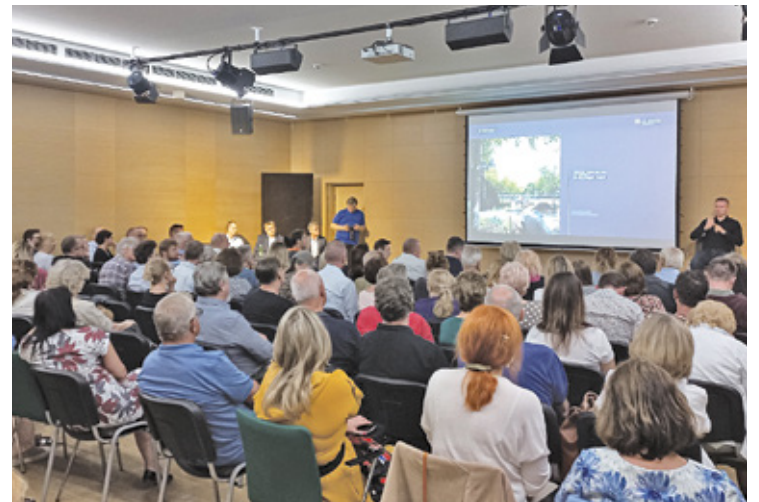
Spotkanie mieszkańców z reprezentantami firmy Hillwood

– Nie jest pan naszym sąsiadem. Nie mieszka tu pan i nie uważamy pana, za jednego z nas. Nie chcemy tu pańskiej firmy. Skoro nie zajmuje się pan budową jednorodzinną, proszę sprzedać tę działkę – powiedziała otwarcie