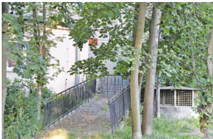
Wyjście z kina

Hali Widowiskowo-Sportowej przy ul. Sportowej. Kino „Wolność” przetrwało w nazwie niewielkiego kina studyjnego, które mieści się w Wilii Radogoszcz, ale to już zupełnie inna technika. Tak jak w tytule filmu „Ucieczka z kina Wolność” była to udana ucieczka w