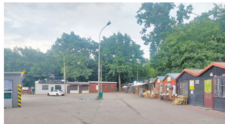
Wydaje się, że kością niezgody jest dach nad targowiskiem, który jest zaplanowany w wersji modernizacji forsowanej przez burmistrza

Przedmiotem przetargu miał być teren z przeznaczeniem na postawienie