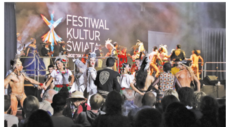
Wielki finał Festiwalu Kultur Świata

Festiwal Kultur Świata to chyba pierwsze o tak dużej skali wydarzenie międzykulturowe w Grodzisku Mazowieckim od czasu Światowych Dni Młodzieży w Polsce w 2016 r., gdy mieszkańcy gościli w swoich domach pielgrzymów m.in. z Hondurasu oraz z Indii. Jedno jest pewne – festiwal dobrze wpisuje się w krajobraz Grodziska Mazowieckiego, jako miasta wielokulturowego. Nawiązuje również do tradycji muzykowania folkowego w tym miejscu.