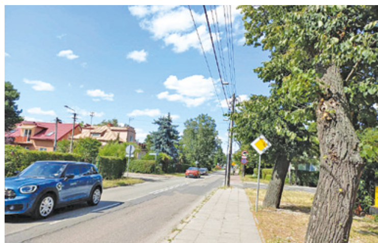
Drzewa przy al. Piłsudskiego