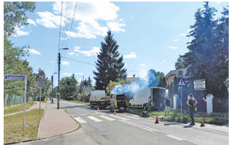
Prace nad naprawą nawierzchni

– Spotkaliśmy się ponownie z projektantem planów. Wzięliśmy pod uwagę zdanie mieszkańców oraz ich obawy o środowisko. Mogę obecnie zapewnić, że żadne większe drzewo nie zostanie