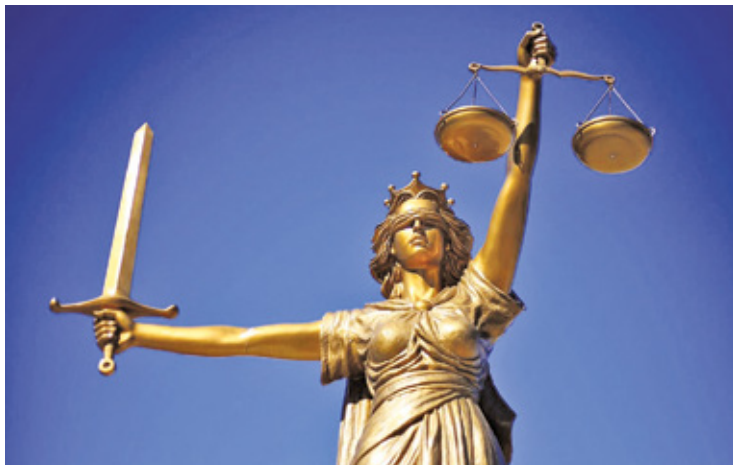
Oskarżenie prokuratury wpłynęło do sądu

Obecnie oficjalnie głos w sprawie zabrała prokuratura. Warto przypomnieć, że wypadkiem nie zajmuje się biuro prokuratury rejonowej, lecz okręgowej.