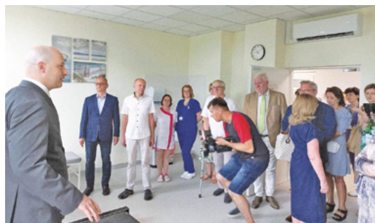
Nowe centrum diagnostyki kardiologicznej

Ponadto w centrum jest wygodna poczekalnia, łazienka przystosowana dla osób z niepełnosprawnościami i pokój socjalny. Wszystkie pomieszczenia są klimatyzowane, co jest bardzo ważne dla pacjentów. Wielu z nich to osoby starsze. Czekanie w dusznym i gorącym pomieszczeniu bar-