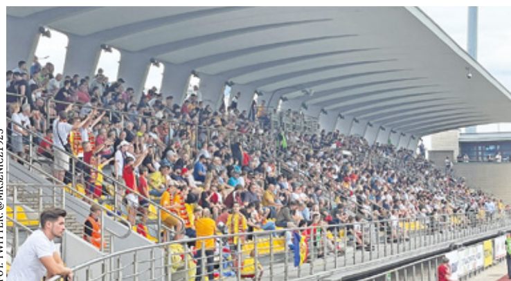
Mnóstwo kibiców na pierwszym meczu Znicza Pruszków w Fortuna 1. Lidze

Już w pierwszych 5 minutach gospodarze mieli znakomitą okazję do zdobycia bramki, jednak po strzale Pawła Moskwika piłka minimalnie przeleciała obok słupka gości. W 39. minucie uderzeniem nożycami popisał się