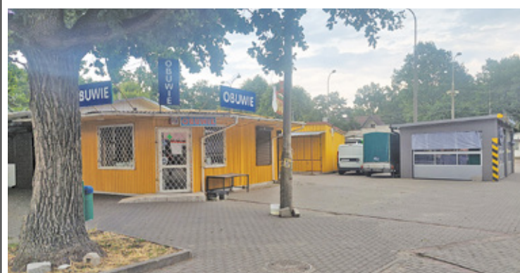
Dyskusje między miastem i kupcami o charakter modernizacji targowiska, toczą się od prawie czterech lat bez jakichkolwiek efektów

pawilonów, czyli niewielkich, parterowych, wolnostojących obiektów niepołączonych trwale z gruntem. W pawilonach prowadzona miała być działalność usługowa, handlowa. Przetarg zakładał, że kupcy będą mogli dzierżawić teren, na którym postawią pawilony przez okres trzech lat. Projekty pawilonów miało zatwierdzać miasto.