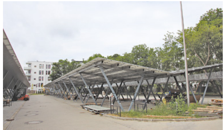
Panele fotowoltaiczne na wiatkach

W ramach inwestycji powstało 51 metalowych wiat parkingowych, na których zamontowano panele fotowoltaiczne. Całkowita powierzchnia zadania wynosi prawie 2 000 m kw. Wiaty spełnią dwie funkcje: konstrukcji wsporczych do montażu modułów oraz ochrony parkujących