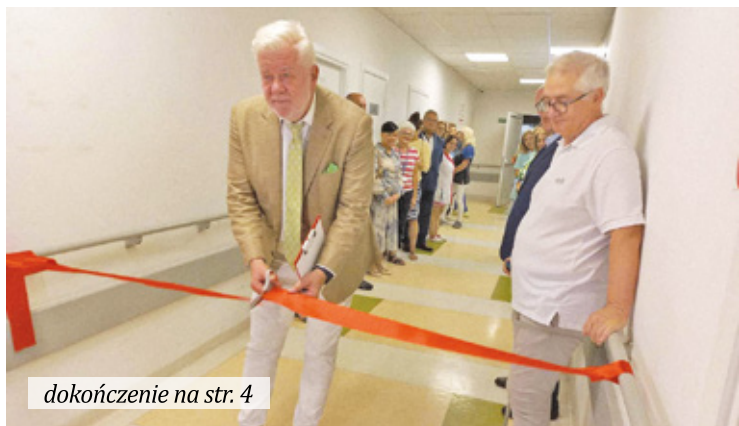
dokończenie na str. 4