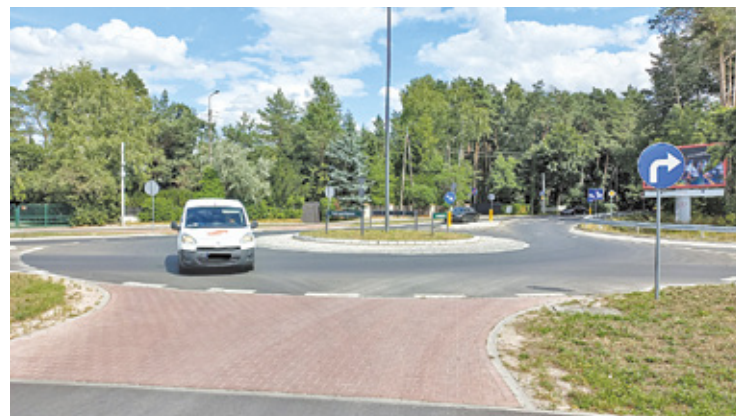
Odnoga ulicy Pruszkowskiej