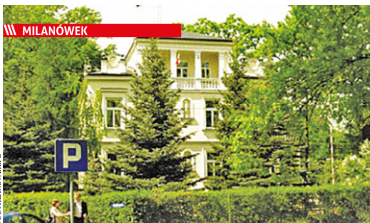
MILANÓWEK Prokuratura Rejonowa w Grodzisku Mazowieckim prowadzi postępowanie przygotowawcze w sprawie niedopełnienia obowiązków i uporczywego naruszenia praw pracowniczych w Zakładzie Gospodarki Komunalnej i Mieszkaniowej w Milanówku