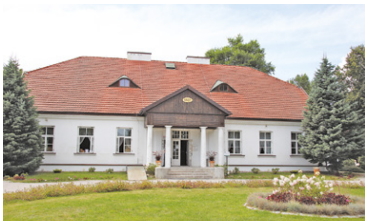
Dom Kultury w Żabiej Woli