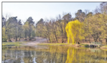
||| Podkowa Leśna - Będzie referendum? s. 5