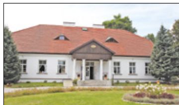
||| Powiat Grodziski - Gminy z dotacjami s. 2