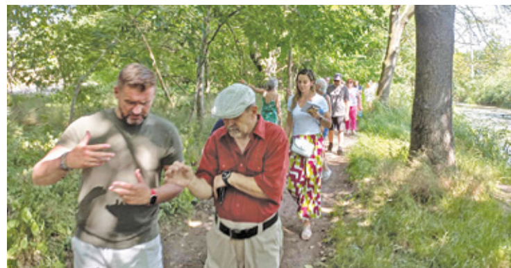
Spotkanie prezesa z przeciwnikami inwestycji nad Utratą

Jednocześnie MWKZ zaznacza, że chociaż forma terenowa obiektu identyfikowanego w prasie oraz mediach społecznościowych jako kurhan, może wskazywać na taką funkcję, jednakże nie zostało to dotąd potwierdzone i wymagałoby weryfikacji poprzez zastosowanie wykopaliskowej metody badawczej – dodaje konserwator.