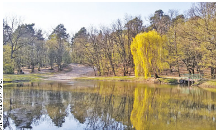
Staw w Podkowie Leśnej. Rok 2017

– Szukajmy tego, co nas łączy. Dendropolis i aktywiści skupieni wokół tej grupy podkreślają, że działają W INTERESIE MIESZKAŃCÓW, także takiego sformułowania użyto w odpowiedzi na moją propozycję ugody. Ponieważ jest