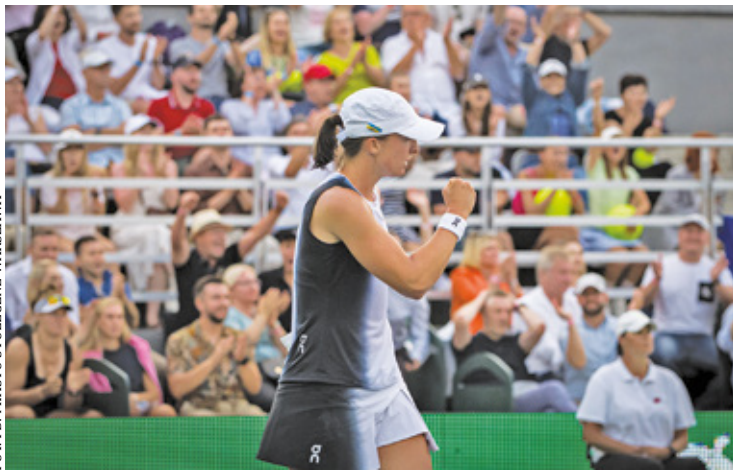
Iga Świątek wygrała BNP Paribas Warsaw Open