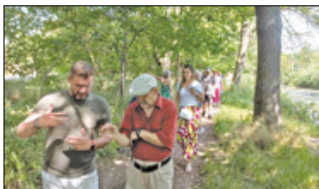
||| Pruszków - Archeologia czy oszustwo? s. 4