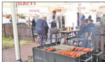
||| Pruszków - Pożegnanie z Karczemką s. 5