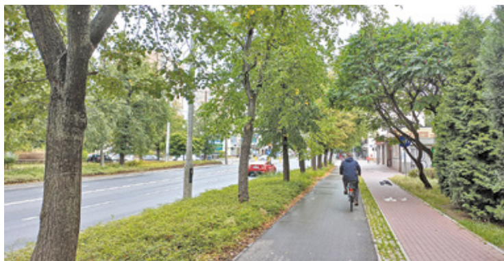
Aleja Wojska Polskiego

Niedługo w Pruszkowie powinien zacząć się remont alei Wojska Polskiego. Między innymi przebudowane zostanie skrzyżowanie z ulicami Emancypantek i Przyszłości. Powstanie tu rondo turbinowe dla bezpieczeństwa ruchu drogowego. Odmieni się również skrzyżowanie alei Wojska Polskiego i Niepodległości. I właśnie te prace wywołują najwięcej emocji. To z powodu drzew, które tu rosną. Podczas remontu mają one zostać wycięte. Wielu miesz-