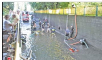
||| Brwinów - Absurdy drogowe s. 6