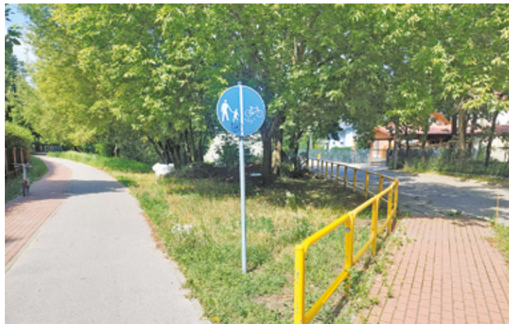
W ramach rewitalizacji Grudowskiej w miejscu dawnej stacji WKD powstanie park

Co zostanie posadzone? Jak nas poinformowano w urzędzie miejskim na Grudowskiej ma się pojawić roślinność kwietnej łąki. W ramach dofinansowa-