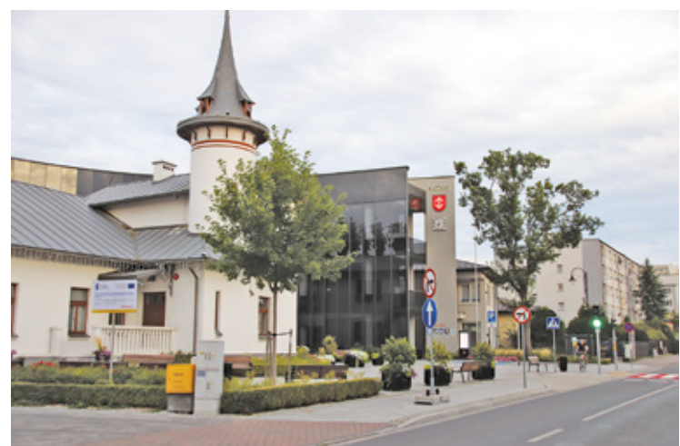
Ratusz w Grodzisku Mazowieckim

Jak podkreślają autorzy raportu przygotowanego przez Instytut Rozwoju Miast i Regionów na temat budżetów obywatelskich. Mieszkańcy zawsze stawiają na zieleni. To właśnie projekty dotyczące zieleni i rekreacji stanowią średnio ok. 1/4 wybieranych w głosowaniu zadań, tym samym pokazując, czego