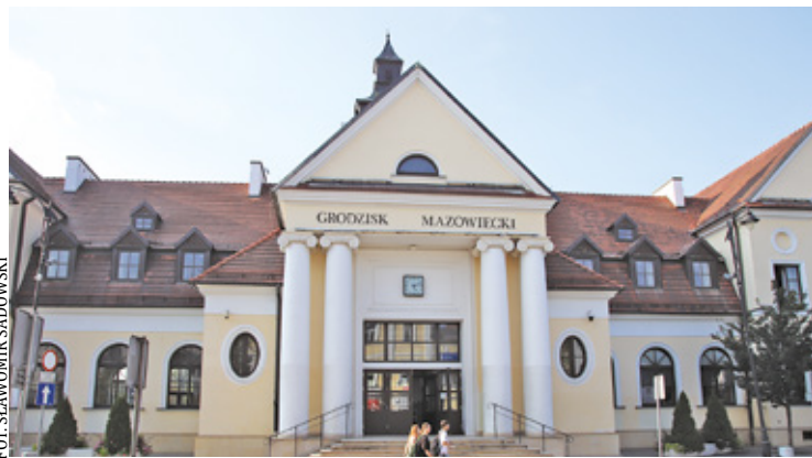
Dworzec w Grodzisku Maz.