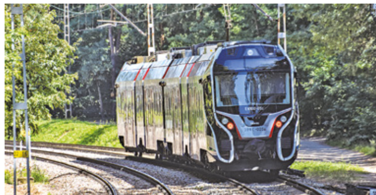
Czy komunikacja z Warszawą od początku roku szkolnego będzie utrudniona?

Niedawno informowaliśmy Państwa o planowanym od 3 września zamknięciu odcinka linii WKD między stacjami Warszawa Reduta Ordona - Warszawa Śródmieście.