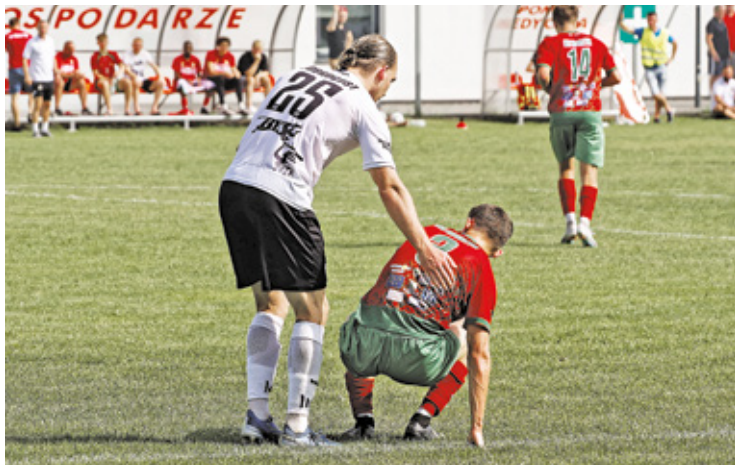
Raszyn walczył do samego końca, ale 3 punkty pojechały do Warszawy