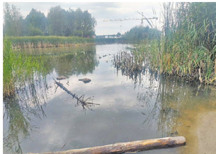
Nad brzegiem stawu ma powstać m.in. wieża widokowa. Dziś nad przyszłym parkiem widać dźwig, który buduje szkołę

Nowy park, który ma powstać na tyłach szkoły, będzie także miejscem prowadzenia lekcji poświęconych ekologii. Na tym terenie znajdują się obecnie ostoje wielu gatunków ptaków, płazów i owadów. Projekt parku został więc tak opracowany, by nie naruszyć przyrodniczego charakteru terenu, umożliwiając mieszkańcom korzystanie z niego. Nad brzegiem stawu ma więc powstać wieża widokowa. Na stawie zbudowane będą pływające pomosty. Ochronie przyrody służyć ma także drewniana ścieżka wzdłuż linii brzegowej. Do parku prowadzi z Grodziska Mazowieckiego ścieżka ro-