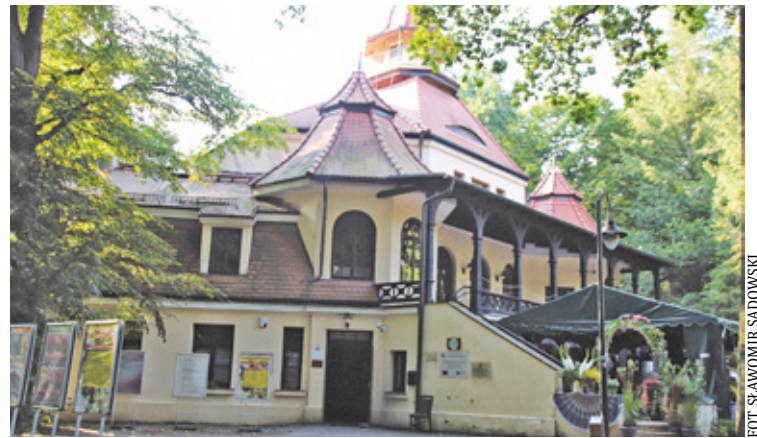
Pałac Kasyno w Podkowie Leśnej

Żeby nie było, że tylko walory historyczne podwarszawskich miast znajdują uznanie w oczach filmowców, to należy wspomnieć o komediach „O rany, nic się nie stało” i „Juliusz”, które powstawały w Milanówku, a „Rób swoje, ryzyko jest twoje”, „zagrała” Podkowska Leśna.