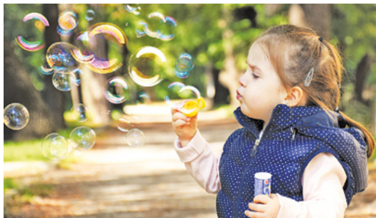
Dziecko bawi się i uczy spontanicznie, jeśli stworzy się mu odpowiednie warunki

Do przedszkoli integracyjnych przyjmowane są dzieci z porażeniem mózgowym, czy też upośledzone umysłowo w stopniu lekkim. Kontakty z rówieśnikami, którzy nie są dotknięci niepełnosprawnościami, stymulują ich rozwój, mobilizują do poprawnej wymowy, socjalizują itp. Za-