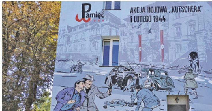
Mural zaprojektował miejscowy artysta Jarek Babikowski