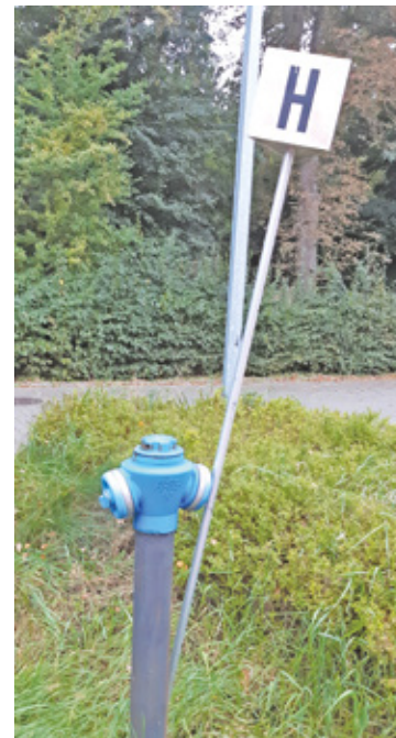
Czy woda do badania została pobrana niewłaściwie?

– Wszyscy dobrze wiemy, że woda nie jest dobra, zawiera dużo wapnia. Sprzęty domowe szybko się psują. Co spółka zamierza zrobić? – pytał jeden z mieszkańców. – Surowa woda jest żałazowana, są też przekroczenia zawartości manganu. Stacja uzdatniania wody doprowadza ją do stanu zgodnego z normami, ale by była lepsza, należałoby zainwestować w urządzenia, a to przełożyłoby się ostatecznie na ceny wody – usłyszeli mieszkańcy. Jakie jest rozwiązanie? Brwinowski samorząd policzył, że nie opłaca się wydawać 12-15 milionów złotych na remont stacji