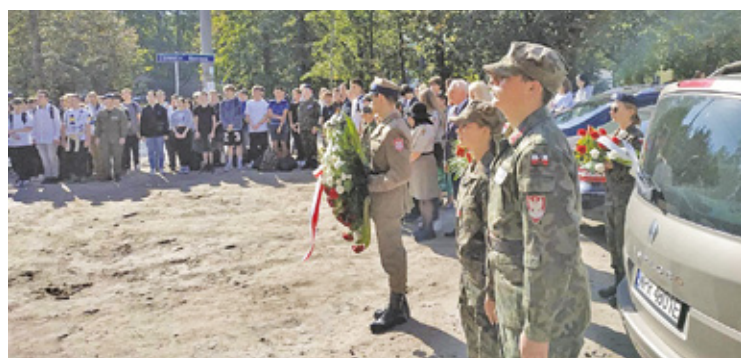
W uroczystości uczestniczyli również harcerze

Mural powstał na przedwojennej kamienicy na skrzyżowaniu ulic Dworcowej i Gęsińskiego