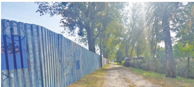
Za tym płotem jest rzeka Mrowna, a przed osiedle Łąki

Za płotem znajdują się zakłady Gedeon Richter Polska, które twierdzą, że posiadają wszelkie niezbędne zezwolenia na utrzymanie płotu. Ogrodzenie, zlokalizowane od strony ulicy, ma za zadanie chronić teren zakładu przed dostępem niepowołanych osób. Dodat-