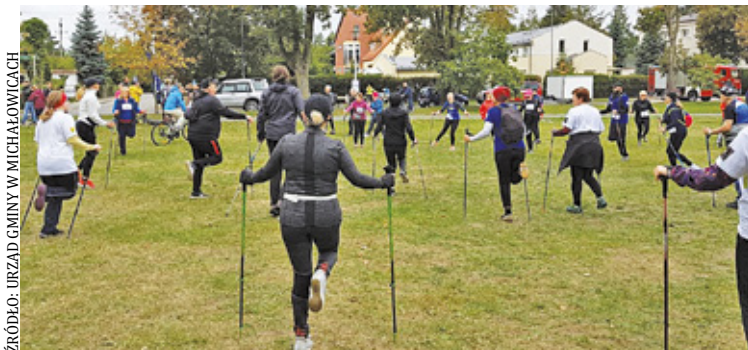
Wydarzenia sportowe i kulturalne w budżecie obywatelskim Michałowic

Do 11 października mieszkańcy gminy Michałowice mogą wziąć udział w głosowaniu na projekty zgłoszone do budżetu obywatelskiego na przyszły rok 2024. Zgłoszono 21 propozycji na kwotę ponad 600 tysięcy złotych.