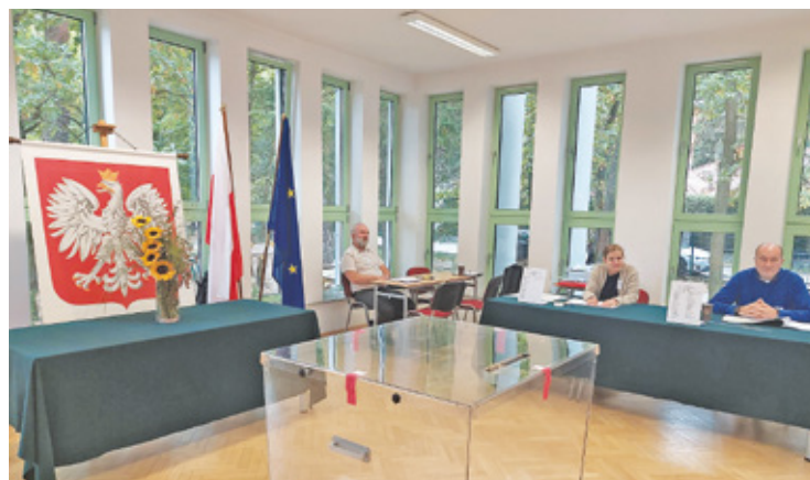
Mieszkańcy Podkowie Leśnej głosowali w dwóch lokalach obwodowych komisjach ds. referendum a min w szkole podstawowej przy ul. Jana Pawła II