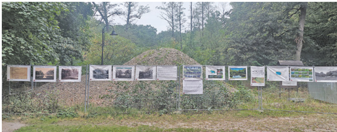
Na „tak” byli mieszkańcy, którzy chcą, by park był miejscem, mającym przede wszystkim walory estetyczne i rekreacyjne

Sądząc po wynikach referendum, ta wizja przemówiła do mieszkańców – zmęczonych ogrodzonym miejscem budowy, które zajęło miejsce stawu w Parku Miejskim. „Za” byli ci, którzy chcą, by park był miejscem, gdzie moż-