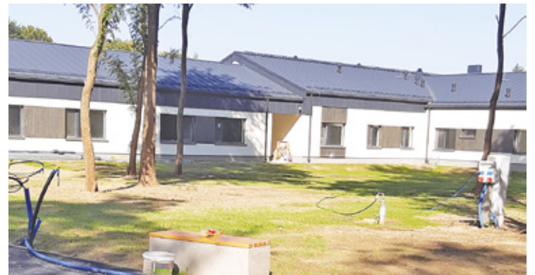
Trwają ostatnie prace

Budowa Centrum Opiekuńczo-Mieszkalnego, pierwszej w powiecie pruszkowskim tego typu placówki, dobiega końca. Ośrodek powstaje przy ulicy Pszczelińskiej w Brwinowie. Będzie przeznaczony dla 30 dorosłych osób ze znacznym lub umiarkowanym stopniem niepełnosprawności.