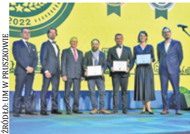
Zdobywcy tytułu Mobilnego Miasta

Pruszków zajął pierwsze miejsce w plebiscycie „Mobilne Miasto”, zdobywając tytuł najbardziej innowacyjnej miejscowości w zakresie mobilności współdzielonej w kategorii miast liczących od 30 do 100 tysięcy mieszkańców.