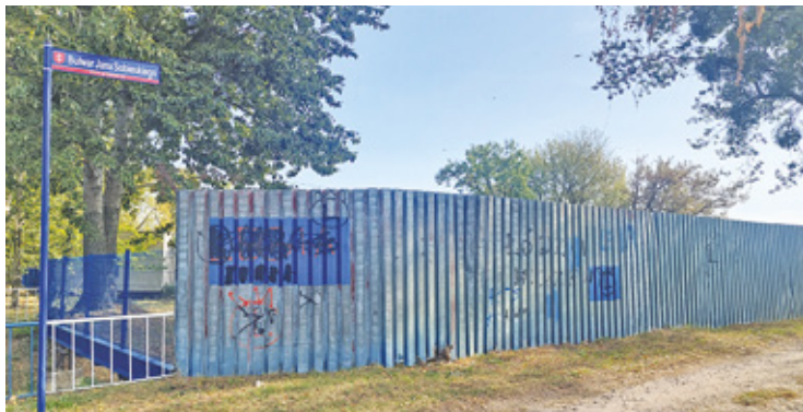
Mieszkańcy chcą, by Bulwar Sobieskiego był miejscem spacerów i odpoczynku

Za czasów PRL, trzymetrowy płot z blachy służył nie tylko jako ochrona przed bezpośrednim sąsiedztwem zakładu. Starsi mieszkańcy pamiętają, że