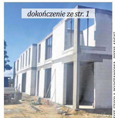
dokończenie ze str. 1 Dom dla 12 dorosłych osób z autyzmem powstaje w Parzniewie

mimo że to szkoła podstawowa, są w niej podopieczni od 7 do 20 roku życia, ze spektrum autyzmu. Od września z placówki korzysta 36 uczniów, ale potrzeby są znacznie większe. W tym roku zgłosiło się do „Przyłądka” ponad 50 rodzin, tylko troje podopiecznych zostało zakwalifikowanych. Wśród 40-osobowego personelu są terapeuci integracji sensorycznej, pedagogzy specjaliści i logopedzi. Rodzice autystycznych dzieci szukają dla nich profesjonalnego wsparcia, które będzie dostosowane do specjalnych potrzeb i możliwości rozwojowych. Poza placówką w Parzniewie