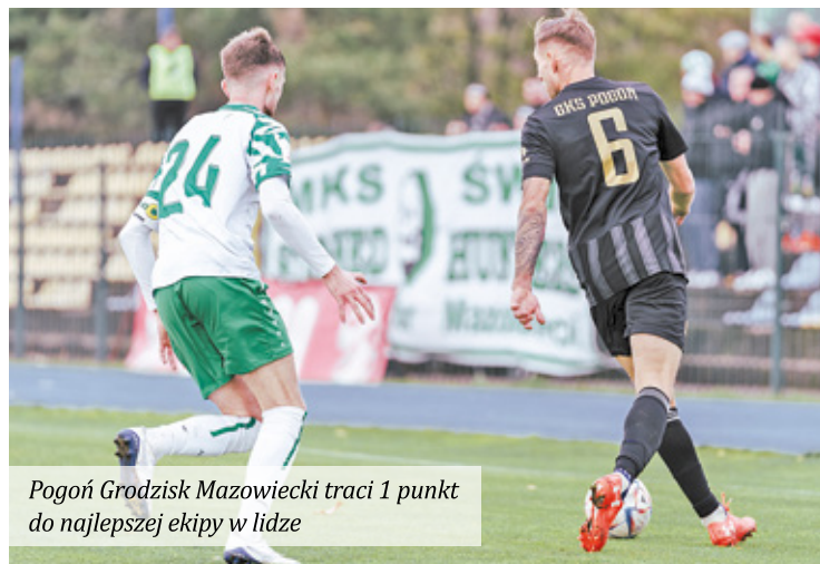
Pogoń Grodzisk Mazowiecki traci 1 punkt do najlepszej ekipy w lidze