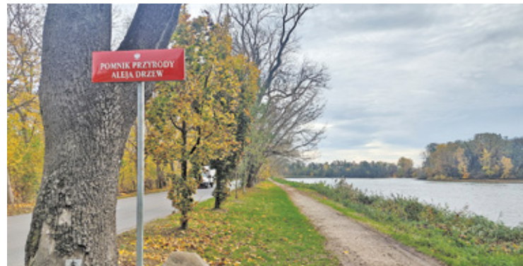
Tablice mówiące o chronionym charakterze zabytkowej Alei Hrabskiej zostały już zamontowane

Aleja na grobli stawów Falenckich ma już prawie 200 lat. Dwa lata temu zbadano stan tworzących ją jesionów