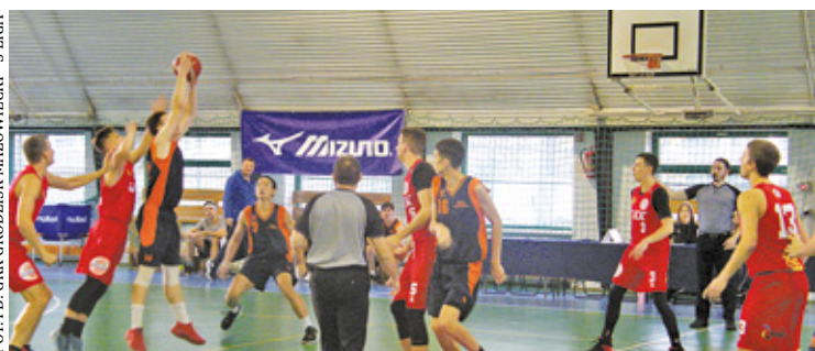
FOT. FB: GKK GRODZISK MAZOWIECKI - 3 LIGA

W sobotę 4 listopada Grodziski Klub Koszykarski ponownie zmierzył się z Ochotą, ale tym razem było to spotkanie domowe. W pierwszej kwarcie kibice zobaczyli dominację gospodarzy, którzy wygrywali 19:1. Przez następne dwie części goście się nieco obudzili, jednakże i tak dalej na prowadzeniu byli zawodnicy GKK