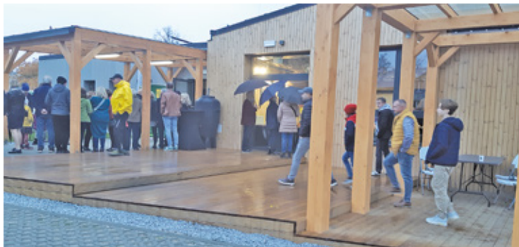
W nowocześnie zaprojektowanym budynku znajduje się duża sala, kuchnia i zaplecze sanitarne, na zewnątrz przestronny taras

Mieszkańcy Pęcic mają swoje miejsce do organizacji spotkań, działań społecznych i integracji lokalnej społeczności. Nowoczesny budynek świetlicy powstał w miejscu dawnej siedziby, przy ulicy Zaułek 7.