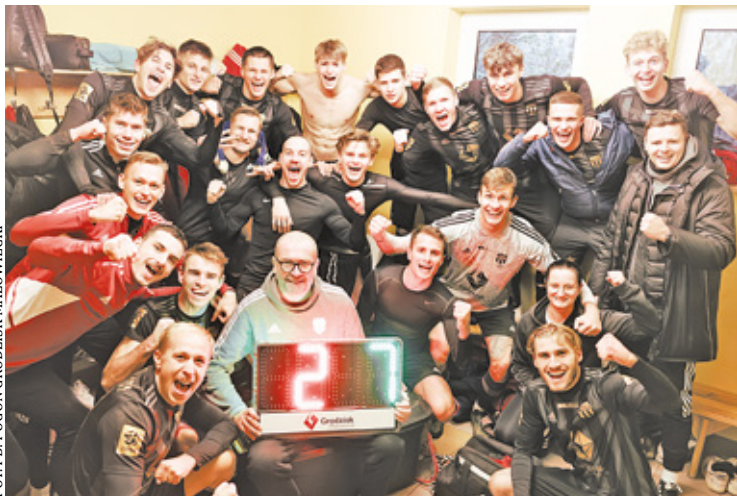
Dzięki wysokim wygrany Pogoń Grodzisk Mazowiecki zajmuje 1. miejsce w III lidze

Tydzień po pogromie Piłicy zawodnicy w czerwono-białych koszulkach zanotowali kolejny fantastyczny wy-