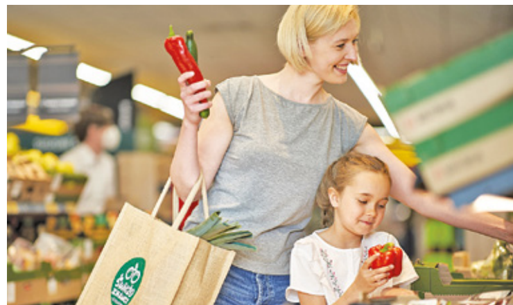
Pierwsi klienci będą mogli zrobić zakupy w nowej placówce już pod koniec tego roku

Sklep zostanie otwarty obok hipermarketu Kaufland, przy sklepie budowlanym Patio. Pierwsi klienci będą mogli zrobić zakupy w nowej placówce już pod koniec tego roku. Lokal sieci Biedronka w Piastowie będzie miał ponad 700 metrów kwadratowych powierzchni i ma być jednym z najbardziej nowoczesnych w okolicy. – W sklepie zastosowano wiele ekologicznych rozwiązań, m.in. energooszczędne urządzenia chłodnicze, działające na gaz CO2 czy oświetlenie LED. W środku nowej placówki pojawią się udogodnienia, które poprawią jakość zakupów dla wszystkich kupujących. Będą to między innymi: lepiej wyeksponowane strefy promocji i bardziej przejrzyste ustawienia wysp na owoce i warzywa. Powstanie także lada tradycyjna, w której klienci będą mogli zaopatrzyć się w świeże wyroby garmażeryjne. Dodatkowo przy stoisku z pieczywem stanie samoobsługowa krawalnia. Ponadto do dyspozycji klientów zostaną oddane