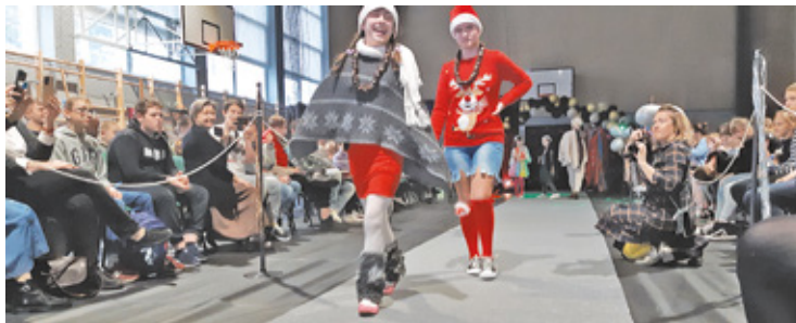
Światła, muzyka, wybieg – wszyscy znakomicie się bawili

modelkami, które zasiądą na widowni. Moglibyście pokazać, jak można kochać modę – pokazując modę – proponował projektant. Na pokazie nie było konkretnego stylu, ale dzieciaki znakomicie sprawdziły się w roli modelek