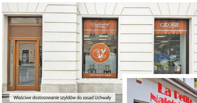
Właściwe dostosowanie szyldów do zasad Uchwały

Przed nami kolejny etap wdrażania uchwały krajobrazowej – dostosowanie witryn, szyldów na budynkach i reklam wolnostojących.