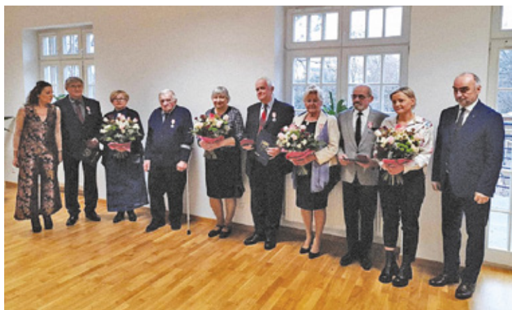
Uroczystość odbyła się w nowo wyremontowanej sali ślubów

P ół wieku razem. To marzenie wielu par. Przeżyć większość swojego życia wspólnie, wspierając się i dzieląc szczęśliwe oraz trudne chwile. Jednak w obecnych czasach wydaje się, że taki wyczyn jest naprawdę trudny, a nawet niemożliwy. Dlatego tym bardziej na-