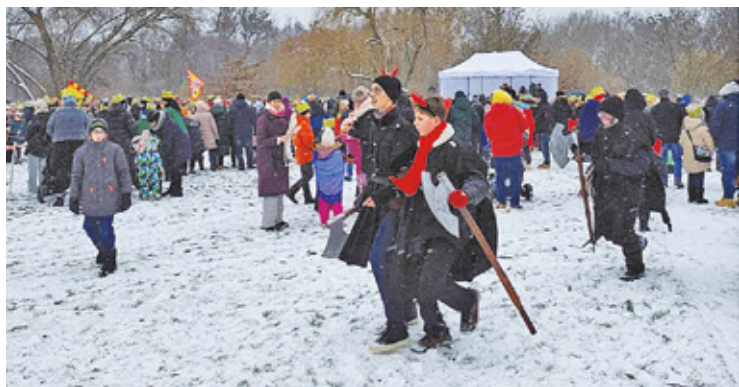
Wielu mieszkańców przyszło w fantastycznych przebraniach

byłych ciepły oraz słodki poczęstunek oraz korony pasujące na każdą głowę. Mimo mroźnej pogody uroczystość cieszyła się dużym zainteresowaniem.