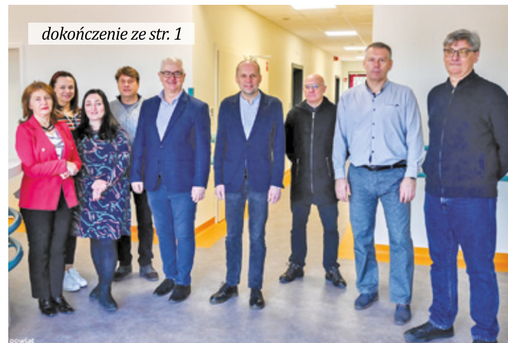
PCOM w Brwinowie to pierwsza taka inicjatywa w powiecie

Tutaj zadecydowały względy praktyczne. Po prostu powiat posiada kilka