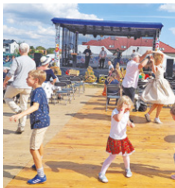
Każdy mieszkaniec ma wpływ na to, aby w jego miejscowości żyło się wygodniej, ciekawiej i bezpieczniej

Zgłosić swój projekt to mieć realną szansę na zrealizowanie własnego pomysłu. Dzięki Budżetowi Obywatelskiemu Mazowsza każdy mieszkaniec może mieć wpływ na zmianę najbliż-