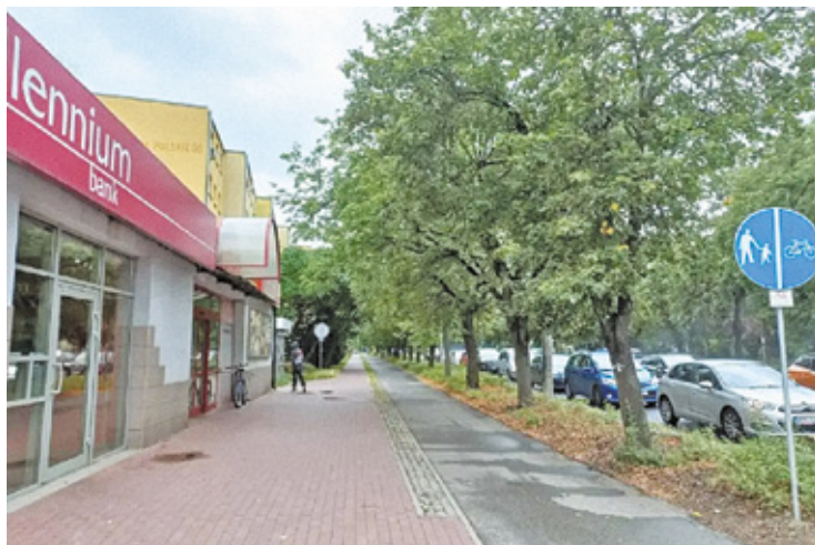
Al. Wojska Polskiego

– Wprowadzenie nowej organizacji ruchu zostało zaplanowane na poniedziałek 8 stycznia. Zakładamy, że w tym samym dniu wykonawca rozpocznie roboty drogowe. Prace zaczną się po wschodniej stronie drogi. Zamknięta zostanie al. Niepodległości od strony wschodniej (jadąc od strony do Grodziska do Warszawy). Na tym etapie budowy na skrzyżowaniach przylegających do wyłączzonego odcinka z ruchu