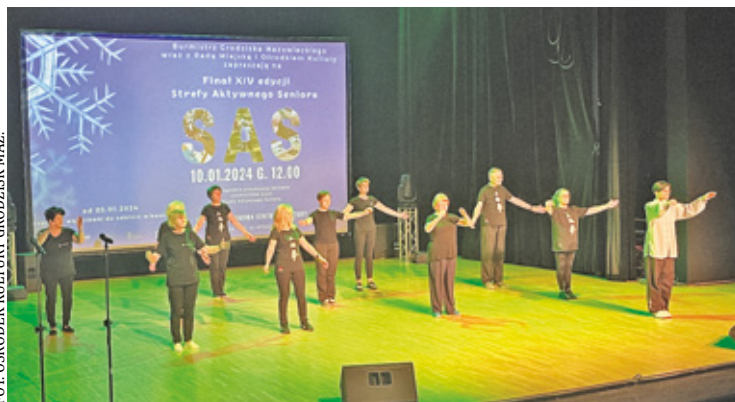
W SAS prężnie działa grupa teatralna i wokalna, utworzono też siedem grup językowych

Najwięcej jest grup gimnastycznych, członkowie strefy ćwiczą też fitness, jogę, pilates, stretching czy tai chi. W SAS prężnie działa grupa teatralna i wokalna, utworzono też siedem grup językowych. Są jeszcze zajęcia szaradziarskie, ceramiczne czy komputerowe. Seniorzy korzystają także z zajęć grafiki komputerowej, malarstwa oraz robótek ręcznych. I to jeszcze nie