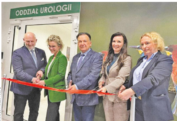
Uroczyste otwarcie oddziału