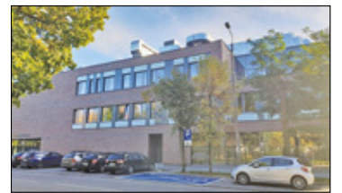
||| Powiat pruszkowski - Jak poradziły sobie szkoły? s. 4