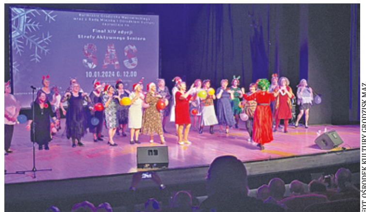
Zajęć jest bardzo wiele, wśród nich: ćwiczenia kondycyjno-ruchowe, warsztaty artystyczne oraz różne formy edukacji

D o Strefy Aktywnego Seniora w grodziskim Ośrodku Kultury uczęszcza 675 mieszkańców. To gminny program dla mieszkańców miasta i gminy Grodzisk Mazowiecki w wieku 60+.