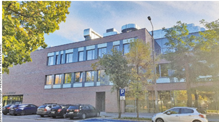
Liceum Ogólnokształcące z Oddz. Dwujęzycznym im. Adama Mickiewicza w Piastowie

Liceum Ogólnokształcące im. Tomasa Zana w Pruszkowie awansowało