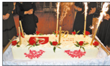
||| Baranów - Jubileusz w cieniu lotniska s. 3