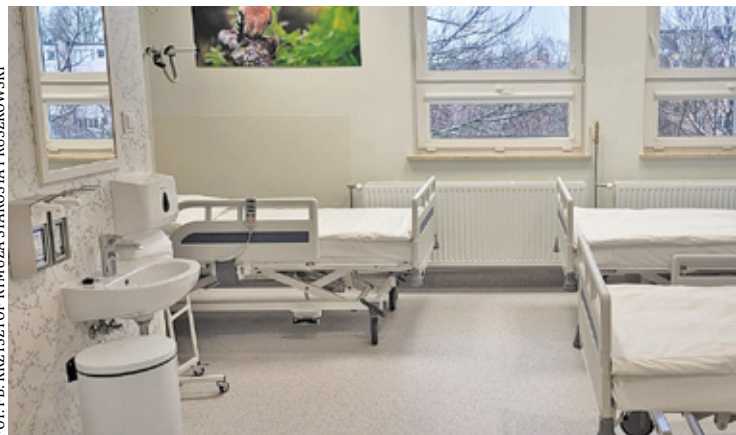
Sala na oddziale

Zakończył się remont, który całkowicie odmienił oddział w Szpitalu Kolejowym. Prace objęły między innymi przebudowę i przystosowanie do potrzeb osób z niepełnosprawnościami wszystkich pomieszczeń, modernizację instalacji elektrycznej, wodno-kanalizacyjnej i gazów medycznych, a także zainstalowanie nowoczesnej klimatyzacji. Aby zaspokoić potrzeby pacjentów, a także pracowników szpitala i zapewnić wszystkim komfort i usługi na najwyższym poziomie, zakupiony został również profesjonalny sprzęt medyczny, taki jak aparat USG, uretereskopy, resekoskopy bipolarny, zestaw do przezskórnej nefroskopii czy narzędzia chirurgiczne do sali zabiegowej. Na oddziale pojawiły się