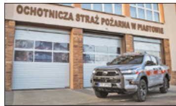
||| Piastów - Bojowy wóz jest już gotowy do akcji! s. 4