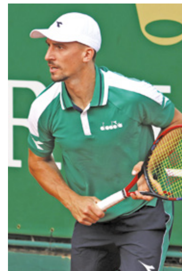
ZIELIŃSKI/MCM23 (29).

Jan Zieliński został pierwszym polskim tenisistą, któremu udało się