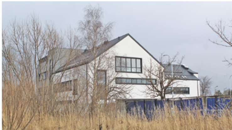
CUM – widok od ulicy Granicznej

B udowane Centrum Usług Medycznych w Nadarzynie wygląda jak mały szpital. Obiekt jest już prawie na ukończeniu. Budynek ma trzy kondygnacje i znajduje się przy ul. Granicznej. Budowa nowoczesnej placówki rozpoczęła się w 2021 roku. Miała zakończyć się ostatecznie we wrześniu 2023 roku.