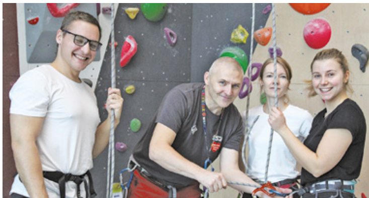
WOŚP na ścianie w hali przy ul. Sportowej