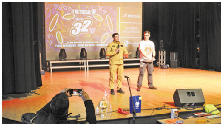
Licytacje w Centrum Kultury