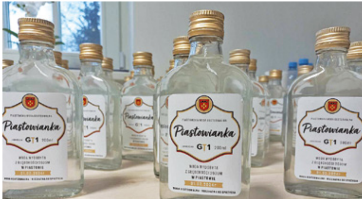
Woda z piastowskiego źródła

Aby wykorzystać źródło do ogrzewania mieszkań i domów w Piastowie, potrzebne będą dalsze działania. Przede wszystkim trzeba wywiercić drugi otwór, którym woda będzie „wracać do obiegu”. To kolejna duża inwestycja,