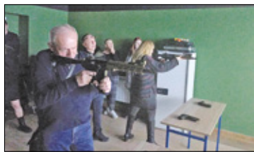
||| Brwinów - Uroczyste otwarcie wirtualnej strzelnicy s. 4