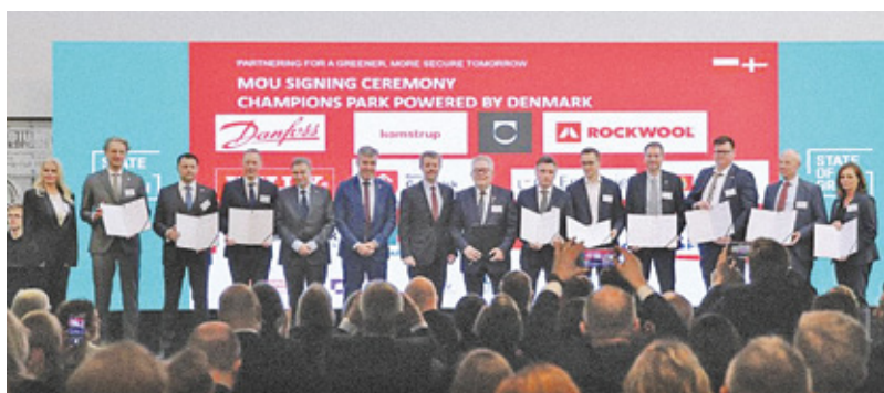
Współpraca GRODZISKA MAZOWIECKIEGO I CHAMPIONS PARK przy zaangażowaniu Ambasady Duńskiej

Na stadionie Legii Warszawa zostało podpisane porozumienie firm z gminą Grodzisk Mazowiecki, która od lat współpracuje z Danią.