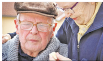
||| Pruszków - Miasto pomaga potrzebującym s. 5