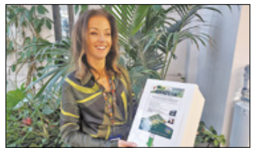
||| Grodzisk Mazowiecki - Zieleń społeczna s. 6