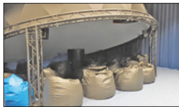
||| Grodzisk Mazowiecki - Grodzisk ma Planetarium s. 3