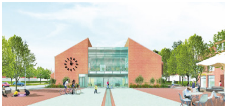
Wizualizacja frontu domu kultury w Książenicach

Nowy obiekt będzie nawiązywał architekturą do istniejącej w są-