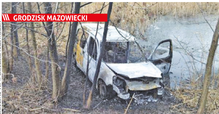
||| GRODZISK MAZOWIECKI