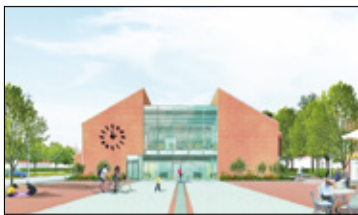
||| Książenice - Mini dom kultury s. 3