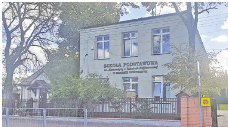
Gmina dołożyła pieniądze, bo inaczej przetarg by się nie udał

Tymczasem ferie zimowe się skończyły, uczniowie wrócili do szkoły i nadal muszą, ubierać się, żeby przejść do sali gimnastycznej lub wrócić z niej do szkoły. Przetarg na drugi etap rozbudowy dotyczy właśnie budowy łącznika między salą gimnastyczną