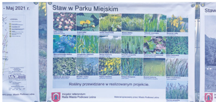
Staw może jeszcze przez długi czas być kością niezgody, a nie ozdobą parku

Tymczasem wyrok Naczelnego Sądu Administracyjnego nie powoduje, że przebudowa stawu może być kontynuowana według projektu forsowanego przez burmistrza od roku