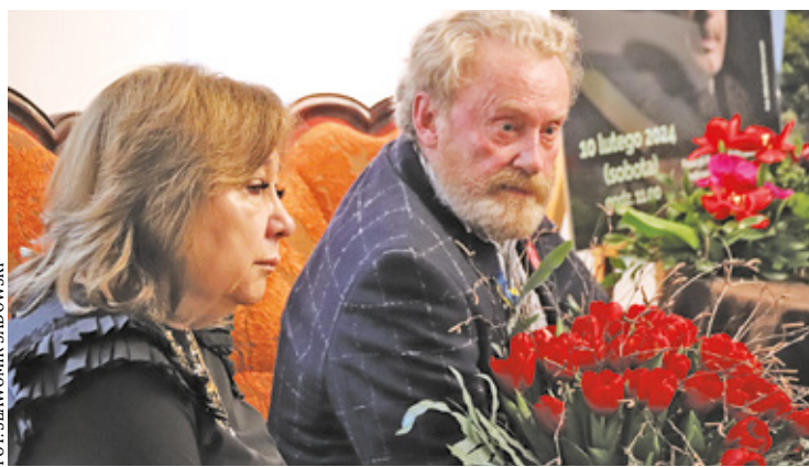
Daniel Olbrychski z żoną