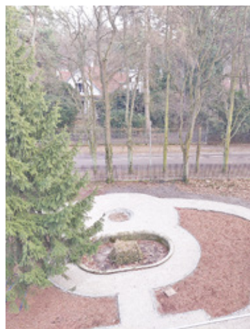
Widok z okna Walerii na park i eliptyczną fontannę, odnalezioną podczas prac porządkowych

Już na pierwszy rzut oka widać ogromne zmiany, jakie zaszły wokół i w samej zbudowanej na początku XX wieku willi. W parku wytyczono już ścieżki, odtworzone według starego projektu. W najbliższym czasie zostanie odtworzona także drewniana altana, w której lubiła przebywać właścicielka willi. Prace rewitalizacyjne przy elewacji są już prawie zakończone. Tylko taras i schody czekają na swoją kolej. Zdaniem burmistrza Piotra Remiszewskiego za dwa tygodnie front Walerii powinien być pełni zrewi-