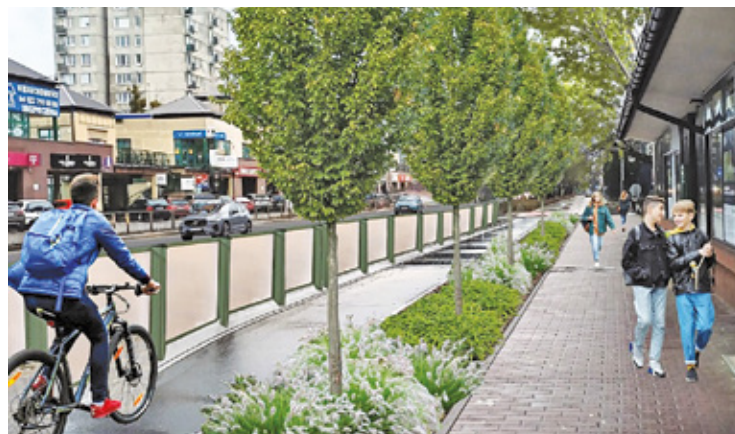
Wizualizacja buforu zieleni

Mazowiecki Zarząd Dróg Wojewódzkich w Warszawie, który odpowiada za ulice, uznał jednak, że względy bezpieczeństwa są ważniejsze i zdecydował o rozpoczęciu remontu. Drzewa zostały wycięte.