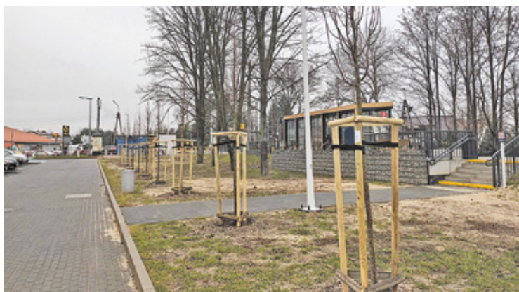
Nowe drzewa od WKD przy stacji Piaskowa i parkingu miejskim

Dodatkowo zamontowane zostaną elementy małej architektury. To będzie taka stołówka dla owadów, czyli budki dla owadów i małych zwierząt. Wszystko po to, aby zachęcić je do mieszkania w tym miejscu. Wykonawca będzie pielęgnował zieleń w okresie 24 miesięcy od daty odbioru zakończonych zada-