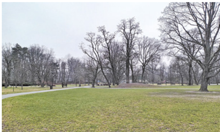
Park Skarbków, gdzie wiosną zakwitną nowe łąki kwietne

Reewitalizacja łąk w Parku Skarbków wpłynie na zwiększenie bioróżnorodności w mieście. Na powierzchni 6700 m kw. pojawi się nowa roślinność. Umowa z firmą, która się tym zajmie została podpisana w urzędzie miejskim na początku lutego. Prace rozpoczynają się łąda moment. Łąka to azyl nie tylko dla ponad 60 gatunków roślin, ale także dla zwierząt. Daje schronienie i pożywienie ptakom, gryzoniom, jeżom, żabom, a także owadom, w tym niezwykle pożytecznym zapyłaczom. Da to roślinom i zwierzętom znakomite warunki do życia, a mieszkańcom możliwość bliższego obcowania z naturą.