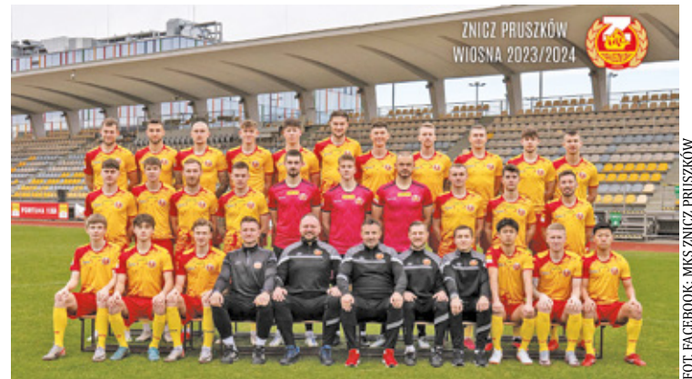
Kadra Znicza Pruszków w rundzie wiosennej sezonu 2023/24