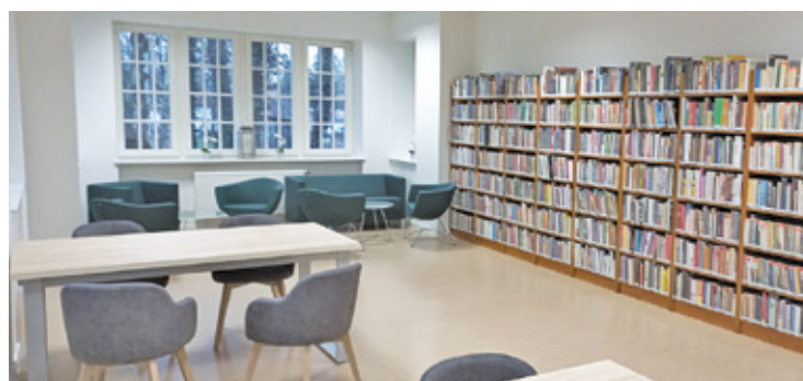
Wprowadzenie zmian jest na razie na etapie konsultacji wśród ekspertów

Ministerstwo Edukacji Narodowej przedstawiło propozycję zmian programu nauczania kilkunastu przedmiotów, między innymi języka polskiego w szkołach. Nowy program miałby być przede wszystkim skromniejszy. Zgodnie z propozycją ministerstwa, dzieci nie będą przerabiać wielu z lektur, które poznały w czasach szkolnych