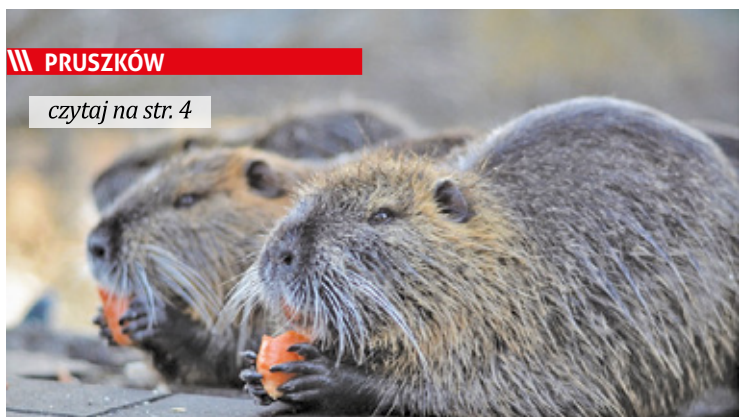
Zwierzęta wciąż pojawiają się w mieście