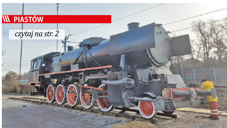
Lokomotywa już stoi, jednak to nie koniec prac przy pomniku

||| Sport - Ostatni krok do mistrzostwa s. 9