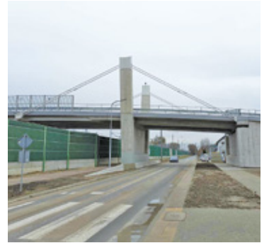
Most jeszcze nie został oddany do użytku

Wiadukt został wybudowany, jednak mieszkańcy obu miast jeszcze