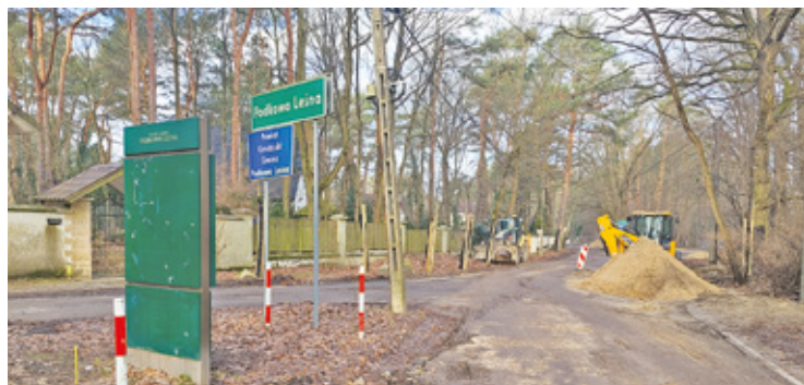
Ul. Zachodnia już na początku kwietnia ma zyskać pierwszą warstwę asfaltu

Kończy się przebudowa ulicy Grabowej (od Modrzewiowej do Bukowej), a na Miejskiej wylano już asfalt. Trwają prace budowlane na Warszawskiej i Zachodniej, a wkrótce remonty rozpoczną się na czterech kolejnych podkowieńskich ulicach.