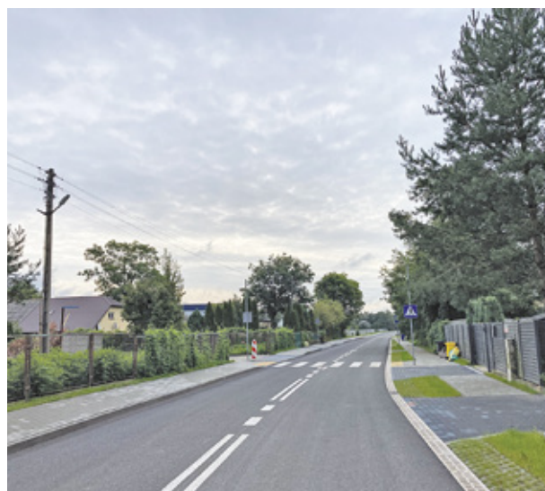
Ukończona droga 1508W w Chlebni (gmina Grodzisk Mazowiecki).

Kolejną dużą inwestycją była rozbudowa drogi 1508W wraz z budową skrzyżowania tej drogi z drogą gminną nr 150210W w Chlebni (gmina Grodzisk Mazowiecki). Długość odcinka, na którym prowadzono prace, wynosi 1,6 km. Zadanie obejmowało także wykonanie skrzyżowania typu rondo, chodników i zjazdów do posesji. Wartość zadania: 9 800 820 zł. Dofinansowanie z Rządowego Funduszu Rozwoju Dróg: 6 853 469 zł. Dofinansowanie z gminy Grodzisk Mazowiecki: 1 000 000 zł.