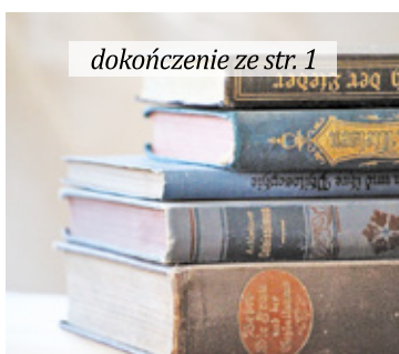
dokończenie ze str. 1

– Czy Państwo przeprowadzali jakieś swoje wewnętrzne konsultacje, że postanowiliście w imieniu całego miasta wyrazić swoje stanowisko związane z oświatą? Rozmawialiście z rodzicami i dziećmi? Oni zawsze mówią, że program jest przeładowany, i to nie tylko z języka polskiego. Dajmy dzieciom możliwość poznania czegoś nowego, co jest akurat aktualne lub będzie w przyszłości aktualne. Nie znamy opinii