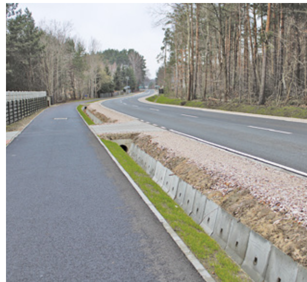
Ukończona droga 1515W w miejscowościach Budy Grzybek (gmina Jaktorów), Czarny Las i Makówka (gmina Grodzisk Mazowiecki).

Najbardziej kosztownym zadaniem była rozbudowa drogi 1515W w miejscowości Budy Grzybek (gmina Jaktorów) oraz Czarny Las i Makówka (gmina Grodzisk Mazowiecki). Prace drogowe prowadzone na odcinku o długości ok. 2,5 km obejmowały wykonanie nowej nawierzchni jezdni wraz z pobocznymi oraz ścieżki pieszo-rowerowej. Wartość zadania: 15 107 426 zł. Dofinansowanie z Rządowego Funduszu Rozwoju Dróg: 12 085 941 zł. Dofinansowanie z Gminy Jaktorów: 826 000 zł.