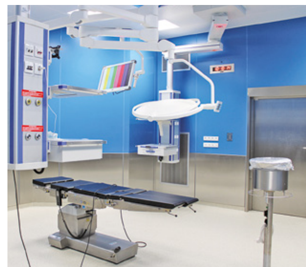
Nowa sala operacyjna w Szpitalu Zachodnim.

Bardzo dużą inwestycją przeprowadzoną w ubiegłym roku była budowa dodatkowej sali operacyjnej w strukturze już istniejącego Bloku Operacyjnego. Wykonanie sali miało na celu zwiększenie dostępności do sal operacyjnych i liczby planowanych zabiegów oraz umożliwienie wydzielienia jednej sali dla pacjentów zakaźnych, wymagających natychmiastowej interwencji zabiegowej. Wartość zadania: 6 967 110 zł. Dofinansowanie z Rządowego Funduszu Polski Ład: Program Inwestycji Strategicznych: 2 380 000 zł. Dofinansowanie z budżetu samorządu Województwa Mazowieckiego: 1 000 000 zł.