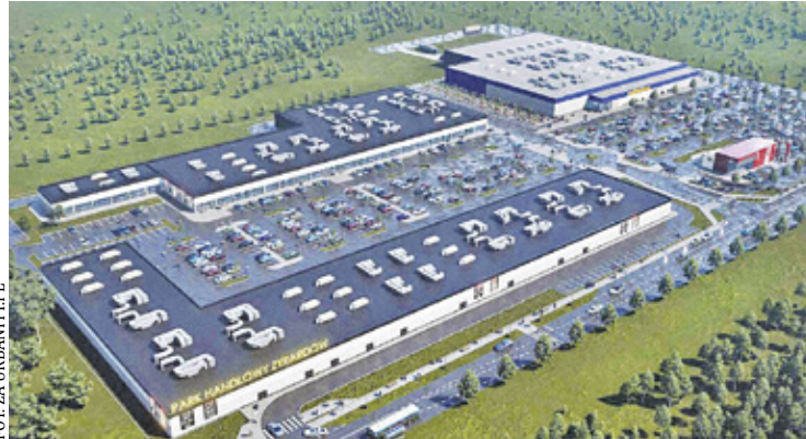
Tak ma wyglądać, powstające już w Żyrardowie centrum handlowe po zakończeniu inwestycji, czyli w 2025 roku

Nowe centrum handlowe Osada Park powstaje w Żyrardowie w rejonie ulic Mickiewicza, Kasprowicza i Mazowieckiej. Na Osadę złożyć się mają pierwszy w tym regionie market budowlany DIY, a także market spożywczy Auchan oraz galeria z ponad 50 sklepami i punktami usługowymi.