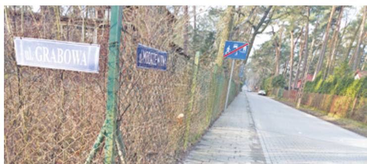
Na remont czekają ulica Grabowa i końcowy odcinek Modrzewiowej