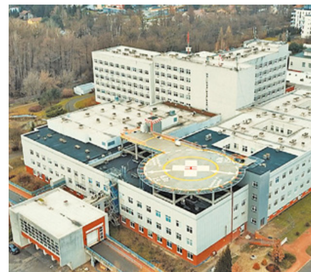
Ładowisko całodobowe w Szpitalu Zachodnim. Ładowisko będzie uruchomione w bieżącym kwartale.

Kolejną ważną inwestycją była budowa całodobowego ładowiska dla potrzeb Szpitalnego Oddziału Ratunkowego . W ramach inwestycji wykonano płytę ładowiska nad dachem budynku Szpitala z niezbędną infrastrukturą, nadbudowę dwóch klatek schodowych, budowę zewnętrznego szybu windowego, częściową przebudowę istniejących budynków Szpitala związanych z realizacją inwestycji. Wartość zadania: 10 416 000 zł. Dofinansowanie z budżetu Samorządu Województwa Mazowieckiego: 3 600 000 zł. Dofinansowanie ze spółki Centralny Port Komunikacyjny: 1 000 000 zł. Dofinansowanie z gminy Grodzisk Mazowiecki: 2 250 000 zł.