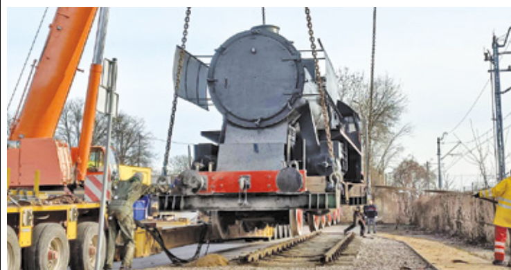
Pomnik już jest atrakcją wśród mieszkańców

Lokomotywa już stoi, jednak to nie koniec prac przy pomniku. Przy przedłużeniu ulicy Lwowskiej stanie zaby-