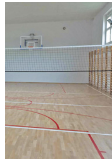
Sala po remoncie

Remont został zrealizowany dzięki współpracy dyrekcji szkoły z władzami starostwa powiatu pruszkowskiego. Pełen koszt remontu to ponad 600 tysięcy złotych. Około połowę tej kwoty pokrył budżet Województwa Mazowie-