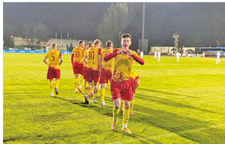
Po pierwszej połowie Znicz prowadził z Wisłą 2:0