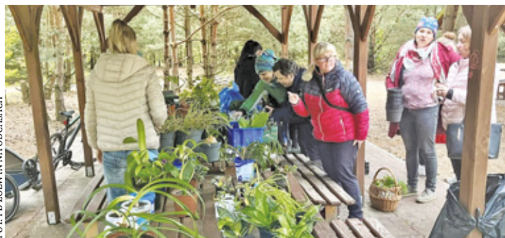
W Żółwinie odbyła się akcja Wiosennej Wymiany Roślin, zorganizowana przez koło gospodyń

Koło Gospodyń Wiejskich Żółwin Na Obcasach to połączenie tradycji i nowoczesności. Nie lepimy pierogów, mówią, robimy inne ważne rzeczy, na przykład Wiosenną Wymianę Roślin czy też kurs samoobrony. Nabór właśnie się rozpoczyna. Kim są gospodynie z Żółwina?