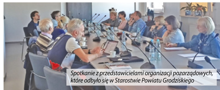
Spotkanie z przedstawicielami organizacji pozarządowych, które odbyło się w Starostwie Powiatu Grodziskiego

Zlecono także organizowanie Powiatowych Finałów Mazowieckich Igrzysk Młodzieży Szkolnej. Zadanie to powierzono Powiatowemu Szkolnemu Związkiemu Sportowemu. Zawody były przeprowadzane przez cały rok w szkołach podstawowych i ponad-