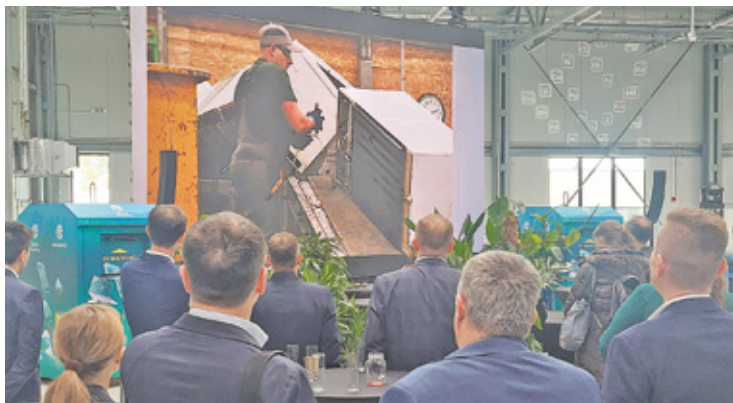
W nowym zakładzie odzyskiwane będą z elektroodpadów metale strategiczne dla gospodarki

Przetwarzanie elektroodpadów tym będzie zajmowała się nowy zakład Terra Recycling, który otwarto w kwietniu w Grodzisku Mazowieckim. Co więcej, z inicjatywy tego zakładu, trwa już w mieście akcja odpowiedzialnego pozbywania się zużytego sprzętu elektrycznego i elektronicznego z domów.