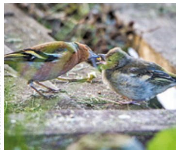
Samiec żyłby karmiący podlota

N a stronie JESTEM NA pTAK przeczytamy, że kiedy na ziemi czy trawie zobaczymy nieopierzone pisklę, które wszystko może zabić – od zimna po atak drapieżnika – pomoc człowieka może uratować mu życie.