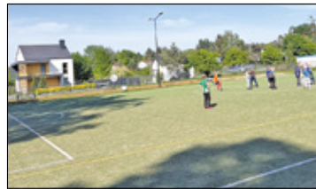
||| Otrębusy - Nowe boiska s. 3