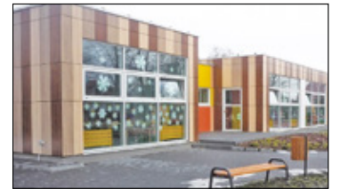
||| Piastów - Przedszkole zostanie zamknięte s. 5