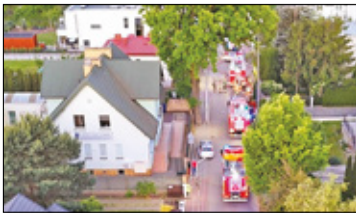
||| Michałowice - Nocny pożar s. 2