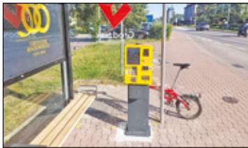
||| Grodzisk Mazowiecki - Bilety online i biletomaty s. 3