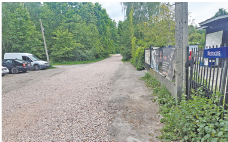
Wiele ulic w Milanówku, jak i ulicę Wiatraczną, wysypano kruszywem, co nie wzbudziło entuzjazmu mieszkańców

Działania podejmowane przez samorządy w sprawie dróg idą zazwyczaj