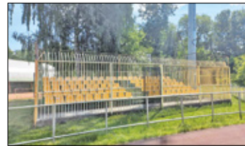
||| Pruszków - Kiedy zniknie klatka? s. 4