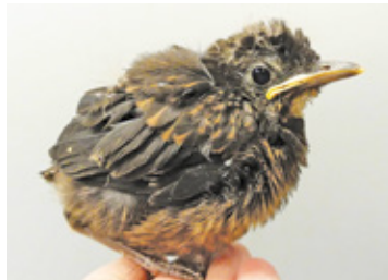
Ptasi ambasador kampanii: ZOOstaw, NIE porywaj!

Ośrodek Rehabilitacji Ptaków Chronionych „Ptasi Azyl” w 2023 roku przyjął 7 tys. 463 pacjentów. 3 tys. z nich to pisklęta lub podloty. Aż 70 proc.