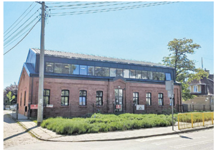
Filia przedszkola przy ul. Popiełuszki

Zamknięcie placówki wiąże się bezpośrednio z procesem oszczędzania w Piastowie. Koszt wynajmu obciąża budżet, miasto płaci miesięcznie 50 zł