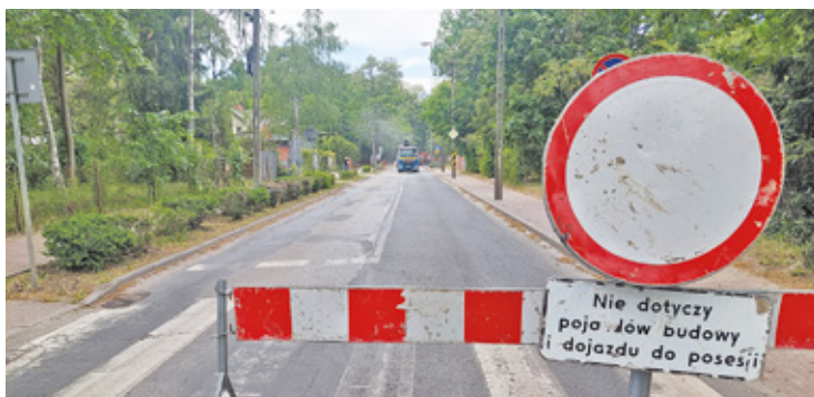
Na Nowowiejskiej prace potrwać dwa miesiące

Milanowianie mieszkający przy ulicy Wojska Polskiego należą do tych szczęśliwców, których droga do domu jest już remontowana. Są zadowoleni, choć oznaczają, to obecnie duże utrudnienia. Żartują jednak także, że remont tej