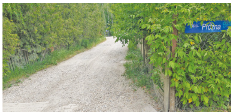
Ulica Próźna to jedna z tych, które dają szansę na offroadowe przeżycia bez wyjeżdżania w teren

Po sesji rady miejskiej, na której nowy burmistrz Artur Niedziński mówił o swoich zamiarach, ukazało się w mediach społecznościowych szereg komentarzy dotyczących dróg miejskich