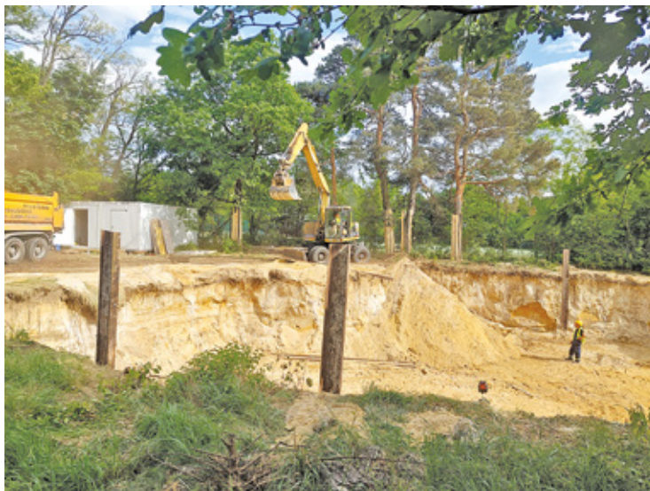
Wykop jest bardzo blisko sąsiedniej posesji i ściany budynku – mówią mieszkańcy

Dlaczego mieszkańcy domów przy Królewskiej nie chcą wielorodzinnego domu w sąsiedztwie? – My tu nie będziemy mieli spokoju. To zmieni warunki naszego życia. Nie będzie tej ciszy. 11 mieszkań to pewnie 20 samochodów w podziemnym garażu jeżdżących