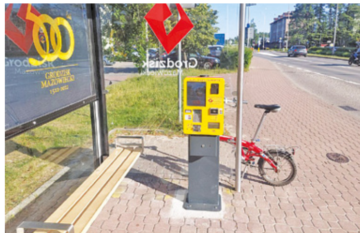
Nowy biletomat przy Teligi w Grodzisku Mazowieckim

strefę ważności biletu. Dopiero później (z listy) wskazuje, którą linią planuje najczęściej jeździć. Nie trzeba wpisywać konkretnych przystanków autobusowych. Wskazanie numeru linii przez pasażera wymagane jest przez system