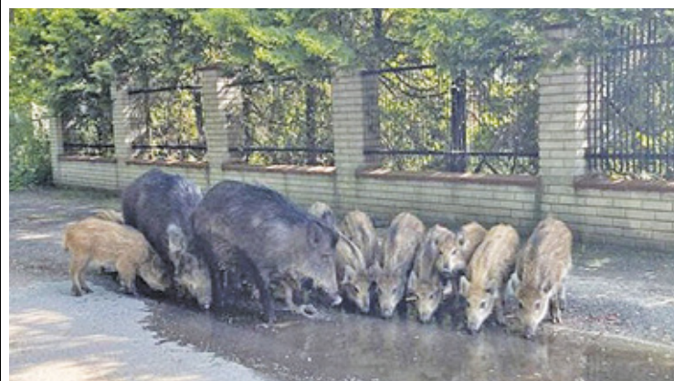
Dziki na ulicy Elizy Orzeszkowej

dorazowo reaguje na zgłoszenia mieszkańców i w razie potrzeby podejmuje działania, wykorzystując środki, jakie są dostępne do odstraszenia zwierząt, czyli używa np. sygnałów świetlnych i dźwiękowych. Strażnicy będą też podejmować próby odstraszenia dzików od wchodzenia na tereny zabudowane za pomocą środków chemicznych (zapachowych). Ze swej strony Straż Miejska w Brwinowie przekazuje mieszkańcom informację o zasadach zachowania się w przypadku spotkania