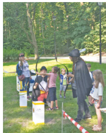
Kto chce zostać łucznikiem?