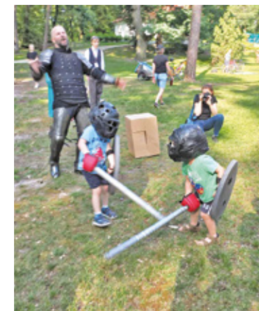
Najmłodsi też brali udział w walkach