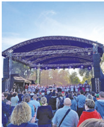
Zabawa z poprzedniego roku

– Uzyskałem informacje z odpowiednich wydziałów miasta o braku zakontraktowania jakichkolwiek artystów na ten termin oraz braku zabezpieczenia funduszy w budżecie miasta. Zaszła także kolizja planowanego wydarzenia z odbywającymi się 9 czerwca wyborami do europarlamentu. Chciałem tutaj zaznaczyć, że kodeks wyborczy zabrania organizowania imprez masowych, zgromadzeń i pochodów w dniu wyborów ze względu na ciszę wyborczą. Trudno byłoby zapanować podczas Dni Pruszkowa nad ewentualnymi agitacjami wyborczymi – powiedział podczas konferen-