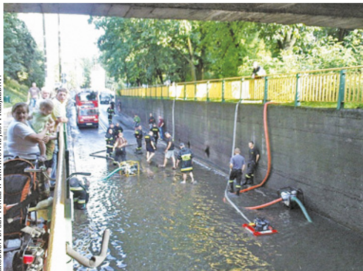
Tunel sprzed lat

Spróbujcie otworzyć do oporu kran przy wannie w domu, a zobaczycie, że pomimo otwartego korka w dniu wanny, wody zaczyna przybywać, aż się wanna przeleje. Z naszym tunelem jest tak samo. Został wybudowany jeszcze w latach stalinowskich, a rura odprowadzająca z niego wodę ma średnicę tylko 20 cm i może odprowadzić ograniczoną ilość wody. W sprawie niedzielnego zalania nie mamy sobie nic do zarzucenia. Ostatnio zamietliśmy jezdnię w tunelu oraz odmuliliśmy studnie i wyczyściliśmy rury kanalizacji deszczowej. W ten sposób zapewniliśmy maksymalnie szybki odpływ wody z tunelu do przepompowni, gdzie w 2011 r. zamontowaliśmy wysokowydajne pompy, które odprowadzają wodę dalej. Nic więcej zrobić nie mogliśmy – zaznaczył burmistrz.