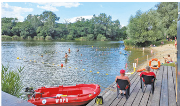
Kąpielisko w Pruszkowie

Park to jedno z ulubionych miejsc spędzania wolnego czasu i relaksu mieszkańców Pruszkowa i sąsiednich miejscowości. Podczas słonecznych dni przyjeżdżają tutaj całe rodziny, aby odpocząć nad wodą. Poza miejscem do kąpeli jest tu również uwielbiany przez najmłodszych plac zabaw oraz tężnia. W parku w wyznaczonych miejscach można odpalić grilla. Goście mogą także skorzystać z oferty foodtrucków oraz budek z lodami. Każdy może znaleźć tutaj coś dla siebie. W sobotę, oprócz