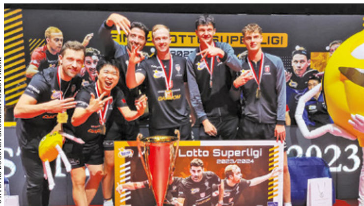
Zawodnicy Bogorii mogli świętować wspaniały sukces w Lotto Superlidze