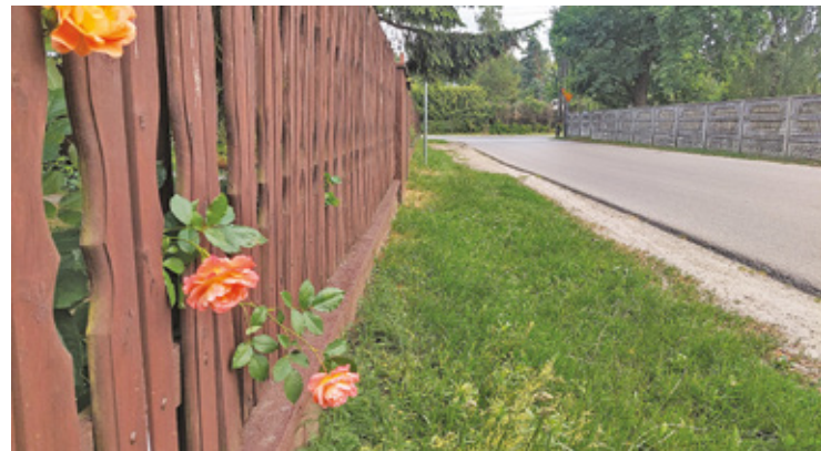
Wydaje się, że trudno będzie przy ulicy Chełmońskiego zbudować chodnik szeroki na 2 metry