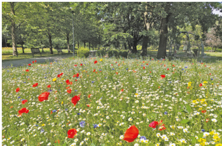
Kosi się je tylko dwa razy w roku. Kiedy kwitną, zachwycają każdego

Zanieczyszczenia im nie przeszkadzają. Odwrotnie: rośliny z łąki kwietnej potrafią oczyścić powietrze. Nie tylko więc dla ich urody Grodzisk Mazowiecki zakłada łąki w parkach. Największą i najpiękniejszą z nich zobaczymy w Parku Skarbków. Łąki dają roślinom i zwierzętom znakomite warunki do życia, a mieszkańcom miasta możliwość obcowania z naturą.