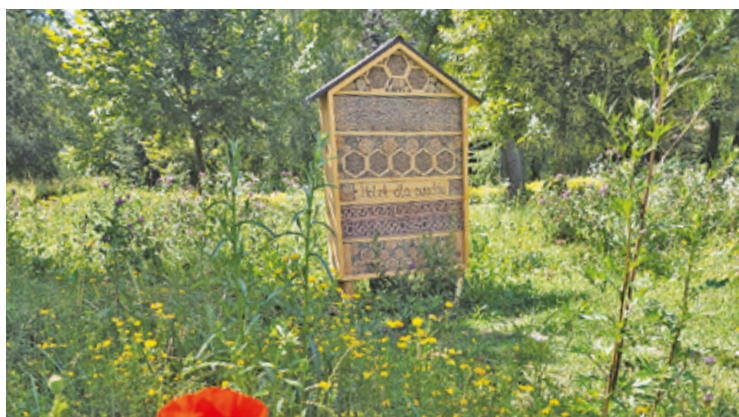
Owady mają, gdzie mieszkać, to dla nich przygotowano te drewniane domki

siedząc na ławce naprzeciw kwitnących kwiatów i ziół, wspomina czasy dzieciństwa, które spędził u babci: – Tam także tak pięknie kwitły łąki! – stwierdza ze wzruszeniem. Dwaj koledzy, uczniowie liceum, przyznają, że nie zauważyli, że łąka kwitnie obok ławki, na której usiedli. Stwierdzają jednak, że wybrali to miejsce, bo jest bardzo malownicze. Okazuje się więc, że łąka w środku miasta to azyl nie tylko dla owadów, ale także dla mieszkańców, zarówno dorosłych, jak i dzieci.