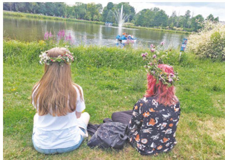
Na Stawach Walczewskiego wianki z ziół i kwiatów polnych wili wszyscy obecni