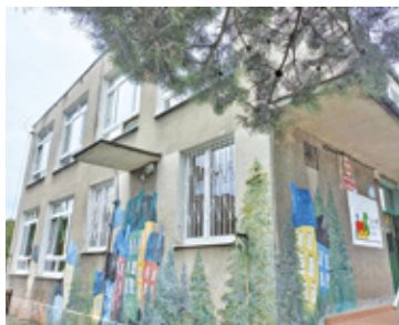
Przedszkole znajduje się w starym budynku z lat 70.

Niedawno w Pruszkowie zakończono prace nad przebudową budynku przedszkola numer 11. Już niedługo kolejna placówka, przedszkole nr 9, przejdzie metamorfozę.