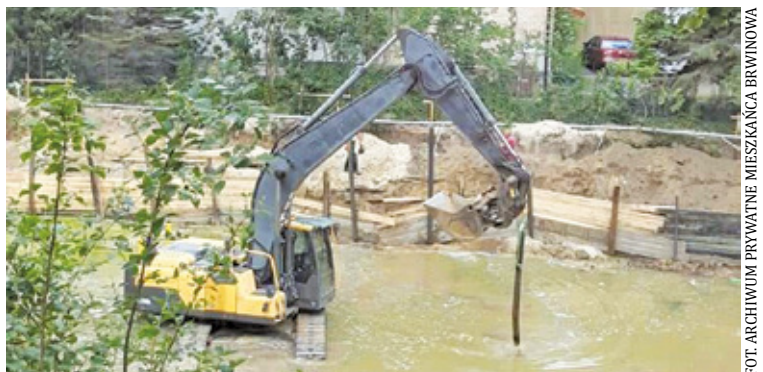
Działania deweloperów często budzą kontrowersje