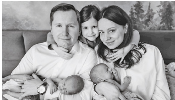
Rodzina z bliźniakami