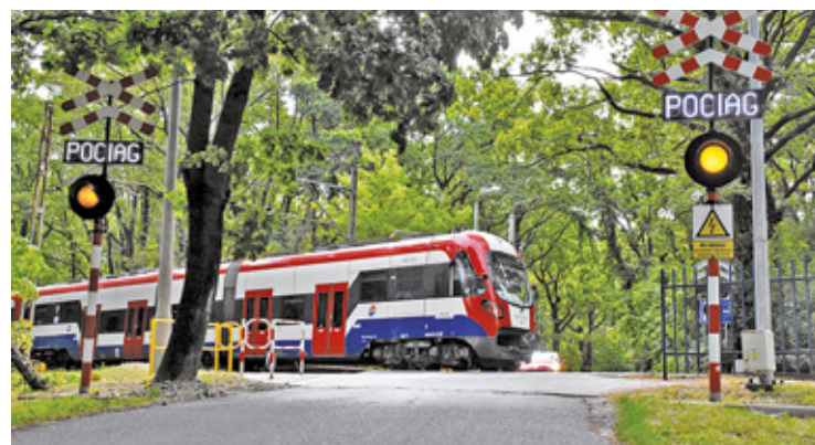
Czy po zakończeniu prac WKD znów będzie punktualne i niezawodne?

Na relacji Komorów – Reguły – Michałowice została uruchomiona zastę-