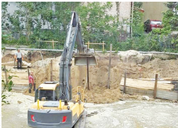
Budowa przy ul. Grodzkiej

Problemy z budową nowych budynków mieszkalnych pojawiają się na terenie całego kraju. Osiedla wyrastają wszędzie, a najbliżsi sąsiedzi inwestycji rzadko cieszą się z tego powodu. W przeciwieństwie do osób, które kupują nowe lokale. Zapotrzebowanie na mieszkania wciąż rośnie, dlatego wiele miast zmienia ostatnio swoje oblicze.