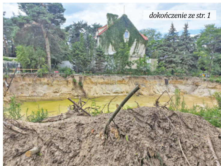
Wykop został zalany