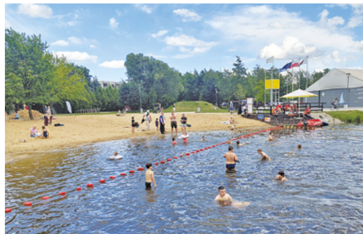
Na Stawach Walczewskiego prawie w każdy weekend można spędzić miło czas z całą rodziną

jeży i ptaków. – W zeszłym roku pewnego dnia budki dla kotów z naszego osiedla po prostu zniknęły. Potrzebna była batalia, aby pojawiły się znowu! – mówi. – W wydziale ochrony śro-