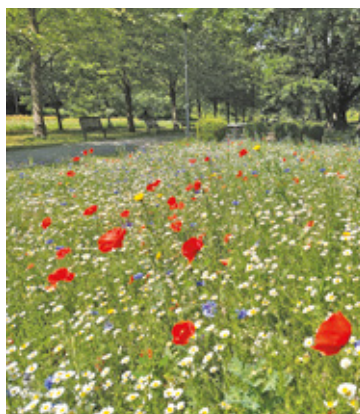
Grodzisk Mazowiecki to... zielone miasto! Park Skarbków zachwyca nie tylko kwietnymi łąkami