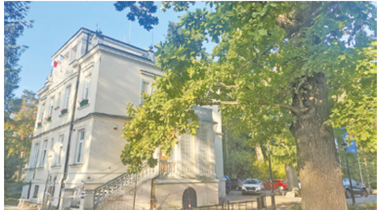
Milanówek jest pełen malowniczych willi i pięknych ogrodów, ale między nimi są także opuszczone domy