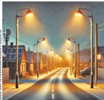
GRAFIKA WYGENEROWANA PRZEZ AI

Samorząd zainwestował w bezpieczeństwo uczestników ruchu drogowego. W Starej Wsi pojawiły się nowe lampy oświetlające drogi, a już niedługo zostaną zainstalowane w kolejnych miejscach gminy.