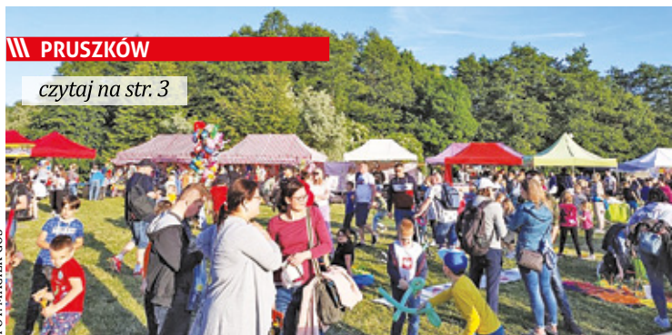
Dni Pruszkowa w 2023 roku

||| Milanówek - Dlaczego tylko radni sprzątają Rokitnicę s. 7