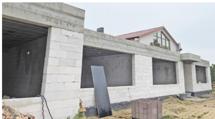
Remont i modernizacja starego budynku mają zakończyć się jeszcze przed początkiem roku szkolnego

niejącej części szkoły, która ma być zakończona do końca sierpnia. Jej celem jest przede wszystkim rozdzielenie części szkolnej i przedszkolnej. Podczas tego etapu inwestycji szkoła i przedszkole uzyskają osobne wejścia.