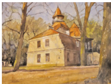
Akwarela Marka Ziarkowskiego Pałac Kasyno – Siedziba Centrum Kultury i Inicjatyw Obywatelskich w Podkowie Leśnej

Zaproszeni do debaty mieszkańcy Podkowy Leśnej również przedstawili swoje propozycje. Był to m.in.: polonez