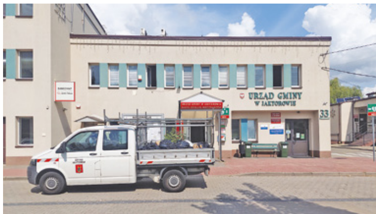
Urząd gminy mieści się po tej lepszej stronie miasta niż wymagająca remontu ulica Pomorska