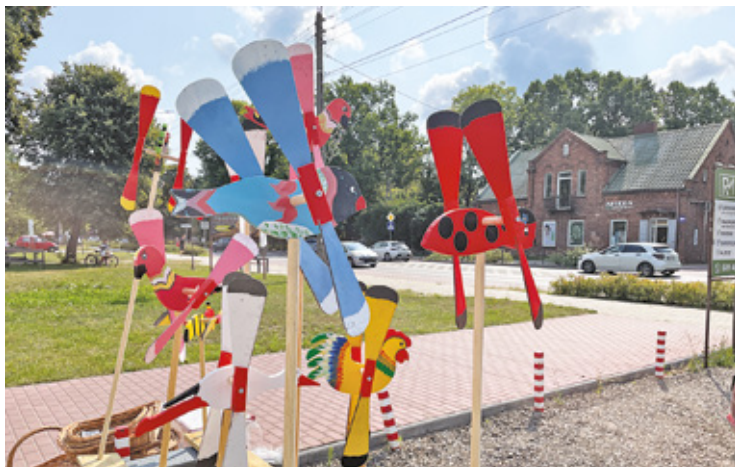
W Jaktorowie jest cicho i malowniczo

Przed dwoma laty Jaktorów stał się głośny z powodu protestów organizowanych przez mieszkańców gminy przeciwko budowie Centralnego Portu Komunikacyjnego. Według ówczesnych planów gmina miała być dosłownie rozjechana szeregiem linii kolejowych zbudowanych na potrzeby lotniska, czyli tzw. szprychami. Zburzonych miało być wiele domów, a życie w innych, które znalazłyby się blisko torów, mogłoby być bardzo uciążliwe, zwłaszcza gdy ktoś przywykł do ciszy. A przywykł, a nawet jej szukał, skoro tu się osiedlił. Dodajmy, że wielu mieszkańców przybyło tu z różnych miast, m.in. z Warszawy.