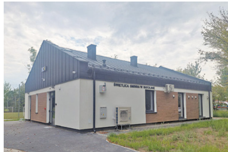
Nowa świetlica stoi blisko osiedla szeregowców, a więc w innym miejscu niż dawna

Budynek nowej świetlicy w Natolinie znajduje się w innym miejscu niż dawna wiejska świetlica. Nowa świetlica znajduje się na osiedlu szeregowców przy ulicy Kasieńki. Jest w pełni nowoczesna, dostosowana do potrzeb osób z niepełnosprawnościami, zaopatrzona