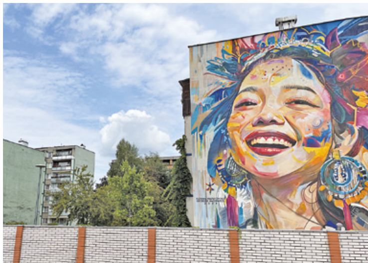
Przy ulicy Szkolnej róg Królewskiej powstał mural upamiętniający II edycję Festiwalu Kultur Świata