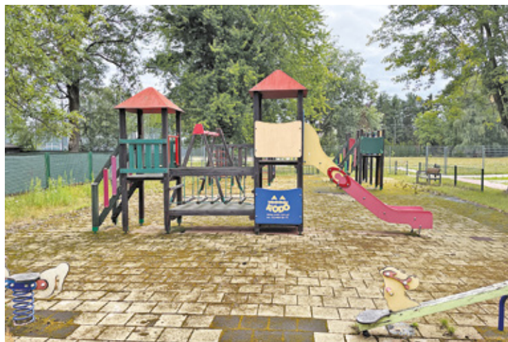
Plac zabaw dla uczniów szkoły podstawowej jest od dwóch lat zamknięty z powodu stanu technicznego

Podpisana została umowa na remont i modernizację dwóch placów zabaw istniejących przy Zespole Szkolno-Przedszkolnym nr 1 w Grodzisku Mazowieckim, a więc w przemysłowej dzielnicy Łąki. Mieszkańcy i dyrekcja mają nadzieję, że to początek większej inwestycji.