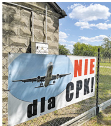
Gmina pustoszeje banery płowieją

Na płotach w Pułapinie Nowej, małej wiosce za Baranowem, nadal wiszą już wypłowiałe napisy: „NIE dla CPK!”. Tylko co drugi, trzeci dom jest zamieszkały, a podwórko i ogród zadbane. W jednym z tych ogrodów rozmawiamy z małżeństwem emerytów. – Żyje się nam tu jak na bombie, bo nie wiemy, kiedy będziemy musieli stąd wyjechać! – stwierdza starsza mieszkanka wioski.