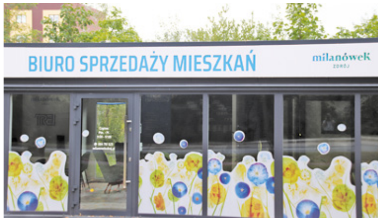
Biuro Sprzedaży Mieszkań Milanówek Zdrój

W uzasadnieniu uchwały przywołany jest wyrok, w którym Sąd Najwyższy przyjął koncepcję szerokiego katalogu dóbr osobistych jednostek samorządu terytorialnego, uznając, że przez dobra osobiste osoby prawnej rozumie się wartości niemajątkowe związane z wyodrębnieniem osoby prawnej i jej działaniem w zakresie swych zadań; niekiedy dodaje się, że chodzi tu o wartości umożliwiające prawidłowe funkcjonowanie osoby prawnej w zakresie jej zadań. W przypadku gminy będzie to obszerna sfera zadań, wyznaczonych przez ustawę o samorządzie gminnym: zaspokajanie potrzeb mieszkaniowych, urbanistyka, komunikacja, opieka zdrowotna, handel, oświata, kultura, rozrywka, turystyka; zaspokajanie szerokich potrzeb wspólnoty mieszkańców gminy.