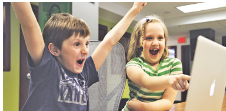
Ważne by zajęcia dodatkowe sprawiały dziecku radość i rozwijały jego predyspozycje

Jednak dzieci, które są dynamiczne, mają temperament, będą męczyć się na zajęciach, wymagających siedzenia w jednym miejscu. Takim dzieciom na pewno pomogą zajęcia sportowe jak modne dziś sztuki walki. Budują one nie tylko sprawność i odwagę, ale także kształtują dyscyplinę i umiejętność koncentracji tak niezbędną w nauce choćby języków obcych. I nie do przecenienia w dorosłym życiu. Warto też pamiętać, że kiedy dziecko rozwija umiejętności manualne, ruchowe, a więc zdobywa nowe umiejętności, rozwijają się połączenia neuronalne w jego mózgu, a więc zwiększa się, jak można by powiedzieć, baza do nauki do myślenia, rozumienia itp.