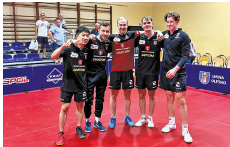
Mistrzowie z Grodziska Mazowieckiego wygrywają w pierwszym meczu!

Pogoń dalej jest najlepszym zespołem na trzecim stopniu rozgrywkowym w Polsce, mając 1 punkt przewagi nad drugą Polonią Bytom. Następnie w tabeli znaleźć można Wieczystą (3 punkty mniej) i Zagłębie Sosnowiec (strata