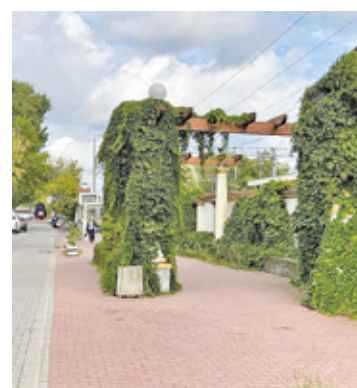
Dojazd do Warszawy zajmują chwilę

Warszawie, że spacerując po mieście, ktoś cię zaczepi, albo będzie pół nocy krzyczał pod twoim blokiem. Wiem, bo