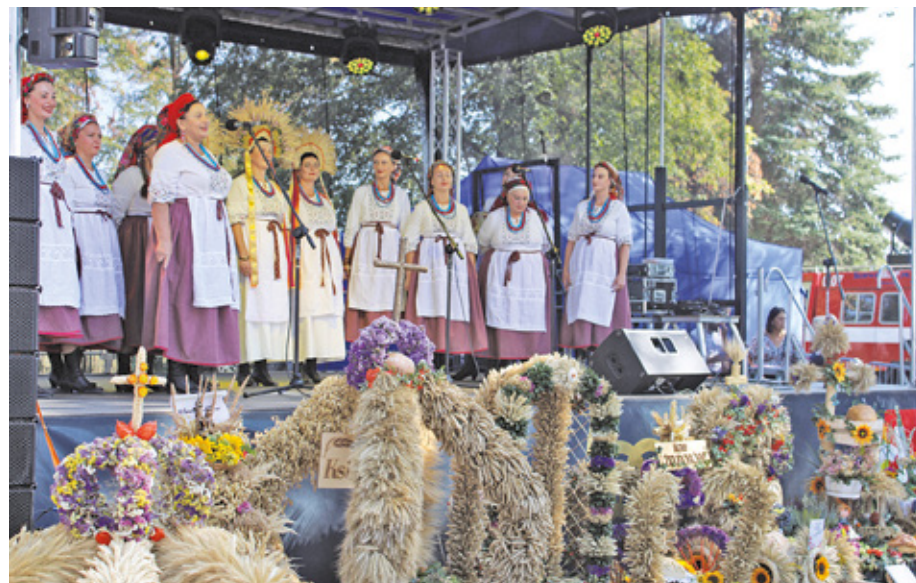
Koncert Białego Chóru podczas dożynek