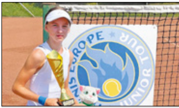
||| Piastów - Niezwykły talent sportowy s. 2