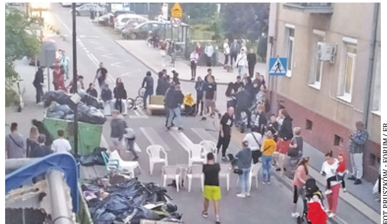
Zdesperowani mieszkańcy zablockowali ulicę – interweniowała policja

P o pożarze miasto zapewniło mieszkańcom kamienicy tymczasowe lokale w hostelach. We wtorek (10 września) lokatorzy otrzymali dobrą wiadomość. Mogą wrócić do swoich mieszkań. Urzędnicy uznali, że 8 z 11 lokali w budynku nadaje się do zamieszkania. Niestety, kiedy mieszkańcy wrócili na ulicę Stalową, czekała ich niespodzianka.