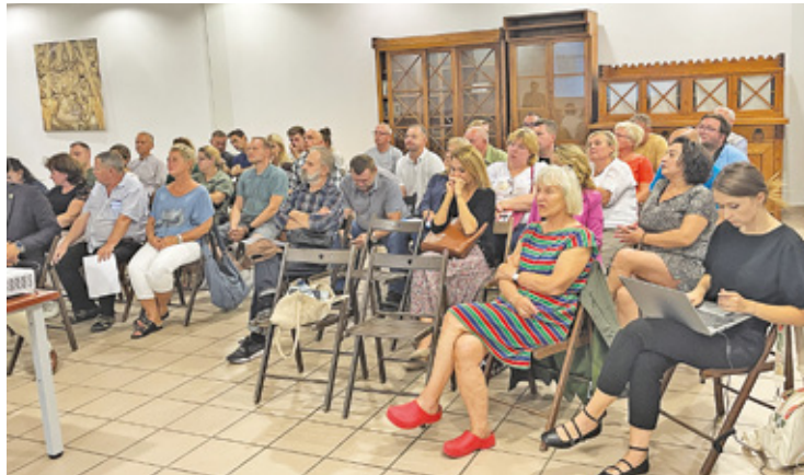
Nie tylko frekwencja, ale także dobra wola, by dojść do konsensusu dopisała na wczorajszym spotkaniu kupców z miastem

Walcząc o estetykę targu, miasto planuje ujednolicić pawilony, zazielenić plac, a także wymienić oświetlenie na LED. W planach jest także likwidacja