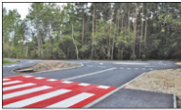
||| Żółwin/Brwinów - Młochowska prawie gotowa s. 3