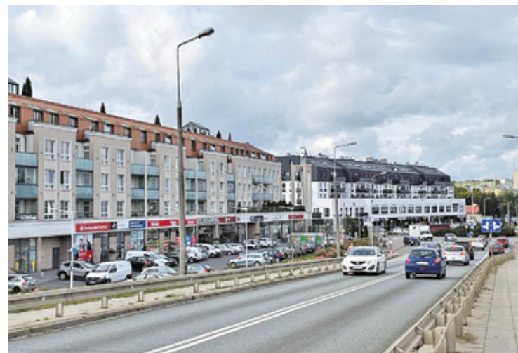
Jakość dróg to wątek przewodni wielu dyskusji o Piastowie

– Jasne, w Piastowie nie mieliśmy klubów i dyskotek, żeby się w nich pobawić. Pewnie dlatego tak popularne były „domówki”. Jeszcze kilka lat temu kino było w oplakany stan. Teraz przeszło remont, ale ma bardzo ograniczony repertuar. Jest tu niewiele miejsc, gdzie można wyjść wieczorem. Nie ma co liczyć również na długie spacery wśród zieleni, tutejsze parki są raczej małe. Za to jest spokojnie. Pewnie właśnie dlatego, że duża część mieszkańców bawi się w stolicy, to w Piastowie jest znacznie mniejsza szansa niż w