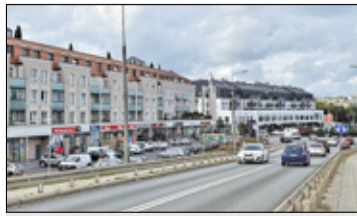
||| Piastów - Jak się żyje w Piastowie? s. 4