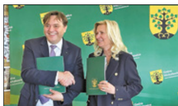
||| Michałowice - Nowe autobusy s. 2