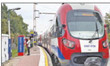
||| Milanówek - Mieszkańcy dojadą, ale z przesiadką s. 4