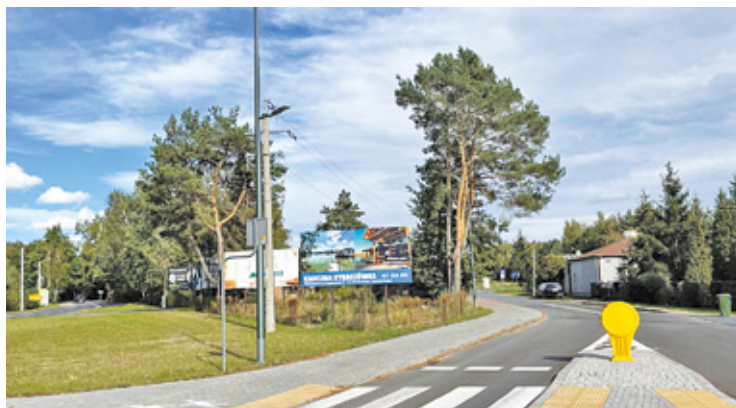
Nie ma zgody co do miejsca gdzie ma stanąć maszt 5G

Maszt miał powstać tuż przy rondzie, które łączy ul. Pruszkowską z ulicami Jeżynową i Działkową, niedaleko