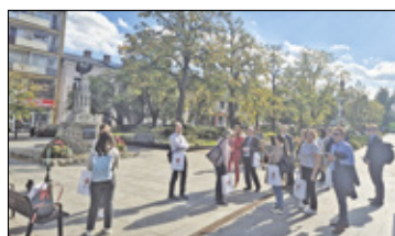
||| Grodzisk Mazowiecki - Międzynarodowo w Parku Skarbków s. 9