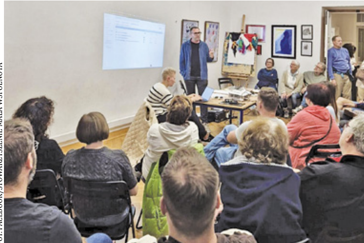
Mieszkańcy Otrębus nie są bierni wobec zaistniałej sytuacji. Licznie stawili się na zebraniu sołeckim w sprawie budowy amfiteatru

Mieszkańcy skarżą się na uporczywe i „złośliwe” roztawienie niektórych elementów infrastruktury, jak chociażby generatory prądotwórcze w pobliżu zabudowanych działek. Widzimy to