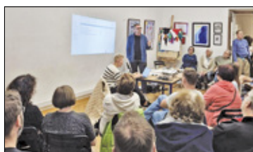
||| Otrębusy - Kontrowersje wokół budowy amfiteatru s. 9