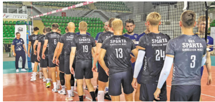
Grodziscy siatkarze w akcji