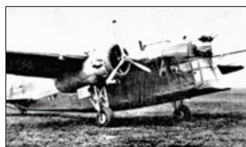
||| Historia - Katastrofa bombowca nad Michałowicami s. 10