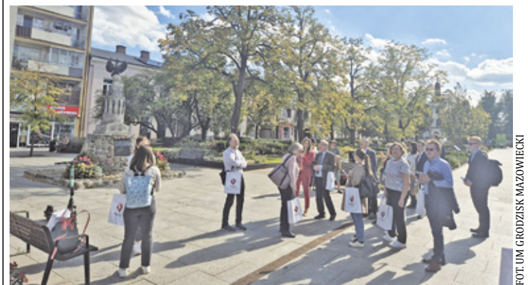
Wizytującym podobały się hotele dla owadów i małych zwierząt, które zostały zbudowane w parku

Spotkanie w Grodzisku Mazowieckim było nie tylko podsumowaniem dotychczasowych działań, realizowanych w ramach programu klimatycznego EOG, ale także planów gminy na przyszłość w zakresie zwiększenia od-