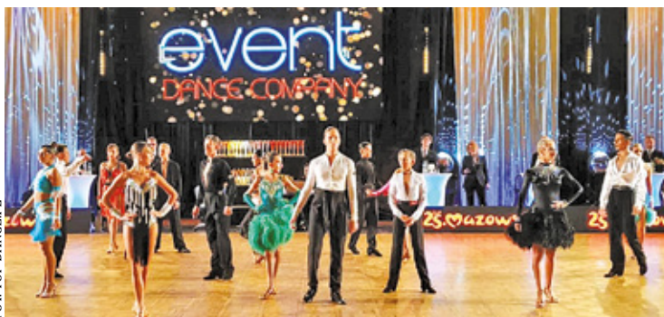
To już piąty turniej tańca o takiej randze i takiej wielkości na terenie powiatu pruszkowskiego, organizowany przez Top Dance

UKS Top Dance Pruszków jest pierwszym klubem sportowym w powiecie pruszkowskim, który specjalizuje się w dyscyplinie sportowego tańca towarzyskiego. Stowarzyszenie