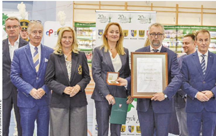
Przedstawiciele władz gminnych stawili się wspólnie na jubileuszu

Stowarzyszenie Gmin Zachodniego Mazowsza „Mazovia” zrzesza siedem gmin z powiatów grodzkiego, pruszkowskiego oraz warszawskiego zachodniego: Błonie, Brwinów, Leszno, Michałowice, Milanówek, Nadarzyn i Podkowie Leśną. To już 20 lat tej inicjatywy, która od lat wspiera integrację mieszkańców i poprawę jakości życia w regionie.