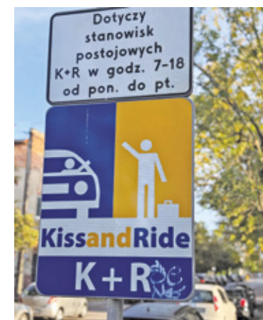
W Pruszkowie w ostatnich latach ustanowiono 7 stref K+R pod placówkami oświaty, które pozwalają rodzicom zaparkować pod szkołą, zaprowadzić dziecko na lekcje i bezpiecznie odjechać do pracy

Wiele osób zwraca uwagę także na bliskość szkół od miejsc parkingowych: