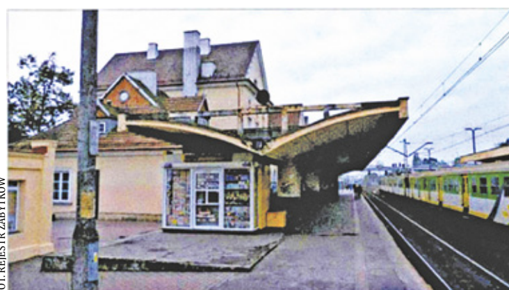
Skrzydlate wiaty na stacji w Grodzisku Mazowieckim

zabójstwa był cały dzień na służbie. Właściciel budki z wodą sodową mógł go widzieć innego dnia, czyli pomylił