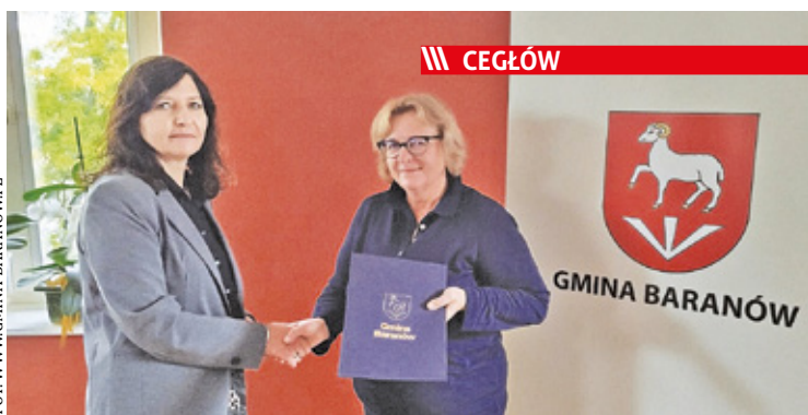
Umowa na realizację została podpisana, a prace rozpoczną się już zimą

||| Pruszków - Oświetlone przejścia s. 9