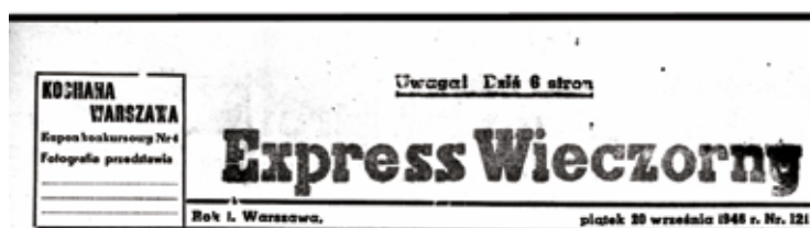
Fragment strony tytułowej dziennika Express Wieczorny