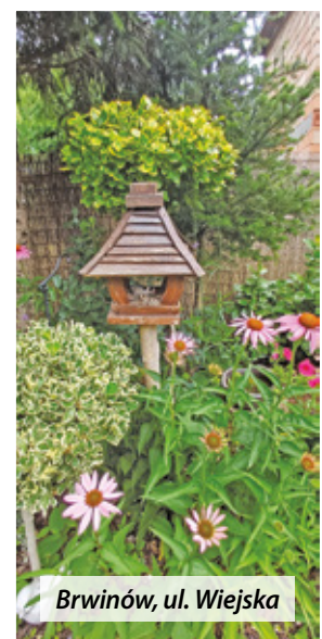
Brwinów, ul. Wiejska