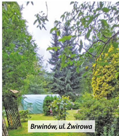
Brwinów, ul. Żwirowa