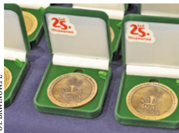
Na zdjęciu medale dla wszystkich małych sportowców

Po części oficjalnej nastąpiła część sportowa, Jubileuszowy Turniej Dzieci i Młodzieży, czyli coś z głównego nurtu