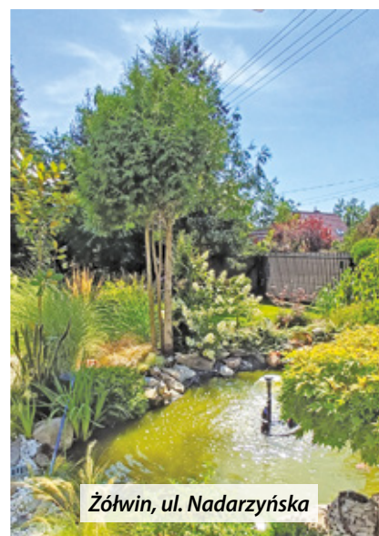
Żółwin, ul. Nadarzyńska