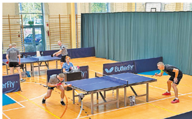
FOT. FB: TENIS STOŁOWY - KS NADARZYN