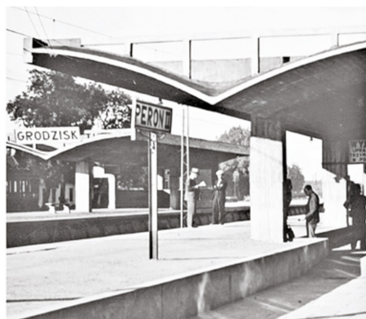
Stacja w Grodzisku Mazowieckim