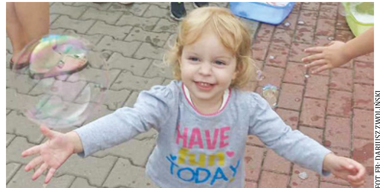
Nowy żłobek pomieści ponad 100 dzieci

Nowa inwestycja powstanie dzięki uzyskanym przez urząd gminy funduszom zewnętrznym w wysokości około 12 milionów złotych ze środków unij-