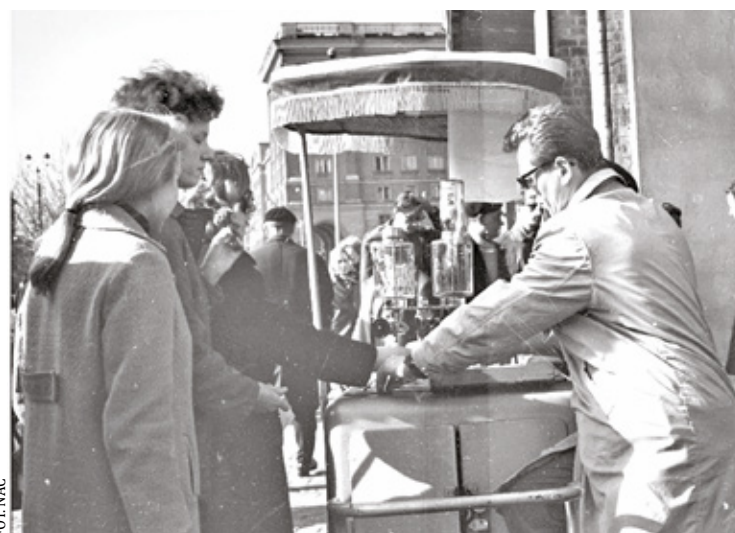
Sprzedawca wody sodowej, wprawdzie nie ten z opowieści, ale w podobnym stylu