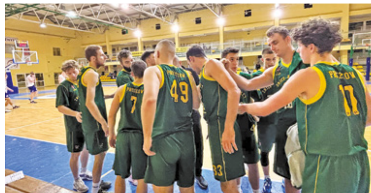
Zła passa przełamana