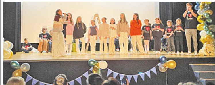
Młodzież powitała gości okolicznościowym przedstawieniem

Podopieczni świetlicy często wyjeżdżają w różne zakątki Polski. Dzięki wsparciu gminy i funduszy zewnętrznych, wycieczki te nie są dużym obciążeniem dla rodziców dzieci.