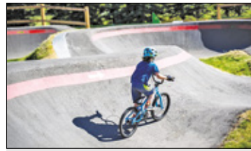
||| Jaktorów - Pumptrack dla fanów akrobacji s. 6