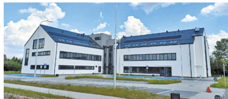
Nowy budynek ma ponad 3 tysiące metrów kwadratowych. Został podzielony na trzy skrzydła

– Budynek zostanie oddany do użytkowania Publicznemu Zakłado-