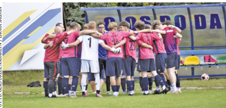
Drużyna Orła walczy o punkty w A-klasie