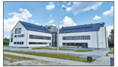
||| Nadarzyn - Otwarcie ośrodka zdrowia s. 6