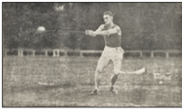
||| Brwinów - Legenda Polskiej Lekkoatletyki s. 4