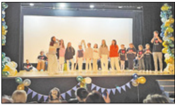
||| Piastów - 20 lat minęło... s. 3

P R U S Z K Ó W ||| P I A S T Ó W ||| B R W I N Ó W ||| M I C H A Ł O W I C E ||| N A D A R Z Y N ||| R A S Z Y N