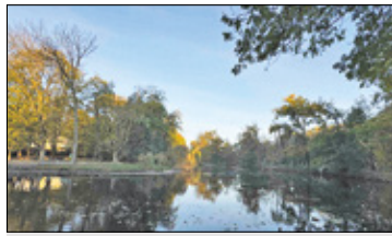
||| Pruszków - Susza w parku s. 4