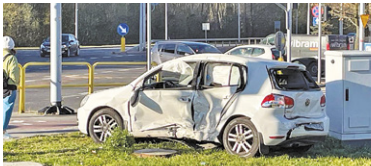
Na skrzyżowaniu nie działała sygnalizacja świetlna. To prawdopodobnie zmyliło sprawczynię kolizji