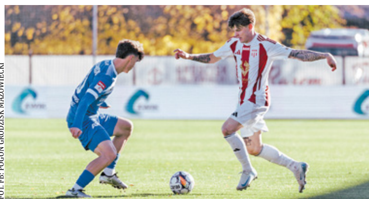
Okazji do zdobycia bramki nie brakowało!