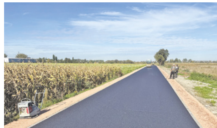
To już czwarty, zakończony etap budowy ulicy Józefowskiej w sołectwie Krosna

rzystywanej zarówno do ruchu pojazdów osobowych, jak i do ruchu ciężkich maszyn rolniczych, w tym ciągników z przyczepami czy kombajnów, wykonano obecnie trwalszą nawierzchnię drogową – przekazała gmina na swojej stronie.