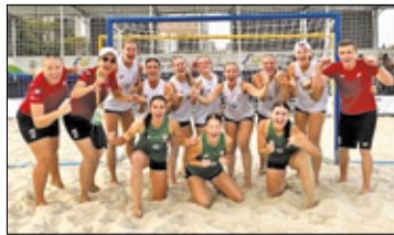
||| Jaktorów - Wicemistrzostwo Barańskiej s. 5