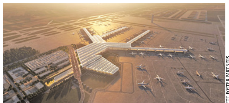
Projekt czeka na decyzję Wojewody Mazowieckiego