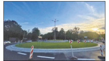
||| Pruszków - Rondo z patronem s. 6