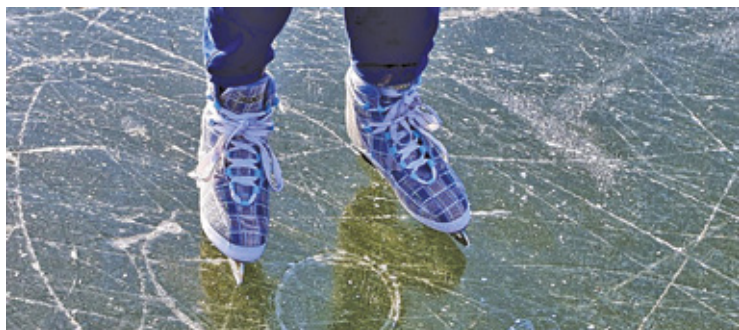
Lodowisko powstanie przy Szkole Podstawowej nr 2

Lodowisko będzie darmowe dla dzieci poniżej 7 lat oraz uczniów z Pruszkowską Kartą Mieszkańca, Kartą Dużej Rodziny, Pruszkowską Kartą Dużej Rodziny albo aktualną legitymacją szkolną wydaną przez placówki oświatowe w Gminie Mieście Pruszków. Za wejście na tafle nie zapłacą również dorośli z Pruszkowską Kartą Miesz-