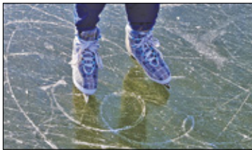
||| Pruszków - Lodowisko coraz bliżej s. 3