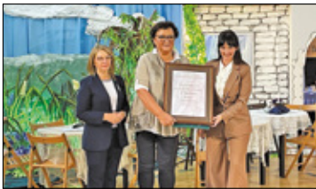
||| Pruszków - Urodziny szkoły s. 3

PRUSZKÓW ||| PIASTÓW ||| BRWINÓW ||| MICHAŁOWICE ||| NADARZYN ||| RASZYN