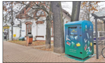
||| Milanówek - Kolorowe kontenery s. 5