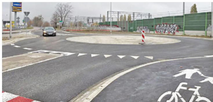
Prace nad rondem rozpoczęto we wrześniu. 12 listopada udało się przywrócić ruch pojazdów na tym skrzyżowaniu

Działania wykonawcy objęły nie tylko zbudowanie samego skrzyżowania, ale również przebudowę sieci wodociągowej oraz kanalizacyjnej, instalację nowego oświetlenia ulicznego,