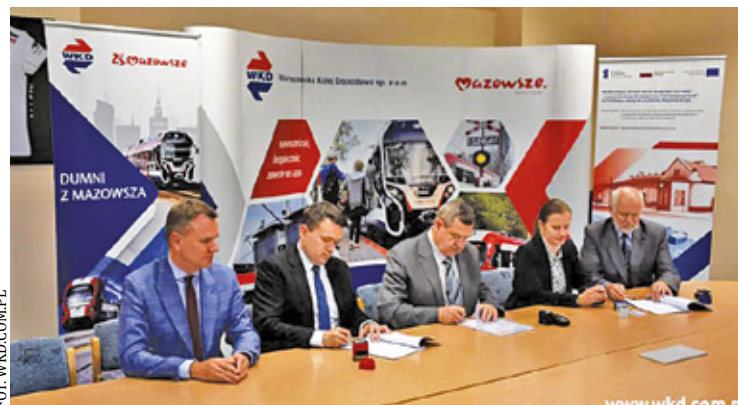
Zakup pociągu sieciowego, to wydatek 14 058 900 zł

Nowy pojazd będzie miał szeroki zakres zadań, w tym budowę, naprawę i konserwację sieci trakcyjnej oraz linii nietrakcyjnych zawieszonych na konstrukcjach trakcyjnych. Pozwoli to na prowadzenie prac przy konstrukcjach wsporczych sieci w stanie beznapięciowym.