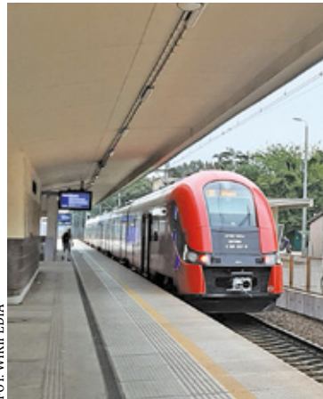
Peron stacji kolejowej w Pruszkowie rok 2022

temu świetna okazja. 22 listopada o 18:00 w sali Przystanku Pruszków (na terenie dworca PKP w Pruszkowie) na