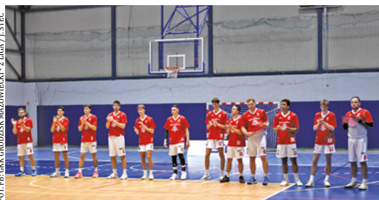
Zawodnicy z Grodziska Mazowieckiego postarają się przerwać złą passę