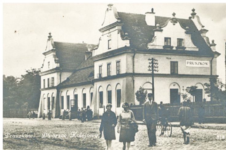
Dworzec kolejowy w Pruszkowie około 1932 roku