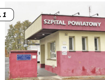
Czy poradnie zostaną przeniesione na Wrzesin?

– Musimy zadać sobie kluczowe pytanie: czy możemy pozwolić na to, by mieszkańcy stracili dostęp do bliskiej i sprawdzonej opieki zdrowotnej? Zły stan techniczny budynku przy ul. Drzymały to efekt lat zaniedbań i braku inwestycji. To nie wina pacjentów, że budynek potrzebuje remontu, a przerzucanie ich do mniej dogodnej lokalizacji nie jest rozwiązaniem, tylko odsunięciem problemu. Nie możemy się zgodzić na to, by decyzje podejmowane były kosztem zdrowia i komfortu mieszkańców. Jako radny powiatu pruszkowskiego będę stanowczo sprzeciwiał się przeniesieniu przychodni! Uważam, że zamiast odsuwać