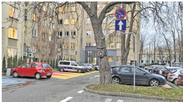
Miejsca dla interesantów są specjalnie oznaczone

Warto zauważyć, że system płatności przy urzędzie miasta nie jest nowym pomysłem.