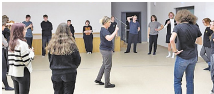
Zajęcia uczą młodzież pewności siebie