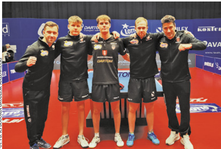
Gladiatory wygrywają mecz za meczem