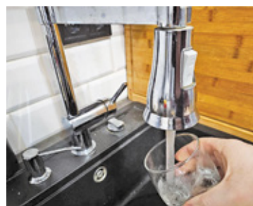
Wyniki nie wykazały przekroczeń dopuszczalnych norm

– Przygotowujemy się do inwestycji w dodatkowe urządzenia technologiczne do usuwania z wody związków chlorowcoorganicznych. W tej chwili kończymy prace nad doбором finalnych rozwiązań. Wykonaliśmy dodatkowe, niezależne badania wody w dziewiętnastu ujęciach własnych na terenie Milanówka, których wyniki nie wykazały przekroczeń dopuszczalnych norm. Toczą się dwa postępowania na budowę nowych ujęć wody ze źródeł oligoceńskich, które zabezpieczą zasoby wody w przyszłości (ul. Długa oraz Dębowa) – dodaje urząd.