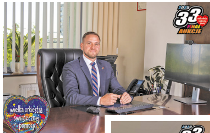
Burmistrz Piastowa i starosta powiatu pruszkowskiego w ramach zbiórki WOŚP oferują licytującym swoje towarzystwo

Osoba, która wygra licytację, zje posiłek z włodarzem w wybranej przez siebie restauracji na terenie powiatu pruszkowskiego. Dodatkowo zwycięz-