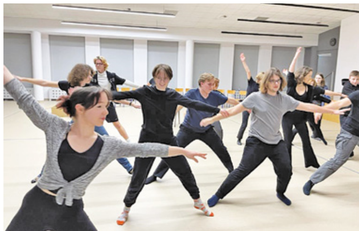
Teatr, to przede wszystkim zgrana grupa nastolatków