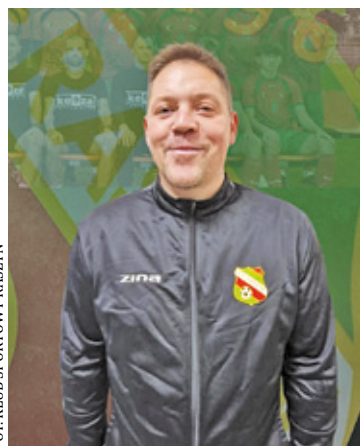
KS Raszyn już pod wodzą nowego trenera