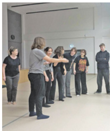
Podczas ćwiczeń młodzi aktorzy trenują swoją postawę oraz dykcję