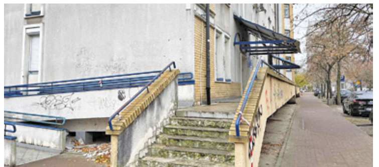
Budynek jest w bardzo złym stanie technicznym. Wymaga gruntownego remontu