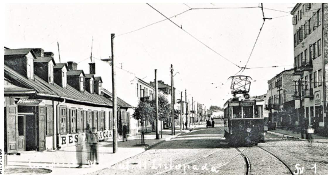
Grodzisk Mazowiecki ul. 11 listopada w 1940 r.

„Towarzysz Koza uniewinniony!” Oto tytuł w gazecie Robotnik. Otóż w dniu 1 grudnia w sądzie okręgowym odbyła się rozprawa w Wydziale Odwoławczym w Warszawie. Byli radny