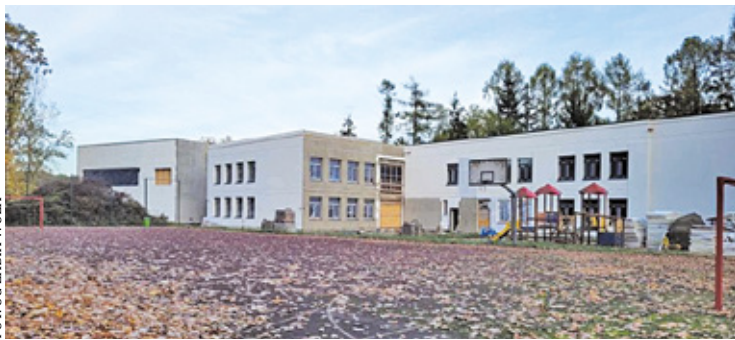
FOT. UCZ. ZABIA WOLA

Przełom nastąpił w grudniu 2024 roku, kiedy przedstawicielom gminy udało się uzyskać dodatkowe fundusze na ten cel. Gmina dostała prawie 5 milionów złotych. Dzięki tym funduszom magistrat mógł rozpisac nowy przetarg na dokończenie prac. Tym razem chętnych nie brakowało. Pięć firm wzięło udział w konkursie. Wygrało przedsię-