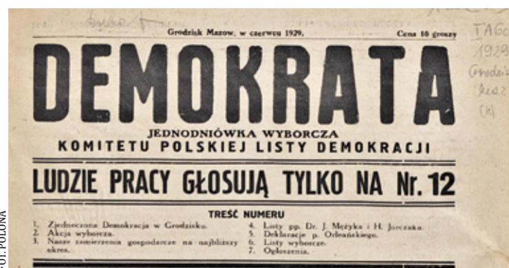
Agitacja wyborcza w Grodzisku ulotka dla elektoratu 1929 r.