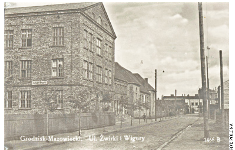
Grodzisk ul. Żwirki i Wigury tuż przed II wojną światową