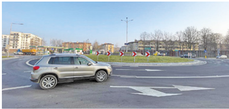
Radni zdecydowali, że nowe rondo będzie nosiło imię żołnierzy 36. Pułku Piechoty Legii Akademickiej

Kierowcy co prawda korzystają z nowego ronda, łączącego Aleję Wojska Polskiego, ulicę Przyszłości, ulicę Działkową i ulicę Emancypantek już od kilku miesięcy. Jednak dopiero w środę (22 stycznia) odbyło się oficjalne oddanie do użytku tej inwestycji.