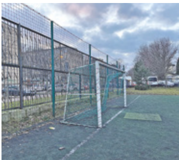
Stan boiska od dawna pozostawał wiele do życzenia

W ramach inwestycji powstanie nowoczesne boisko: jedno z na-