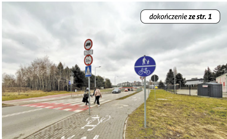
dokończenie ze str. 1

Projekt obejmuje gruntowną przebudowę skrzyżowania, w tym modernizację jezdni oraz budowę nowych chodników i ścieżek rowerowych. Dodatkowo wykonany zostanie nowy system odwodnienia, który poprawi