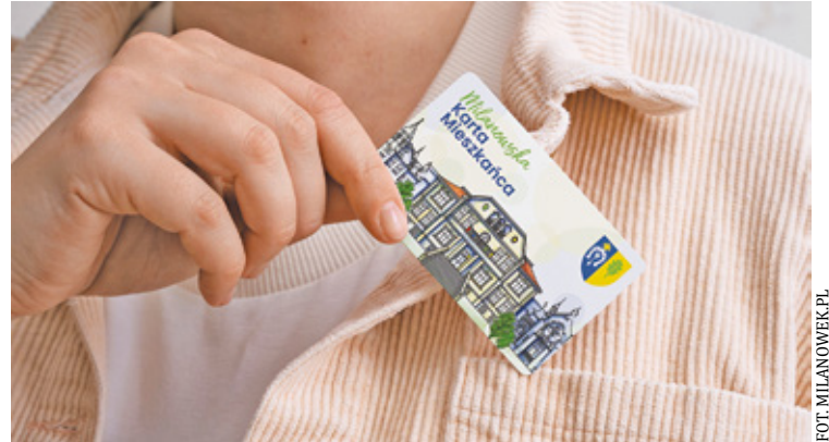
Tak będzie wyglądać Milanowska Karta Mieszkańca

Uzyskanie Milanowskiej Karty Mieszkańca jest proste. Program jest skierowany do osób fizycznych, zameldowanych na terenie Gminy Mila-