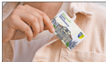
||| Milanówek - Milanowska Karta Mieszkańca s. 5