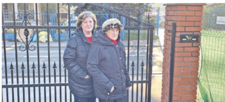
Emerytki przyznają, że są już bardzo zmęczone. Zaczynają czuć się bezsilne wobec biurokracyjnej maszyny