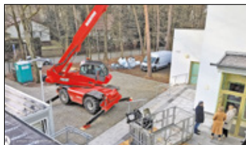
||| Podkowa Leśna - Trwa remont dachu hali sportowej s. 4