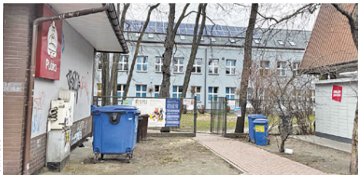
Tym razem teren został szybko posprzątny

Teren przy ulicy Orzeszkowej to nie jedyne miejsce, w którym pojawiają się podobne śmieci. Pracownicy z UM zapewniają, że mają zamiar na bieżąco działać i zrobić wszystko, aby zapewnić porządek w Piastowie. Proszą również mieszkańców o pomoc. Mimo patroli możliwe jest, że niektórych problemów nie zauważą od razu. Dlatego widząc rozsypane śmieci, warto zadzwonić do Wydziału Utrzymania Miasta w piastowskim magistracie. Maciek Gos