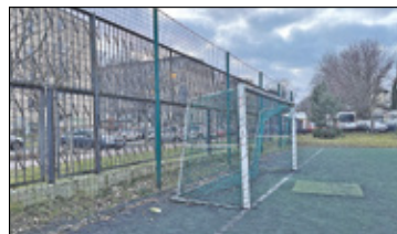
||| Pruszków - Nowoczesne boisko dla „czwórki” s. 5