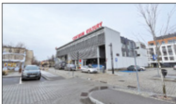
||| Grodzisk Mazowiecki - Umowa na parking i schron podpisana s. 3