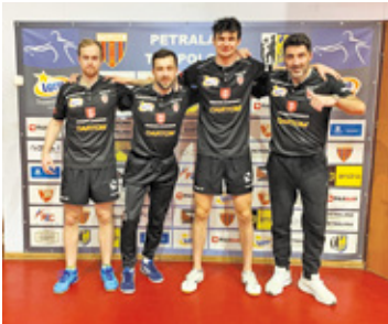
Mistrzowie Polski z punktami w Bytomiu, ale bez u siebie