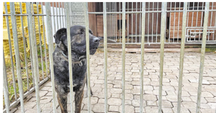
Kastracja i sterylizacja to najskuteczniejsze sposoby przeciwdziałania problemowi bezdomności psów i kotów w miastach i wsiach w Polsce

Sterylizacja i kastracja mają więcej plusów niż minusów. Zabiegi chronią zwierzęta przed licznymi chorobami, między innymi nowotworami jajników, sutków czy w przypadku psów prostaty. Co prawda na przykład po sterylizacji suki mogą zacząć tyć lub nie trzymać moczu na starość, ale są to problemy łatwe do rozwiązania, za pomocą diety i odpowiednich leków – powiedział nam podczas rozmowy Andrzej Skowron, lekarz weterynarii. – Ponadto to najlepsze metody zapobiegania niechcianym ciążyom u zwierząt. Schroniska są przepełnione, dlatego należy robić