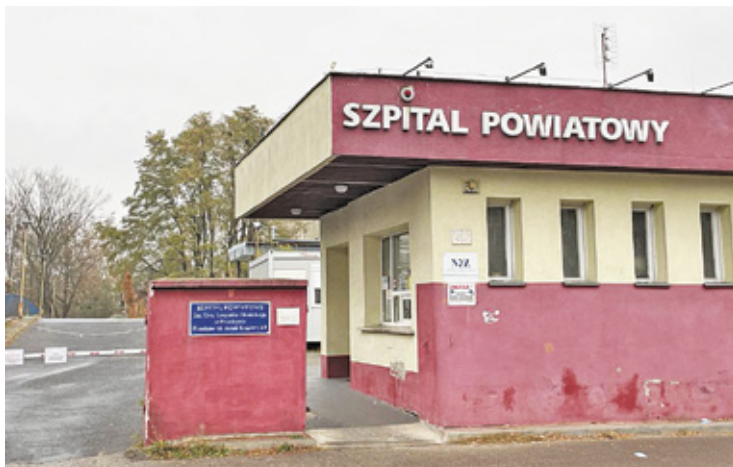
Szpital czeka nowa inwestycja

P rzypomnijmy: wszystko zaczęło się wraz z pojawieniem się programów z KPO, dotyczących szpitali. Placówka na Wrzesinie wzięła udział