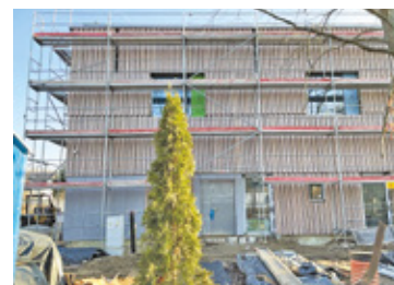
Do czerwca budowa powinna być zakończona. 1 września placówka przyjmie pierwszych przedszkolaków

Projekt przedszkola zakłada budowę dwukondygnacyjnego budynku, na którego parterze usytuowane będą sale zajęć dla dzieci oraz pomieszczenia o funkcji gastronomicznej. Piętro podzielone będzie na dwa skrzydła. Skrzydło południowo-zachodnie poświęcone będzie funkcjom rekreacyjno-sportowym, natomiast skrzydło północno-wschodnie – administracji przedszkola. Warto dodać, że wszystkie pomieszczenia dostępne będą dla osób z niepełnosprawnościami. W