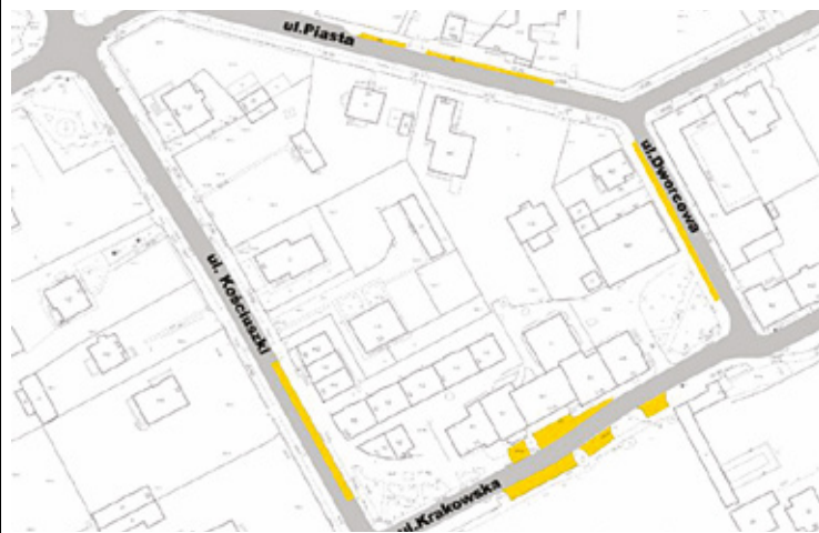
Mapa z zaznaczonymi miejscami objętymi nową organizacją parkowania

– Czy planowane są podobne strefy po drugiej stronie torów? To właśnie tam znajduje się większość placówek handlowych.