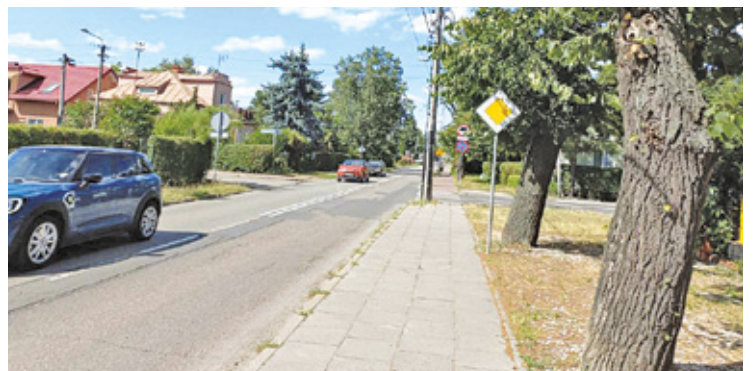
Remont powinien poprawić również bezpieczeństwo ruchu