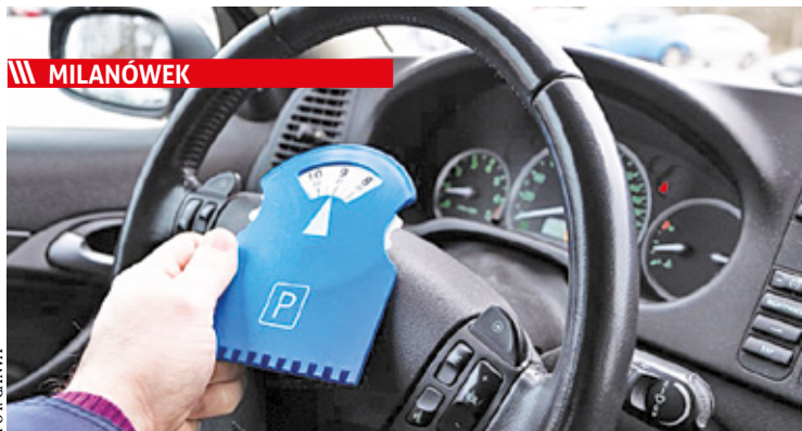
Wprowadzenie limitu czasu postoju ma poprawić rotację pojazdów