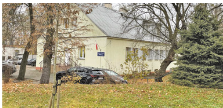
Budynek administracji może zostać wyburzony

Radni byli jednomyślni. Zdecydowali, że zabezpieczą około 1 900 000 zł na dofinansowanie przebudowy szpitala