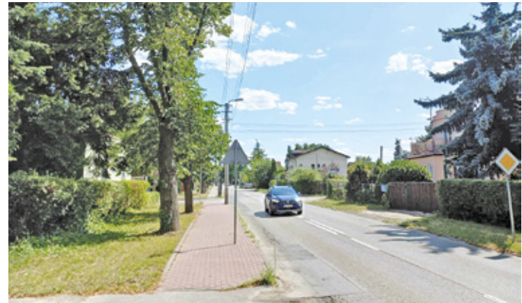
Inwestycja powinna rozpocząć się w tym roku

„Droga jest częścią linii komunikacyjnej nr 62 oraz piastowskiej linii P-1, co oznacza lepszą jakość podróży