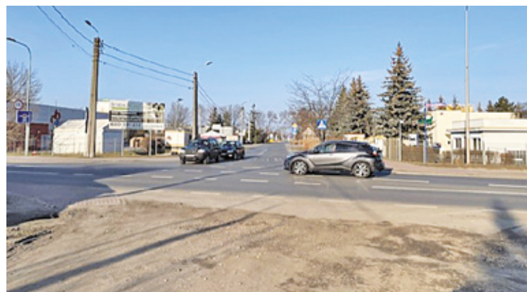
W tym miejscu już niebawem rozpoczną się prace remontowe