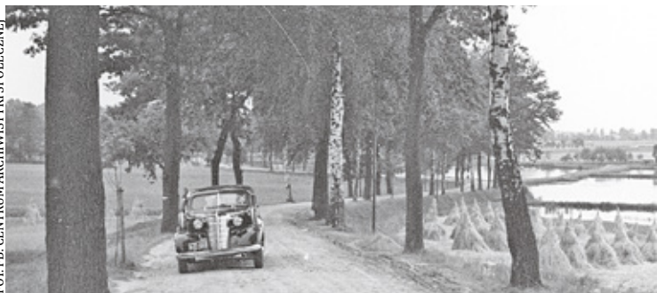
Wokół wystawy zorganizowany zostanie szereg działań towarzyszących, w tym warsztaty, spacer i spotkania

Efektom tego przedsięwzięcia ma być mobilny pawilon wystawienniczy, w którym mieszkańcy będą mogli przynieść swoje fotografie i opowieści. Pracownicy Centrum Archiwistyki Społecznej będą skanować przynieszone zdjęcia oraz tworzyć ekspozycję. Powstałe pliki cyfrowe, wzbogacone o dodatkowe informacje, zostaną przekazane do nowo powstającego archiwum społecznego, którym będzie zarządzać Biblioteka Publiczna im. Wacława Wernera w Brwinowie. Projekt „Pamięciownik” będzie jednym z najważniejszych wydarzeń obchodów 75-lecia nadania Brwinowowi praw miejskich.