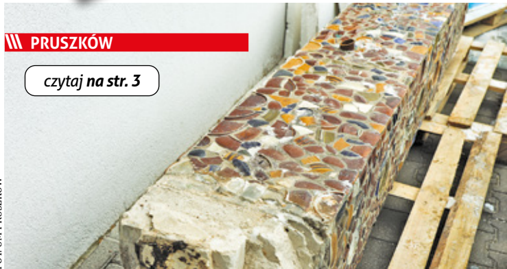
Zachowana mozaika. Jeszcze nie wiadomo, jak zostanie zagospodarowana