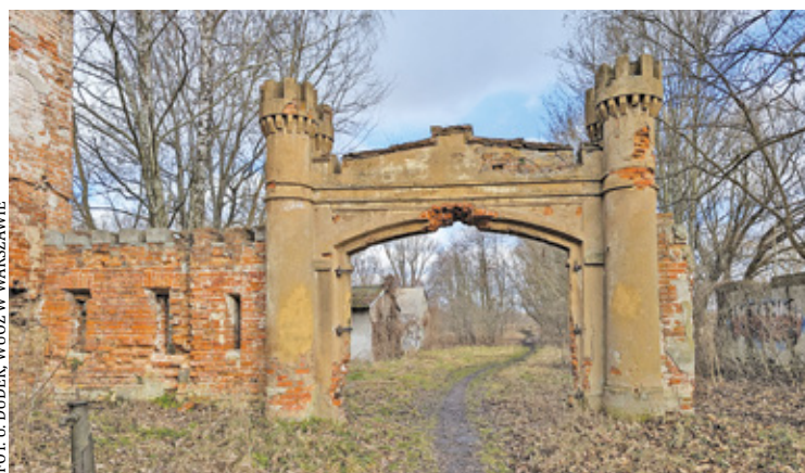
Neogotycka brama, znajdująca się w północnej części zespołu pałacowo-parkowego w Falentach, została oficjalnie wpisana do rejestru zabytków

Brama wraz z murem krenelażowym stanowi integralny element historycznego układu Falent. Jej wartość wynika nie tylko z roli, jaką pełniła w dawnym założeniu pałacowym, ale także z artystycznego opracowania. Zachowane detale architektoniczne, takie jak krenelaż, flankujące przejazd półkolumny, gzymsy i rozglifione otwory, podkreślają neogotycki charakter projektu Lanciego. Stylowa forma bramy stanowiła nie tylko wyraz estetyki