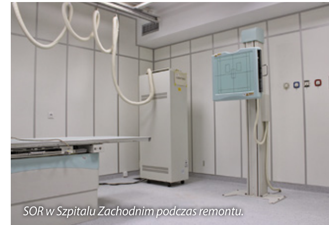
SOR w Szpitalu Zachodnim podczas remontu.

Dokonano także istotnych zakupów sprzętu medycznego i niemedyycznego, takich jak m.in. aparaty do USG, EKG, aparat do hemodynamiki, składarkę do pościeli, łóżka szpitalne, aparat do rehabilitacji falą uderzeniową i aparat do laseroterapii. Ich koszt to blisko 1,4 mln zł (w tym po 300 tys. zł od gmin Grodzisk Mazowiecki i Jaktorów).