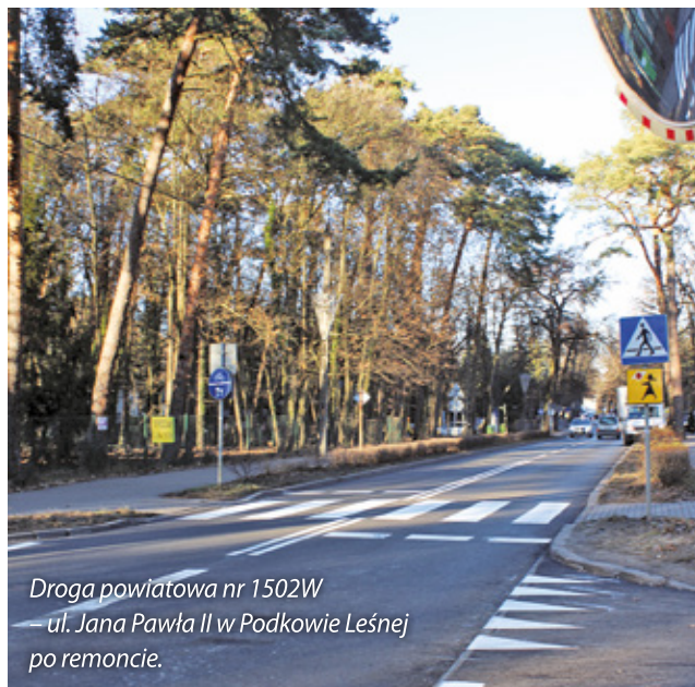
Droga powiatowa nr 1502W ul. Jana Pawła II w Podkowie Leśnej po remoncie.

W 2024 r. rozbudowano drogę powiatową nr 2855W – ul. Kasztanową w Zarębach (gmina Żabia Wola). Na odcinku ok. 480 m wykonano nową nawierzchnię oraz pobocza. Koszt zadania: ponad 550 tys. zł.