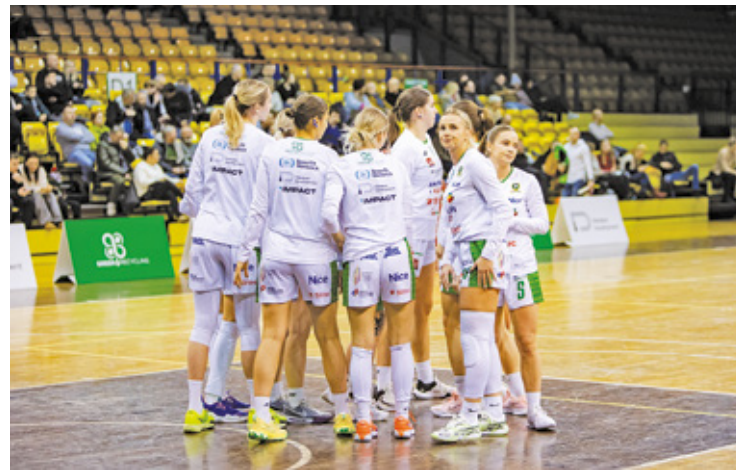
MKS Pruszków idzie jak burza

Zaglądamy do tego, co dzieje się na lokalnych boiskach, a konkretnie w sporcie szkolnym. 21 lutego w Hali Sportowej nr 1 przy Szkole Podstawowej nr 3 w Milanówku miał miejsce turniej piłki nożnej szkół podstawo-