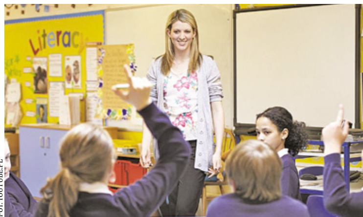
Radnych zaniepokoił pomysł lekcji poselskich. Wywiązała się dość burzliwa dyskusja podczas obrad

„Radni niepotrzebnie się boją. To są spotkania w Sejmie, a nie w szkołach.