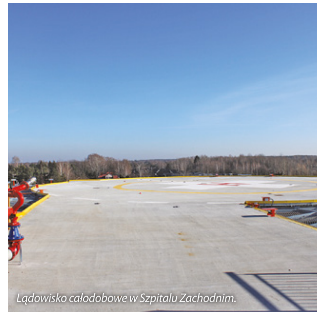
Ładowisko całodobowe w Szpitalu Zachodnim.

Największą zakończoną w 2024 r. inwestycją w Szpitalu była budowa całodobowego ładowiska . Obejmowała m.in. wykonanie płyty ładowiska nad dachem budynku szpitala z niezbędną infrastrukturą, nadbudowę dwóch klatek schodowych oraz budowę zewnętrznego szybu windowego. Dotychczas chorzy byli transportowani z ładowiska oddalonego o 1,5 km od szpitala, co wydłużało czas dotarcia do placówki, ponadto trzeba było zaangażować karetkę do przewożenia pacjenta. Obecnie czas ten znacząco się skróci, co jest niezwykle ważne dla ratowania zdrowia i życia pacjentów.