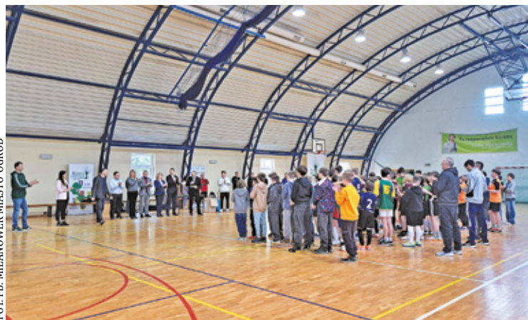
Młodzi piłkarze na turnieju w Milanówku