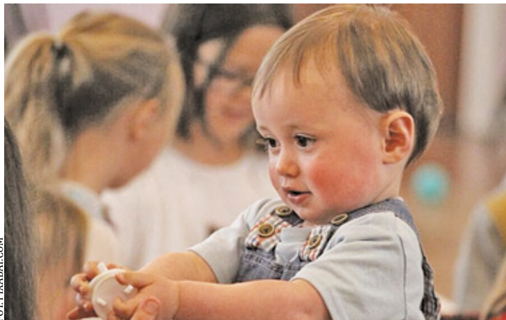
Rekrutacja do przedszkoli rozpocznie się 3 marca o godzinie 8:00

Rodzice mają możliwość wskazania trzech oddziałów przedszkolnych w szkołach podstawowych lub przed-