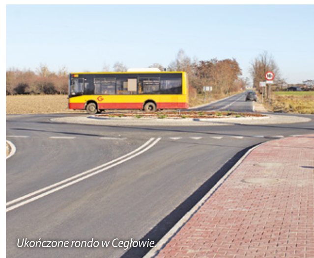
Ukończone rondo w Cegłowie.

Ukończona została także ścieżka rowerowa w ciągu ul. 3 Maja w Grodzisku Mazowieckim , koszt: ok. 1,75 mln zł.