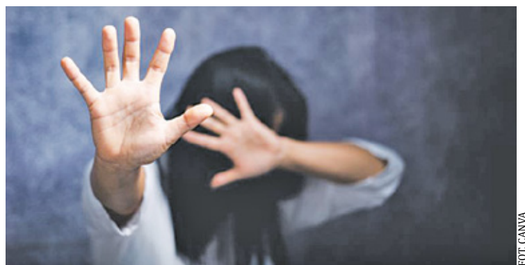
Podjeźrzeni, to obywatele jednego z krajów latynoamerykańskich

Młoda kobieta bawiła się w jednym z klubów w Warszawie.