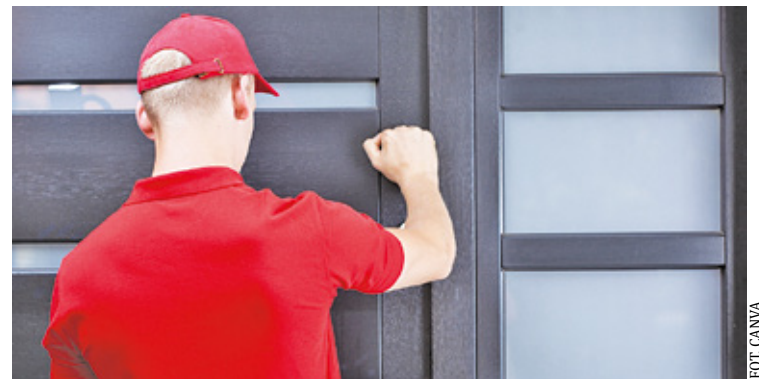
Policja apeluje o zachowaniu czujności

– Jeżeli mamy jakiegokolwiek wątpliwości, należy sprawdzić, czy osoba, która do nas przysłała, jest naprawdę tym, za kogo się podaje. W tym wy-