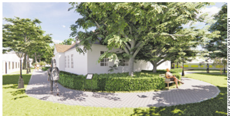
Wokół dworku pojawi się galeria miejska, ozdobiona dekoracyjnym klombem