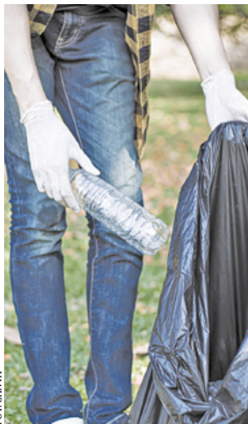
W gminie Nadarzyn sprzątnięcie społeczne organizowane jest dwa razy do roku

– Niestety zawsze jest co robić i co sprzątać. Jednak dzięki zaangażowaniu grupy ludzi jest lepiej choć mogłoby być zawsze lepiej. Od wielu lat prym w ilości zaangażowanych w akcję osób wiezie sołectwo Rozalin