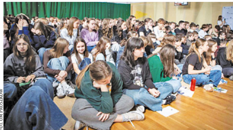
Zajęcia w ramach programu Złote Szkoły NBP odbyły się w pruszkowskiej „dwójce”

Podczas spotkania poruszono tematy kryptowalut, oszustw w sieci i