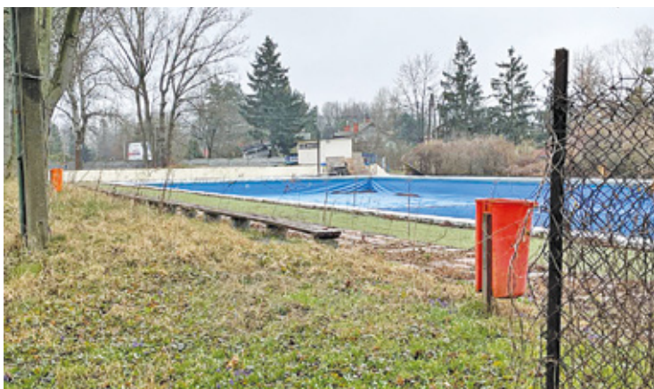
Urząd przedstawił koncepcję zagospodarowania dawnego kąpieliska

Etap I zakłada budowę wodnego placu zabaw, budynku technologii dla tej strefy, drogi, ciągu pieszo-jezdnego,