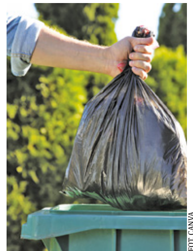
Pozostawienie ulg na obecnym poziomie wiązałoby się ze zwiększeniem deficytu gminnego budżetu o ponad 650 tys. zł

– W ten sposób wybrano i przedstawiono Radzie Gminy Michałowice optymalne rozwiązanie, skutkujące znaczącym obniżeniem istniejącego deficytu finansowania systemu gospodarowania odpadami, ale także korzystniejsze niż funkcjonujące np. w gminie Brwinów, w której ulga kompostownikowa wynosi 6 zł (18% stawki opłaty), a ulga dla posiadaczy Karty Dużej Rodziny 3 zł (9% stawki podstawowej). Przyjęta przez Radę Gminy propozycja zakłada podniesienie stawki opłaty w niezbędnym zakresie oraz rozsądne zbilansowanie wysokości ulgi kompostownikowej i ulgi dla posiadaczy Karty Dużej Rodziny, między innymi w taki sposób, aby osoby korzystające z obydwu ulg nie odczuły podniesienia womości opłaty – podsumował Wojciech Grzeniewski.