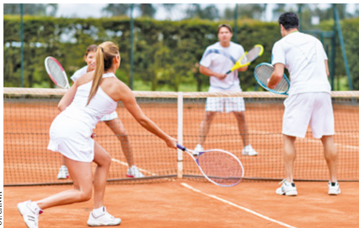
Mimo kilkumiesięcznych rozmów, gminie nie udało się dojść do porozumienia z dotychczasowymi najemcami klubu

Jednak w ostatnich miesiącach miłośnicy tenisa ziemnego byli pozbawieni dostępu do kortów w Komorowie. Mimo kilkumiesięcznych rozmów, gminie nie udało się dojść do porozumienia