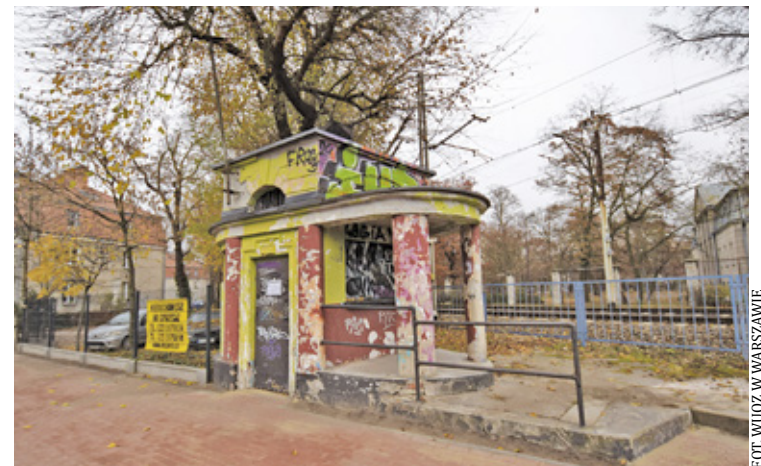
Budynek kasy biletowej stanowi jedyny zachowany fragment przedwojennej zabudowy stacyjnej w tej części Pruszkowa

W czasie II wojny światowej infrastruktura EKD została poważnie zniszczona, jednak dawna kasa biletowa przetrwała ten okres bez większych uszkodzeń. W kolejnych latach, w