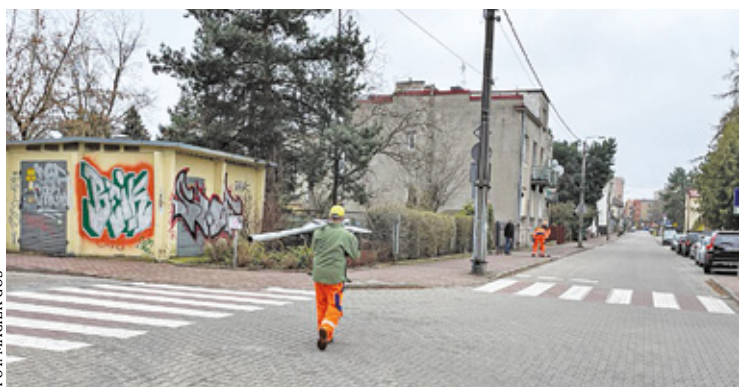
Ul. Moniuszki - prace prowadzone będą etapami, z uwzględnieniem czasowej organizacji ruchu

||| Michałowice - Mniejsza ulga za śmieci s. 9