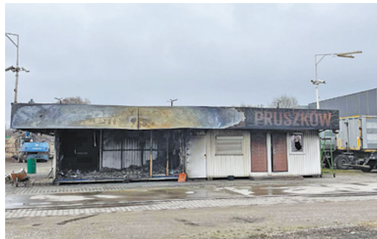
Na placu w Pruszkowie zostało tylko puste miejsce po kultowej maszynie. Nieoficjalnie udało nam się dowiedzieć, że czołg zmienił miejsce pobytu przez kłótnię między wspólnikami.

Ze względu na zawyżyły status prawny i ilość spółek związanych z firmą w