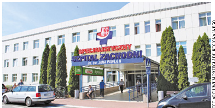
W ramach pozyskanych środków Szpital Zachodni planuje rozbudowę Bloku Operacyjnego

To inwestycja, która realnie wpłynie na jakość leczenia pacjentów z chorobami nowotworowymi w powiecie grodziskim i regionie.