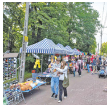
Tak bawiliśmy się rok temu

swoje pomysły i podzielić się opinią o życiu w mieście.