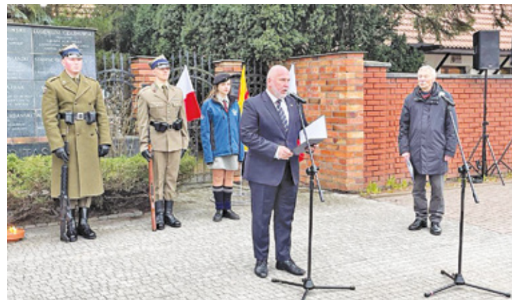
W uroczystościach wzięli udział przedstawiciele Światowego Związku Żołnierzy AK – Koło nr 6 w Pruszkowie, Muzeum Dulag 121, powiatu pruszkowskiego, Miasta Pruszkowa oraz sąsiadujących gmin

W 80. rocznicę porwania w Pruszkowie odbyła się uroczystość ku pa-