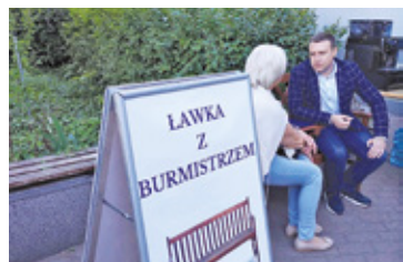
Akcja „Ławeczka z Burmistrzem” przyjęta się w mieście

Niedziela rozpocznie się występami dzieci i młodzieży z piastowskich szkół w godzinach 16.00 – 19.30. O 20.00 czeka nas koncert zespołu Lanberry. Tego dnia, w godzinach 17.00 – 19.00 odbędzie się też już znana mieszkańcom „Ławeczka z Burmistrzem”, czyli okazja, żeby porozmawiać z gospodarzem Piastowa, przekazać mu