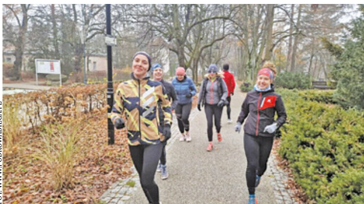
Jednym z wydarzeń będzie Bieg Stulecia. Zapisy na www.podkowabiega.pl . Niektórzy już ćwiczą przed startem

Dla rannych ptaszków zaplanowano happening na stacji WKD w Podko-