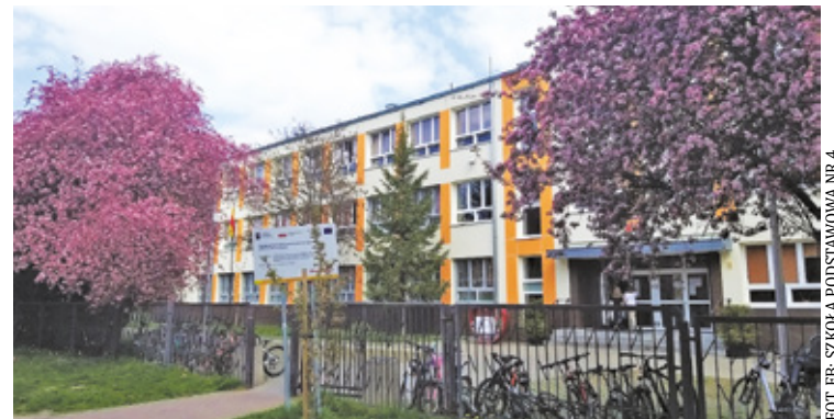
Szkoła Podstawowa nr 4 przy ul. Hubala 4 w Pruszkowie wreszcie doczeka się boiska na miarę XXI wieku

Inwestycja w SP nr 4 to przemysłowe działanie, które łączy funkcje