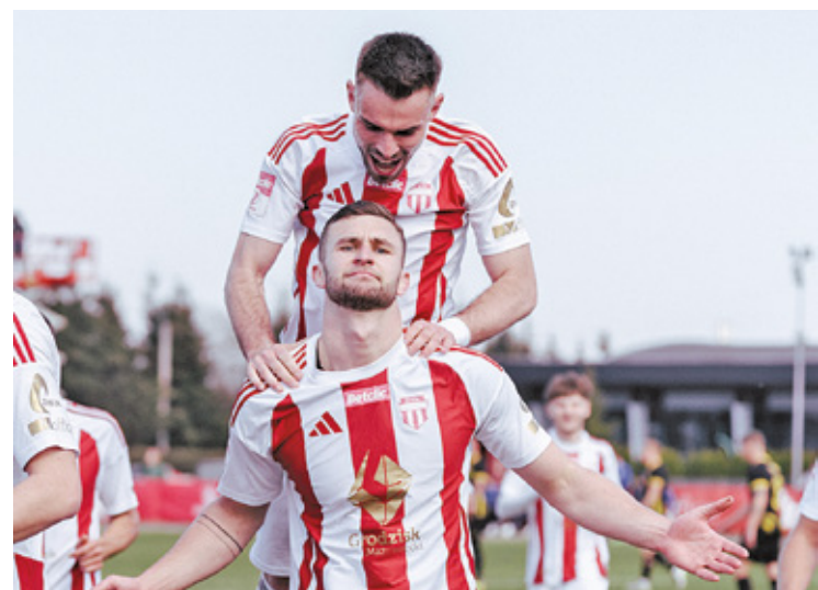
Radość piłkarzy z Grodziska Mazowieckiego