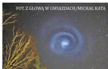
Wiele osób zastanawiało się, czym jest to tajemnicze światło na nocnym niebie

Wiele osób zastanawiało się, czym jest to tajemnicze światło. Czy to UFO? Okazuje się, że nie był to obiekt pozaziemski. Zjawisko, które przyciągnęło uwagę wielu obserwatorów, to przelot drugiego stopnia rakiety Falcon 9 – rzadki i efektowny widok na nocnym niebie.